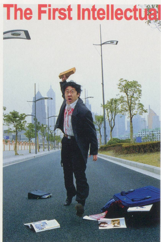
YANG FUDONG, THE FIRST INTELLECTUAL , 2000, photograph, 2000, 76 x 50" / DER ERSTE INTELLEKTUELLE , Photographie, 193 x 127 cm.

Yang Fudong gelingt der Dialog und der Ausgleich zwischen dem Ich und der äusseren Welt. Diese Fähigkeit geht nicht von einem bestimmten Glauben oder von Glaubenssätzen aus, sondern ist vielmehr ein Prozess, in dem er sich unaufhörlich auf sein gesellschaftliches Umfeld einlässt, es studiert und erfühlt. In diesem Gegensatz zwischen persönlichen Idealen und gesellschaftlichem Umfeld fragt er unaufhörlich nach dem Sinn des Lebens. Auf der Suche nach einem Ort für seine Ideale hat er sein Selbst nie aufgegeben. Sein Erkunden des Lebensweges beruht auf einer Grundlage philosophischer Art: Die Kunst ist für ihn zu einem Mittel geworden, das Leben zu praktizieren, während umgekehrt diese künstlerische Praxis ihm die Motivation und Energie verleiht, ins Leben einzutauchen.