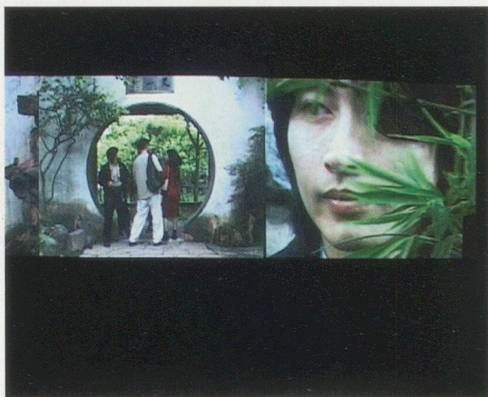
YANG FUDONG, TONIGHT MOON, 2000, video installation, 1 projection, 24 small and 6 big monitors / HEUTE MOND, Videoinstallation, 1 Projektion, 24 kleine und 6 grosse Monitore.

Intellektuelle im Bambuswald, seit 2003), verdeutlichen seine Wandlung von einem aufgebrachten Jugendlichen ohne Perspektiven zu einem Menschen, der versucht, zwischen Ideal und Wirklichkeit zu leben. Dieser Wandel bedeutet kein passives Annehmen der Wirklichkeit, sondern zeigt vielmehr, dass er eine einseitige Weltanschauung der Gesellschaft und dem Leben gegenüber abgelegt hat, um aktiv nach einer anderen Art des Daseins zu suchen. Aus Yang Fudongs Werken spricht eine einheitliche Grundstimmung: Das Anerkennen und Aufspüren von Selbstachtung und geistiger Eigenständigkeit.