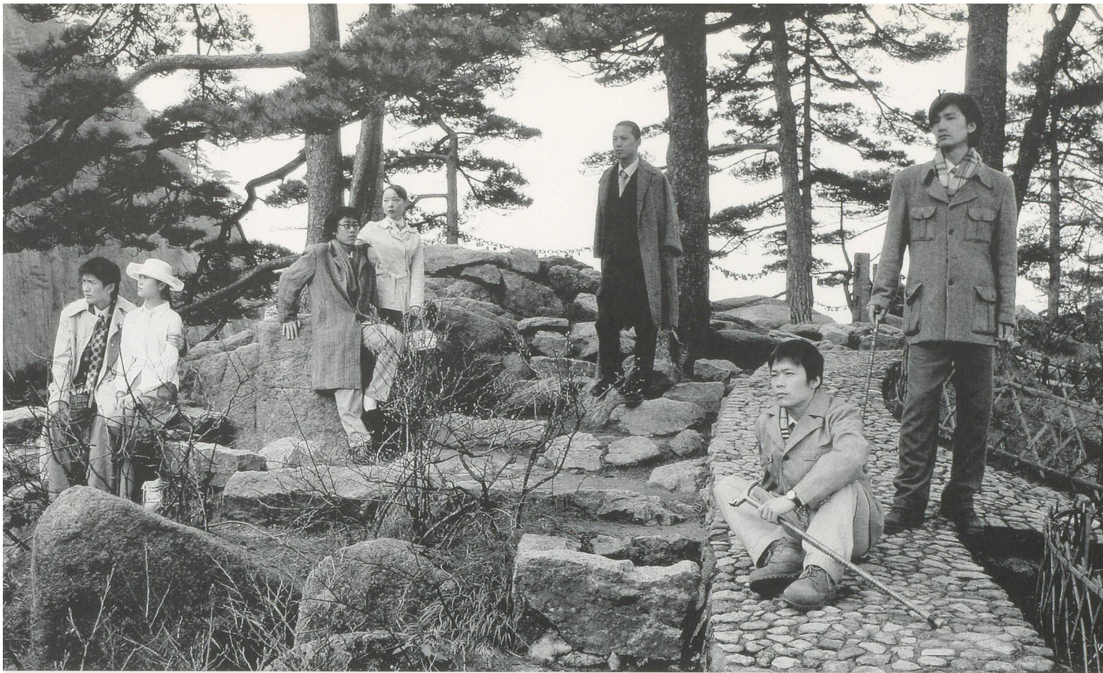
YANG FUDONG, SEVEN INTELLECTUALS IN BAMBOO FOREST, Part 1 , 2003, 35mm b/w film, 29', music by Jin Wang / SIEBEN INTELLEKTUELLE IM BAMBUSWALD, Teil 1.

dem Ich und den Objekten zu entwickeln. Die konkrete Welt bedeutet für ihn nicht die sichtbare Gestalt der Dinge, sondern vielmehr die Veräusserlichung eines inneren, geistigen Fließens. Bisweilen wird dieses Fließen zu einer intensiven Metapher für das Leben selbst. Entscheidend ist, dass in den Werken von Yang Fudong dieses scheinbar nicht klar definierbare Überdenken und Aufspüren eines geistigen Weges dennoch auf so direkte Art zum Ausdruck kommt. Für ihn existiert es ganz konkret in unserem Leben: «Ein schönes Leben ist nicht unbedingt ein Luxus. Manchmal fühle ich, dass die Wirklichkeit sehr kalt ist. Die Menschen sind sehr kalt. Es scheint, als könnte man sich kaum an die Kindheitsträume erinnern. Aber wenn du noch Träume in deinem Herzen hast, kannst du vielleicht entdecken, dass das Leben eigentlich sehr schön ist.» 3)