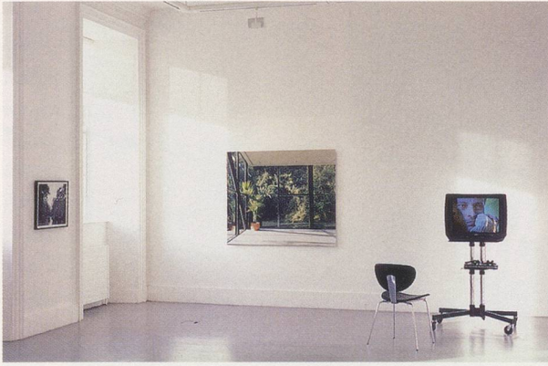
GERARD BYRNE, NEW SEXUAL LIFESTYLES , 2003, 3-channel video installation with 7 photographs, photograph and installation view at the Irish Museum of Modern Art / 3-Kanal-Videoinstallation mit 7 Photographien, Photographie und Installationsansicht.

which provides an incidental comment on the ongoing critical tussle for Beckett's legacy between celebrants of international literary modernism and the proponents of national or otherwise devolved literary canons newly revised in the light of post-colonial theory. This negotiation between the local and the global, as well as between different media, is also evident in IN REPERTORY (2004) commissioned by Dublin's Project Arts Centre, an institution which has a long history of accommodating both performing and visual arts within the same building. Ignoring the Project's purpose-built, black-box theater space, Byrne chose instead to paint the adjacent white-cube gallery space black and fit it out with stage lighting. Ranged around this displaced theater set were a number of reconstructed props and elements of stage design gleaned from the history of classic theater productions. These included a handmade version of a tree originally designed by Alberto Giacometti for a 1961 production of Waiting for Godot at the Odéon in Paris, a painted backdrop from a 1943 Broadway production of Rodgers & Hammerstein's Oklahoma! , and the ramshackle covered wagon from a 1963 Broadway production of Bertolt Brecht's Mother Courage . Gallery visitors were invited to move around the starkly lit stage set, from which they