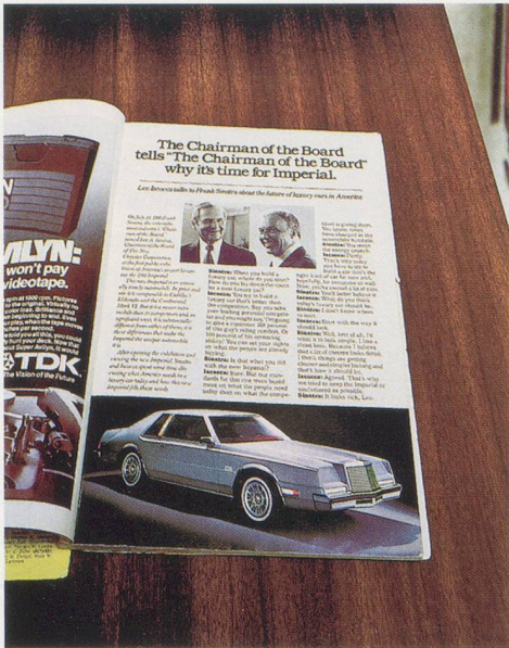
GERARD BYRNE, WHY IT IS TIME FOR THE IMPERIAL, AGAIN , 1998–2002, Fuji Crystal archive print, 20 3 / 4 x 24 3 / 4 ”/ WARUM ES WIEDER ZEIT IST FÜR DEN IMPERIAL , Print auf Fuji Crystal Archivpapier, 53 x 63 cm.

first and foremost—initially saw the light of day in the print medium, at a time when that medium had already been subjected to successive assaults on its pre-eminence as a source of immediate information about the world we live in. All bear the indelible marks of the particular set of social, cultural, political, and economic circumstances that called them into existence over a quarter of a century ago. And all three have, during the course of the past few years, been disinterred from their original contexts by Gerard Byrne and reconstituted in a medium and a milieu in which they sit with an undeniable awkwardness—alien, anachronistic and ill at ease. By choosing to restage with hired actors these sometimes risibly outdated verbal exchanges, to be filmed, edited, and presented within the contemporary idiom of the single-channel or multi-channel video installation, Byrne deliberately amplifies our already considerable sense of distance from the views they ventriloquize. Yet this strategy also serves to provide the requisite mix of detachment and fascination, reflexivity, and nostalgia, to review with relative dispassion the issues discussed, the formats in which they were originally framed, and the historical