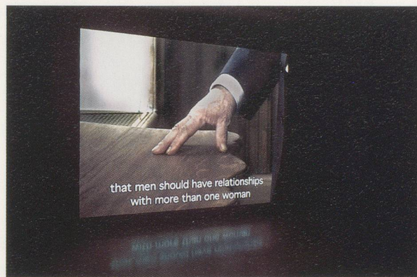
GERARD BYRNE, HOMMES À FEMMES (MICHAEL DEBRANE), 2004, 1-channel video projection with Dolby sound, video still and installation view / SCHÜRZENJÄGER , 1-Kanal-Videoprojektion mit Dolby-Klang, Videostill und Installationsansicht.

WHY IT'S TIME FOR IMPERIAL, AGAIN (Warum es wieder Zeit ist für den Imperial, 1998–2000) ist die auf Video aufgenommene Rekonstruktion eines so