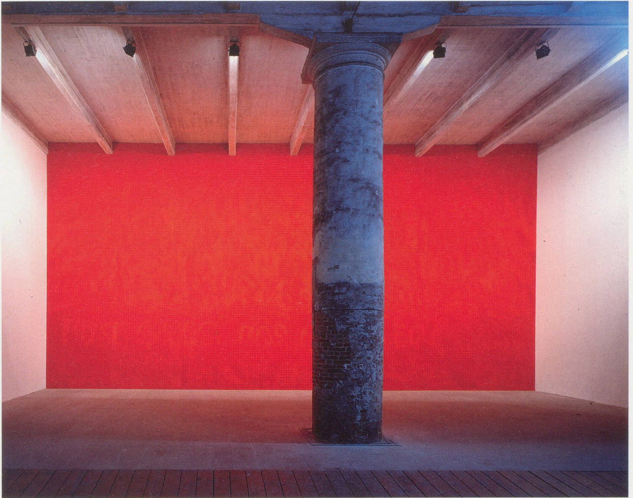
RUDOLF STINGEL, APERTO 93, installation view / Ausstellungsansicht, Venice Biennale, 1993.