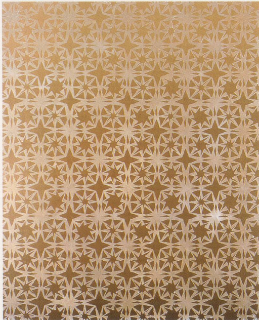
Top left and right: RUDOLF STINGEL, UNTITLED, 2004, oil and enamel on canvas, 82 7 / 8 x 67 1 / 8 " / OHNE TITEL, Öl und Email auf Leinwand, 210,5 x 170,5 cm.