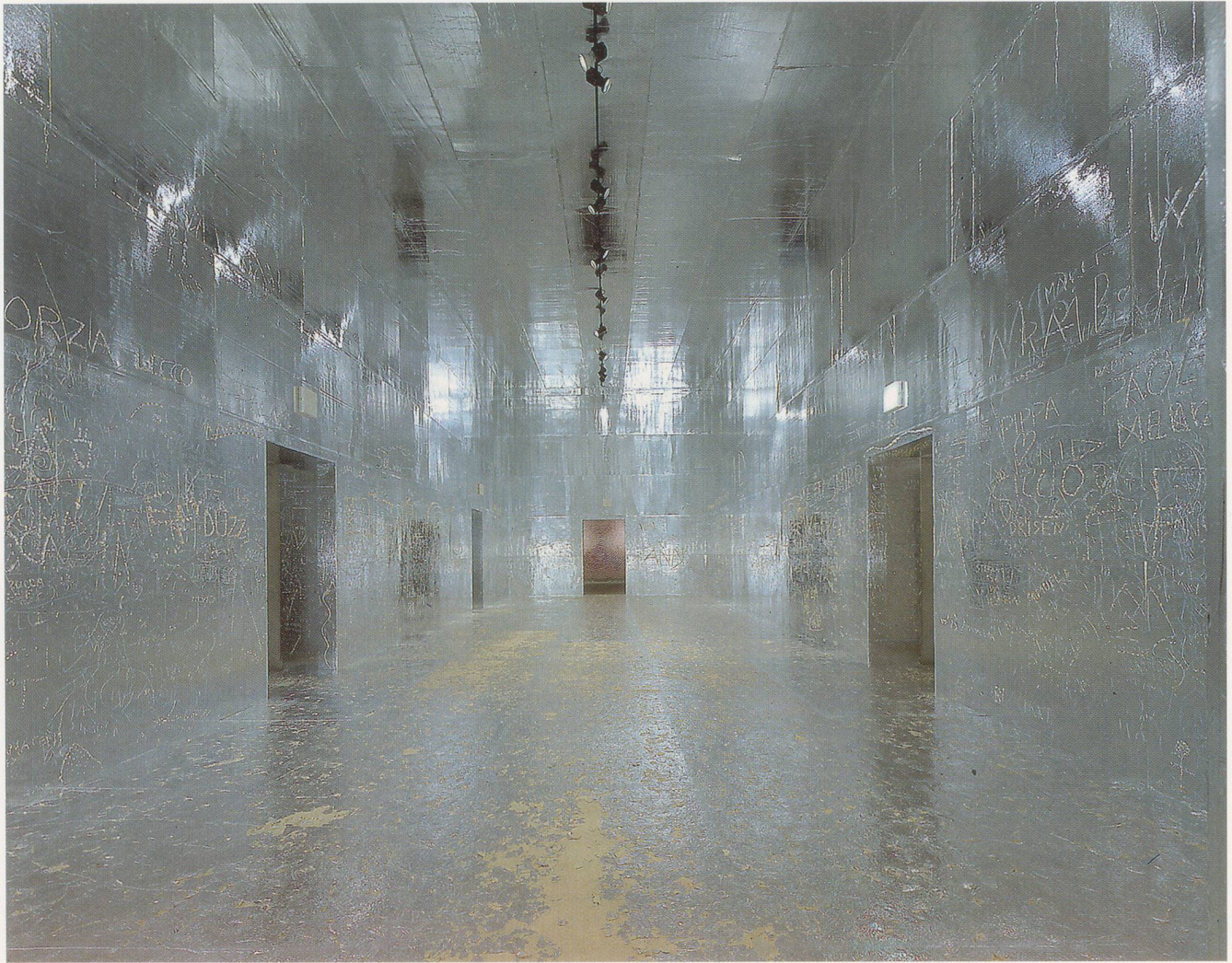
RUDOLF STINGEL, installation view / Ausstellungsansicht , Museo d'Arte Moderne e Contemporanea, Trento, Italy, 2001.