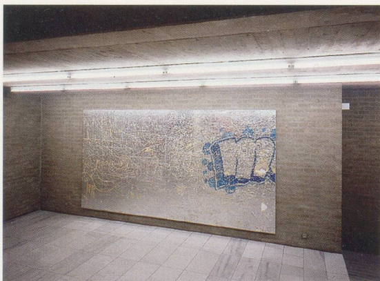
RUDOLF STINGEL, installation view / Ausstellungsansicht , Galerie Schmela, Düsseldorf, 2003.