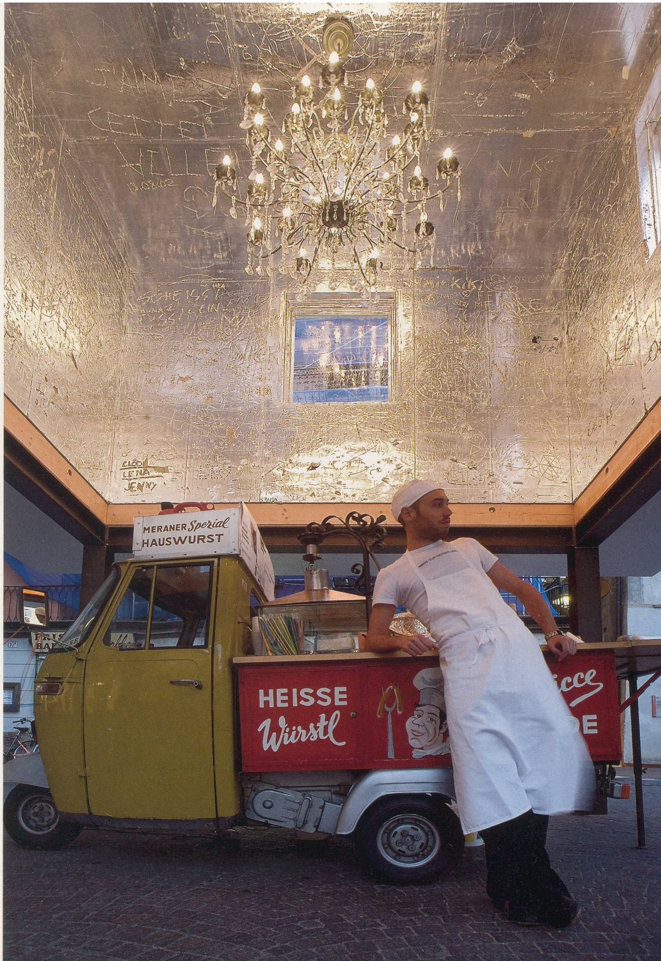
RUDOLF STINGEL in collaboration with Franz West, UNTITLED, 2006, kiosk installation, Bolzano, Italy.