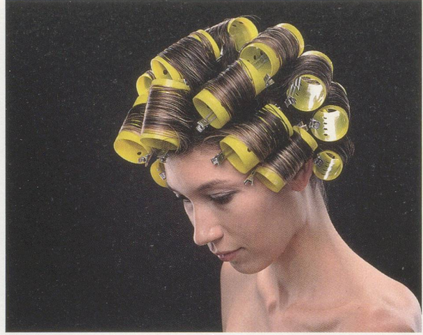
CHRISTOPHER WILLIAMS, Rollerstacker, R-136MR , 2005, C-print, triptych, each 16 x 20" / C-Print, Triptychon, je 40,6 x 50,8 cm, from / aus "Program. For Example: Dix-Huit Leçons Sur La Société Industrielle (Revision 1-4)."

are three groups of photographs. The first group, a series of black-and-white gelatin silver prints, shows a young female model partially obstructed by the crinkled glass of a shower stall door, with shampoo foam in her hair. In the different pictures, she strikes a sequence of poses, massaging the shampoo into her scalp, smiling at the camera, and gazing dreamily outside of the frame. The second group shows the same model wrapped in two yellow towels—one around her torso, the other with a turban tied around her head—smiling and laughing, fully aware of the camera. The left side of these pictures, which in the previous series was taken up by the shower divider, now prominently displays a Kodak Three Point Reflection Guide , held in place by a photo clamp. A third series of photographs, united into a triptych, shows the young woman with yellow curlers in her hair, her gaze directed first downward and then away from the camera.