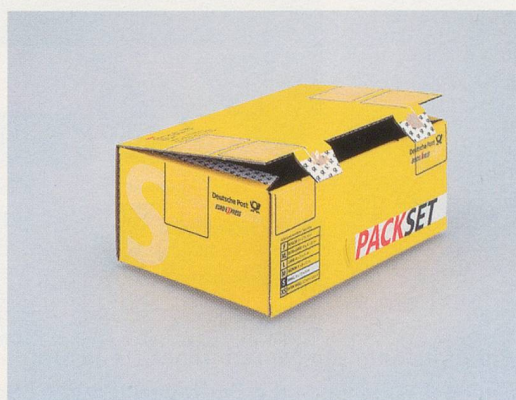
CHRISTOPHER WILLIAMS, Packset, Deutsche Post , 2003, dye transfer print, 16 x 20" / Dye-Transfer-Abzug, 40,6 x 50,8 cm, from / aus "Program. For Example: Dix-Huit Leçons Sur La Société Industrielle (Revision 1-4)."

famously called the "society of the spectacle." Ultimately, photography serves for Williams as the programmatic example through which one can revise thinking about the conditions of our modern industrial society, as a visual technology that partakes in both culture and industry.