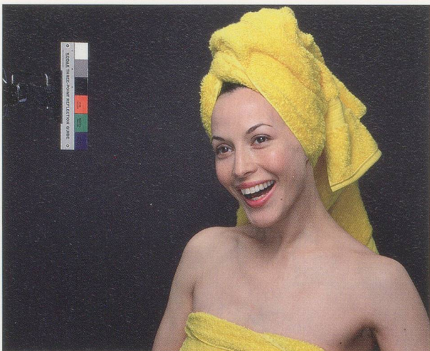
CHRISTOPHER WILLIAMS, Kodak Three Point Reflection Guide , 1968, 2005, C-print, each 20 x 24" / C-Print, je 50,8 x 61 cm, from / aus "Program. For Example: Dix-Huit Leçons Sur La Société Industrielle (Revision 1-4)."