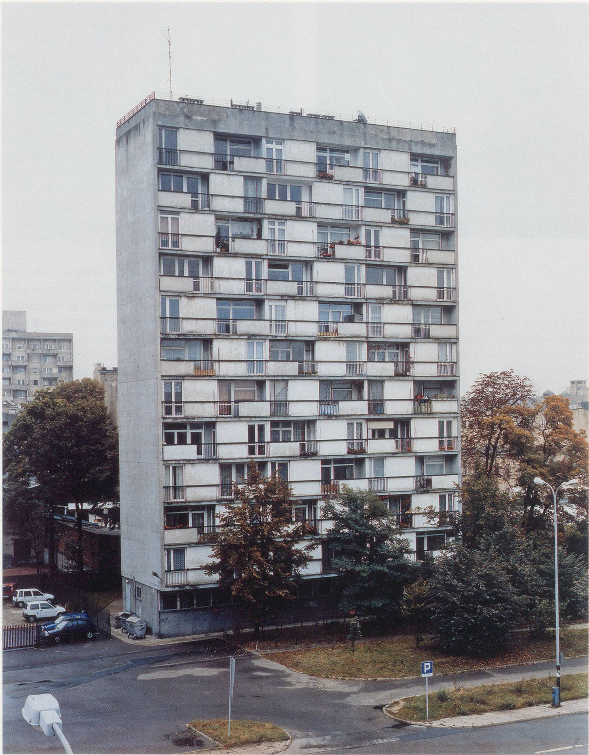
CHRISTOPHER WILLIAMS, Lodz, October 2, 2004, C-print, 24 x 20" / Lodz, 2. Oktober 2004, C-Print, from / aus "Program. For Example: Dix-Huit Leçons Sur La Société Industrielle (Revision 1-4)."