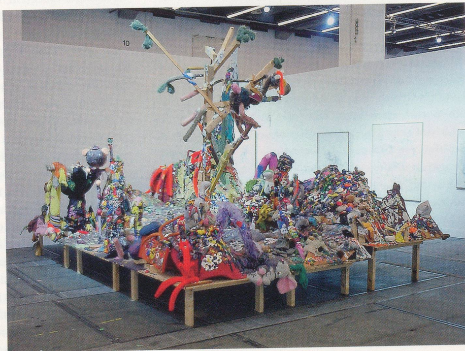
GELITIN, SCULPTURE FOR AN AIRPORT, 2006, Plasticine, wood, fabric, 147 1/2 x 195 x 118" / SKULPTUR FÜR EINEN FLUGHAFEN, Plastilin, Holz, Stoff, 375 x 495 x 300 cm.

Delirös bedeutet so viel wie de linia ire – «über die Linie» gehen, sie queren, auch verlassen. An dieser Verwegenheit gewachsen, sind Gelitin kaum mehr Abgrenzungs-Avantgardisten, wie es die österreichische Nachkriegs-Moderne im Wesentlichen war. Mentalitätsgeschichtlich bedeutet dies eine gelungene Absage an das Konzept des «romantischen Künstlergenies», welches aus Leidensinnerlichkeit «Wahrheitströpferln» herauspresst, um dann künstlerische Gegenwelten zu schaffen. So auch die Grössen der «Wiener Gruppe», welche um die «Verbesserung Mitteleuropas» 3) wissend noch Meisterliches vor Augen hatten. Generationsmässig ist Gelitin da nicht mehr mit dabei, dem Autoritätskern solchen Meistertums wird gründlich misstraut, was einem Reinhard Priessnitz schon seinerzeit nicht entgangen war. Kein Leidensdiplom soll mehr absolviert werden, Gelitins