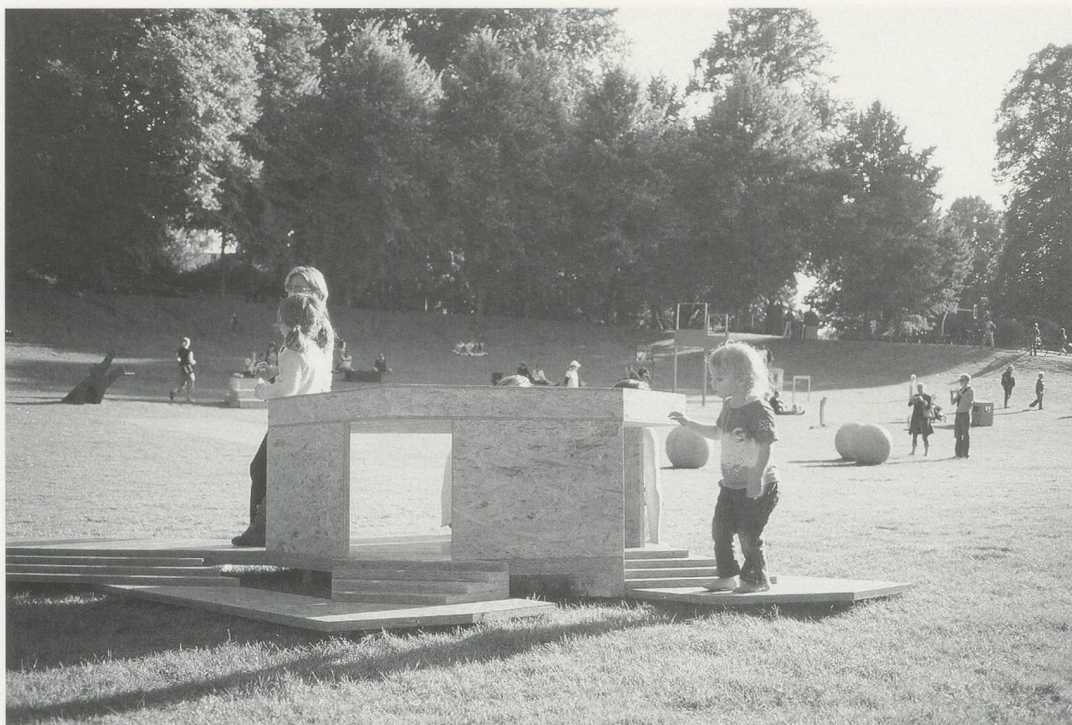
DOMINIQUE GONZALEZ-FOERSTER, ROMAN DE MÜNSTER ( Novel of Münster / Münster Roman ), 2007, installation view / Installationsansicht, Skulptur Projekte Münster.

konstruiert, die wir alle in uns tragen, und keine Sekunde zeigt sie Hemmungen, auf diese emotionalen Eigenschaften des Betrachters anzuspielden und in ihm eine Gefühlslandschaft entstehen zu lassen. In ihrem umfangreichen Werk sind es vor allem die environnements , die geistig-emotionale Landschaften in uns evozieren.