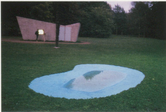
DOMINIQUE GONZALEZ-FOERSTER, PARK, PLAN D'ÉVASION ( Park, Plan for Escape / Flucht- plan ), 2002, installation view / Installationsan- sicht, Documenta 11, Kassel.