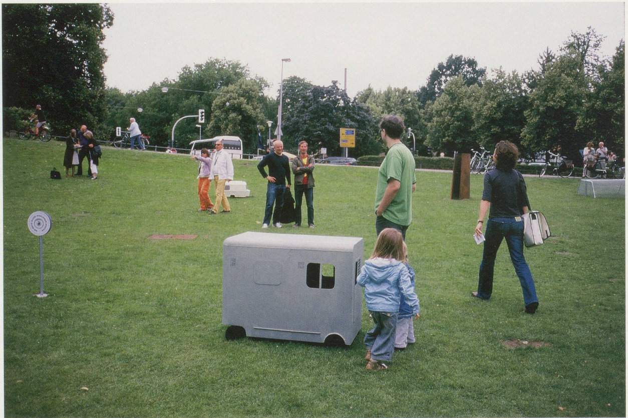
DOMINIQUE GONZALEZ-FOERSTER, ROMAN DE MÜNSTER (Novel of Münster / Münster Roman), 2007, installation view / Installationsansicht, Skulptur Projekte Münster.

It is not surprising that critics have referred to Gonzalez-Foerster's work as a time machine. Her environments are capable of eliciting not only time travel but a moving through space like that of a futuristic tele-transporter. This is palpable in both PARK/PLAN D'ÉVASION and in UNE CHAMBRE EN VILLE (1996). In the former, one comes across dissimilar objects that belong to diverse, remote regions; in the latter, the television, the newspaper, and the telephone grant us access to different exteriors. All the spaces are interconnected, opening up