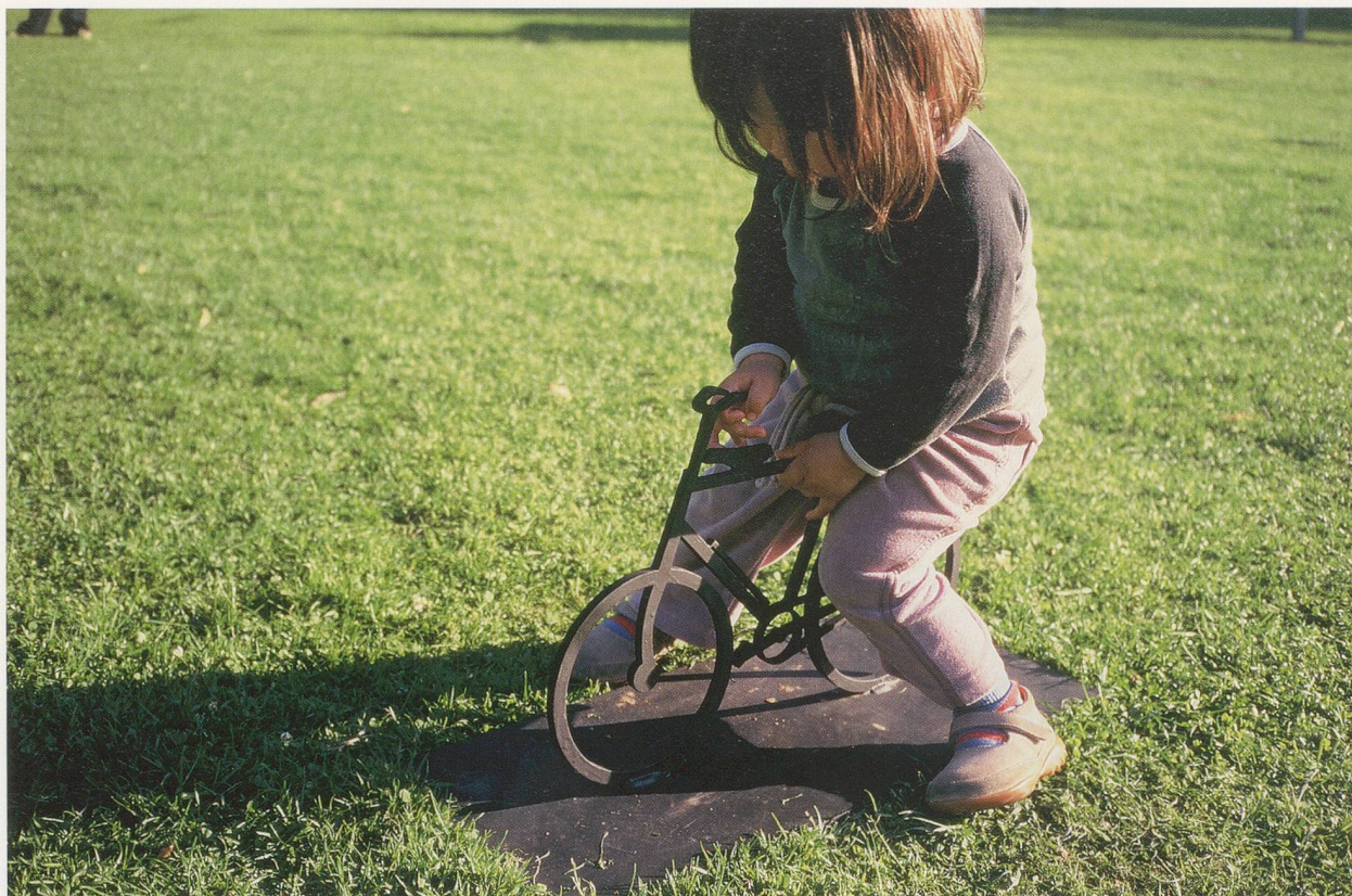
DOMINIQUE GONZALEZ-FOERSTER, ROMAN DE MÜNSTER (Novel of Münster / Münster Roman), 2007, installation view / Installationsansicht, Skulptur Projekte Münster.

of these mental-affective landscapes, and with which we are here concerned.