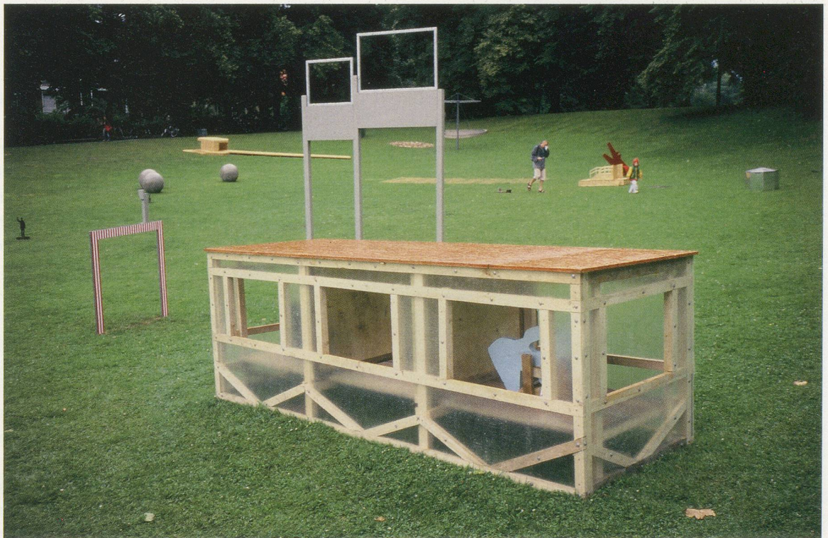
DOMINIQUE GONZALEZ-FOERSTER, ROMAN DE MÜNSTER (Novel of Münster / Münster Roman), 2007, installation view / Installationsansicht, Skulptur Projekte Münster.