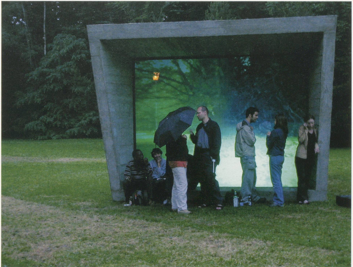
DOMINIQUE GONZALEZ-FOERSTER, PARK, PLAN D'ÉVASION (Park, Plan for Escape / Fluchtplan), 2002, installation view / Installationsansicht, Documenta 11, Kassel.

um uns der Geborgenheit und dem Müsiggang zu überlassen.