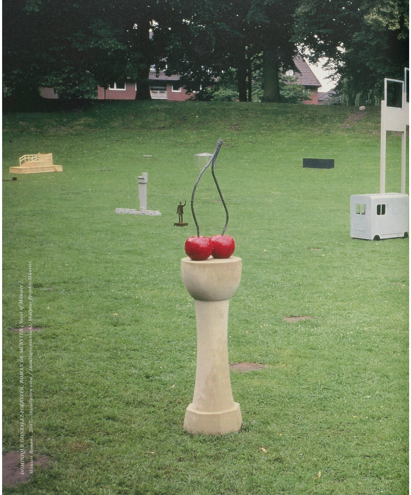
DOMINIQUE GONZALEZ-FOERSTER, ROMAN DE MÜNSTER (Novel of Münster / Münster Roman), 2007, installation view / Installationsansicht, Skulptur Projekte Münster.