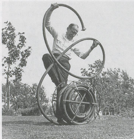
LEE MILLER, SAUL STEINBERG FIGHTS WITH THE GARDEN HOSE IN A MANNER ALL HIS OWN, 1952.

schen» Gemälden und Zeichnungen der 50er-Jahre hatte er der Linie viel Aufmerksamkeit geschenkt. Später, bei seinen linearen Skulpturen der 60er-Jahre, wurde die Linie dreidimensional, verkörpert durch Objekte wie hölzerne Speere, Haken und Stöcke oder durch die Verwendung von Seilen, Schnüren und Kabeln. Im Jahr 1968 entdeckte der Künstler ein neues Material: blaues Klebeband, das es ihm erlaubte, die Linie horizontal zu ver-