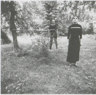
Edward Krasinski, first interventions with blue scotch, Zalesie, 1969 / Erste Versuche mit blauem Klebeband.

beteiligt sind oder aber den Aufbau ihrer fertigen Arbeit vor Ort beaufsichtigen. Indem er sich selbst als einen Arbeiter unter anderen inszenierte, unterstrich Krasinski die Ähnlichkeit künstlerischer und anderer Formen der Arbeit, oder besser gesagt, weil auf den Aufnahmen gar nicht gearbeitet wird, betonte er, wie wichtig es sei, ab und an eine Pause einzulegen.