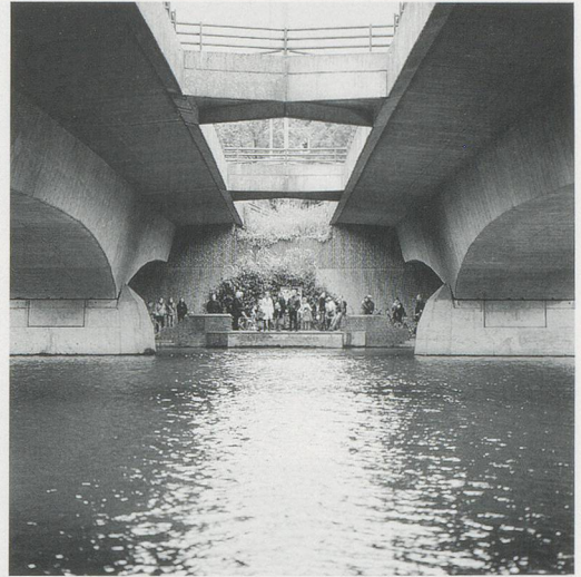
SUSAN PHILIPSZ, THE LOST REFLECTION , 2007, sound installation, Skulptur Projekte Münster / DAS VERLORENE SPIEGELBILD , Klanginstallation.

Die besondere Akustik der Arbeit vom verlorenen Spiegelbild (THE LOST REFLECTION, 2007) zwischen Brückenbogen und Wasserfläche erzeugt ein Echo, das mit beiden Stimmen zwischen den Ufern hin und her jongliert. Unweigerlich nimmt man mit dem Schall auch eine visuelle Information auf. Selbst wenn man sich nur aufs Gehör verlässt, ist klar: Dieser Raum ist vermutlich leer und wahrscheinlich verfügt er über eine gewisse Ausdehnung. Denn nur in grösseren, leeren Räumen kommt ein kräftiger Widerhall zustande und jeder Gegenstand würde die Ausbreitung der Schallwellen behindern. So tritt der Ort durch das Gehör in Erscheinung. Das Echo entfaltet – frei von einer sichtbaren Gestalt – eine Präsenz im Raum, die starke visuelle Vorstellungen freisetzt. Seinen Namen trägt der Widerhall nach der gleichnamigen griechischen Sagengestalt, die auf tragische Weise ihren Körper verliert. Nachdem sie Jupiter bei seinen sexuellen Eroberungen behilflich war, wird Echo von der Göttergattin Juno mit dem Verlust ihrer eigenen Stimme bestraft. Fortan wird sie nur noch die beiden letzten Worte wiederholen können, die an sie gerichtet werden. Bald darauf bringt sie ihre unglückliche Liebe zu Narcissus auch noch um den eigenen Körper: Echo verzehrte sich so lange nach dem selbstverliebten Jüngling, bis nur noch ihre Stimme übrig blieb. 3) Als körperlos Anwe-