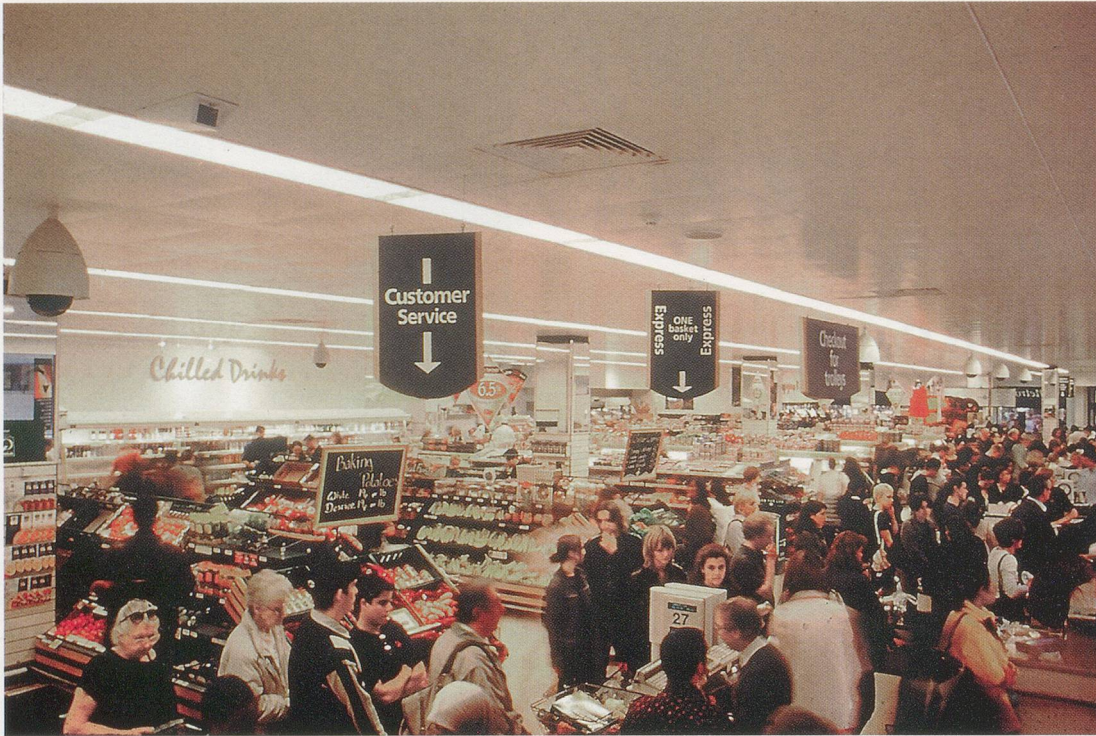
SUSAN PHILIPSZ, METROPOLA, 2005, Tesco Supermarket, London.

Im Widerhall von Philipsz' gesungenen Erzählungen werden nicht nur Räume von Klängen nachgezeichnet, der sichtbare Raum kommentiert umgekehrt auch die hörbare Musik. Entsteht daraus etwa ein neues Gesamtkunstwerk, das die Kunstgattungen synästhetisch unter einem gemeinsamen Ziel vereint? Seit dem 19. Jahrhundert wurde dieses Konzept namentlich durch den Komponisten Richard Wagner bekannt, der Musik, Sprache und Raumgestaltung in eine untrennbare Einheit überführen wollte. So ruft der tragische Opernheld Tristan 5) kurz vor seinem Tod in den Bühnenraum hinein: «Wie – hör ich das Licht?» Die Vermutung Wagners, dass alle Sinne immer gleichzeitig wahrnehmen und somit keine Hierarchie zwischen den Eindrücken existiert, wurde nicht zuletzt durch die neurophysiologischen Erkenntnisse der vergangenen Jahrzehnte bestätigt. 6) Der Ausstellungsmacher Harald Szeemann