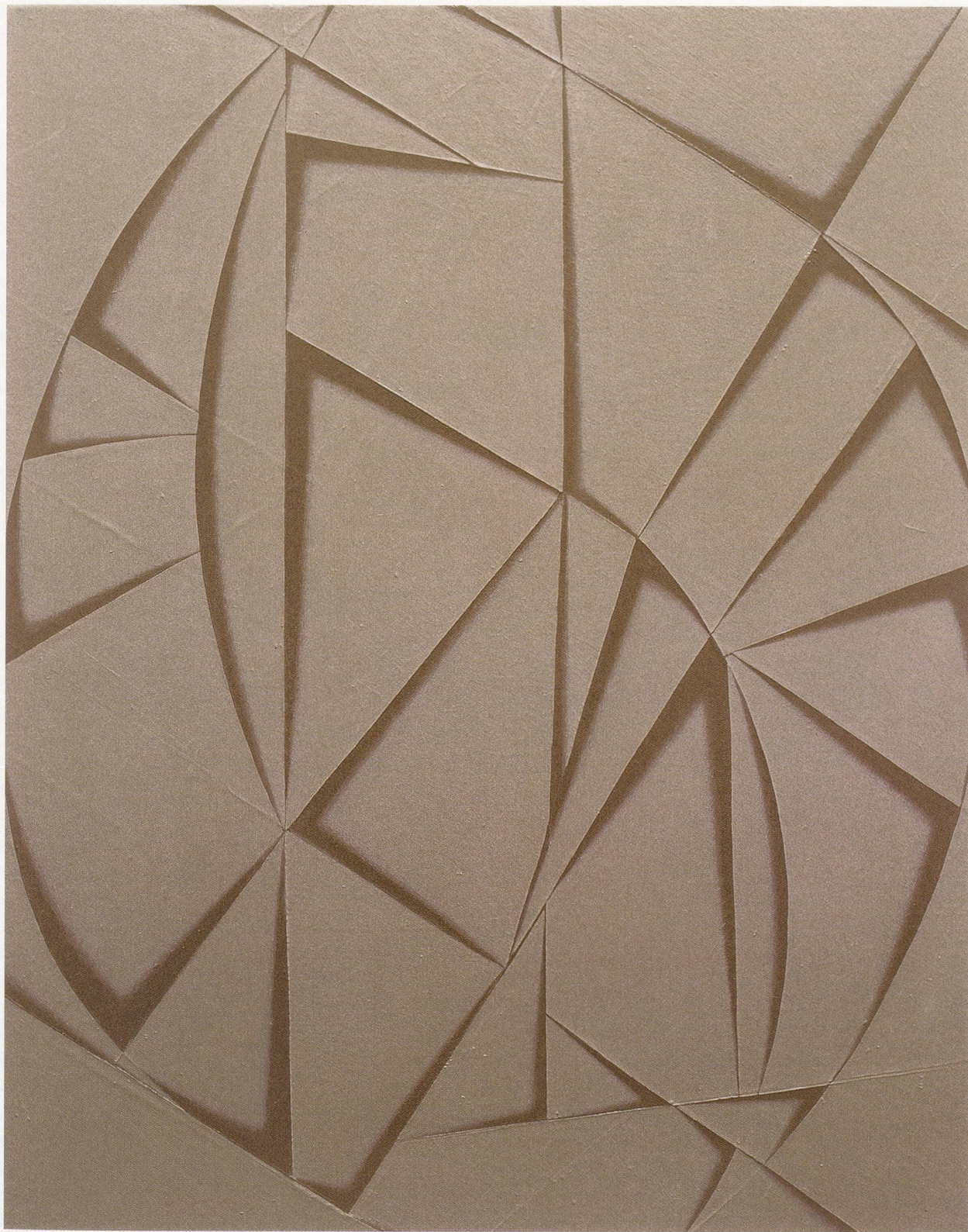
TOMMA ABTS, EPKO, 2001, acrylic and oil on canvas, 18 7/8 x 15" / Acryl und Öl auf Leinwand, 48 x 38 cm.