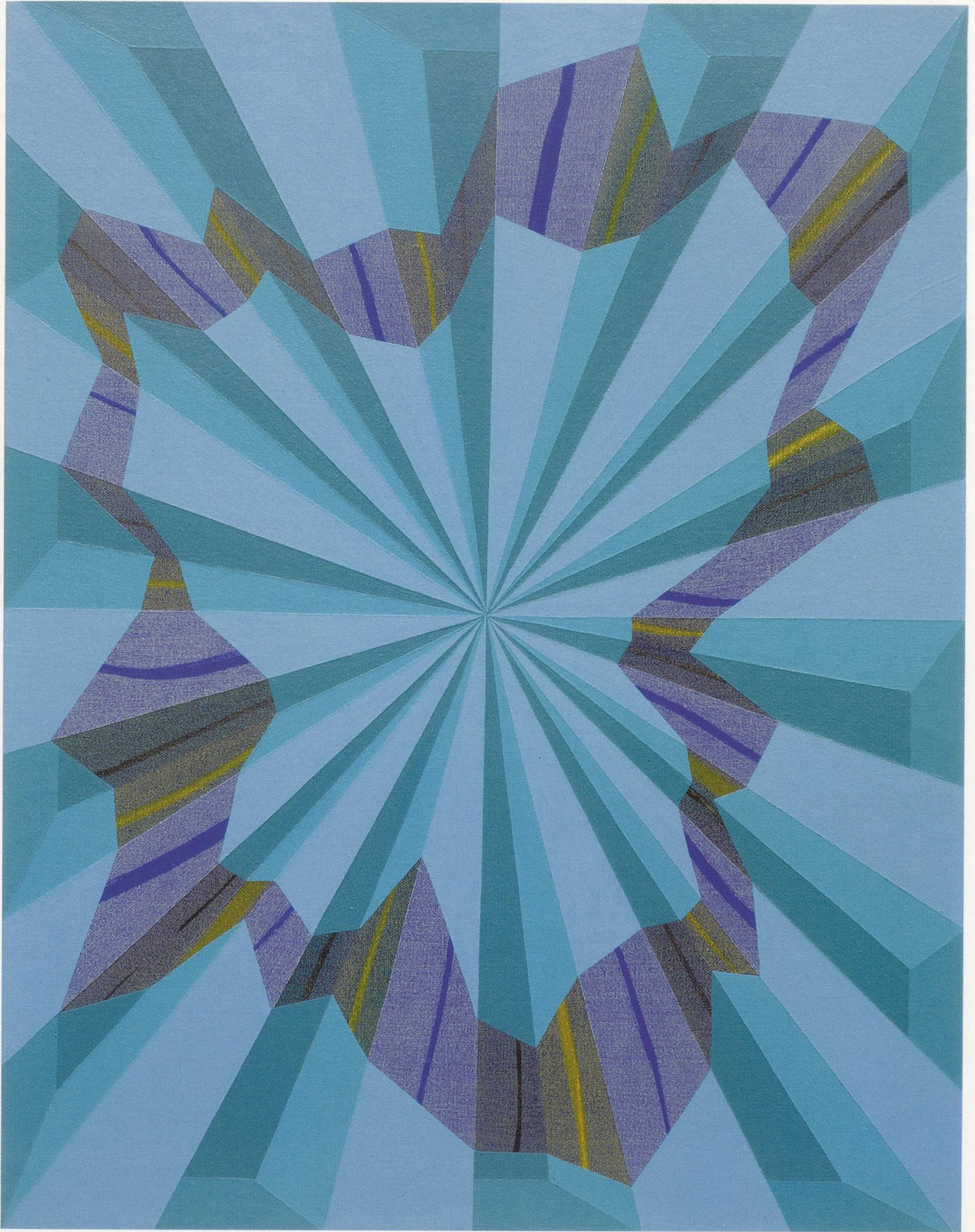
TOMMA ABTS, TEDO, 2002, acrylic and oil on canvas, 18 7/8 x 15" / Acryl und Öl auf Leinwand, 48 x 38 cm.