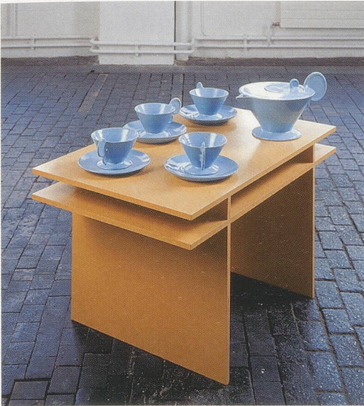
MAI-THU PERRET, Mescaline Tea Service, 2002,

4 ceramic cups, saucers, teapot, wood and lacquer table, 20 5/8 x 22 1/4 x 35 1/2" / 4 Keramiktassen, Unterteller, Krug, Holz- und Lacktisch, 52,5 x 56,5 x 90 cm.