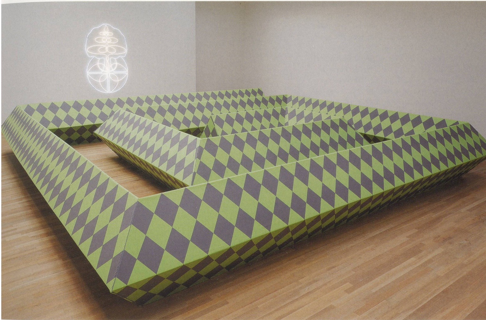
MAI-THU PERRET, WE , 2007, mixed media, cotton fabric, 47 1/4 x 307 x 307" / WIR , verschiedene Materialien, Baumwollstoff, 120 x 780 x 780 cm.

verse, songs, plays, random jottings, manifestos, schedules, newsletter items, handbills, aesthetic tracts (on, for example, the Arts and Crafts Movement), and incomplete letters (including one based on one of Aleksandr Rodchenko's letters from Paris to his wife and fellow constructivist, Varvara Stepanova). The first traces of THE CRYSTAL FRONTIER surfaced in 2000 on the website of the Air de Paris gallery; its most complete redaction to date is to be found in the artist's ambitious new monograph, Land of Crystal , which appeared in English in January 2008. 3)