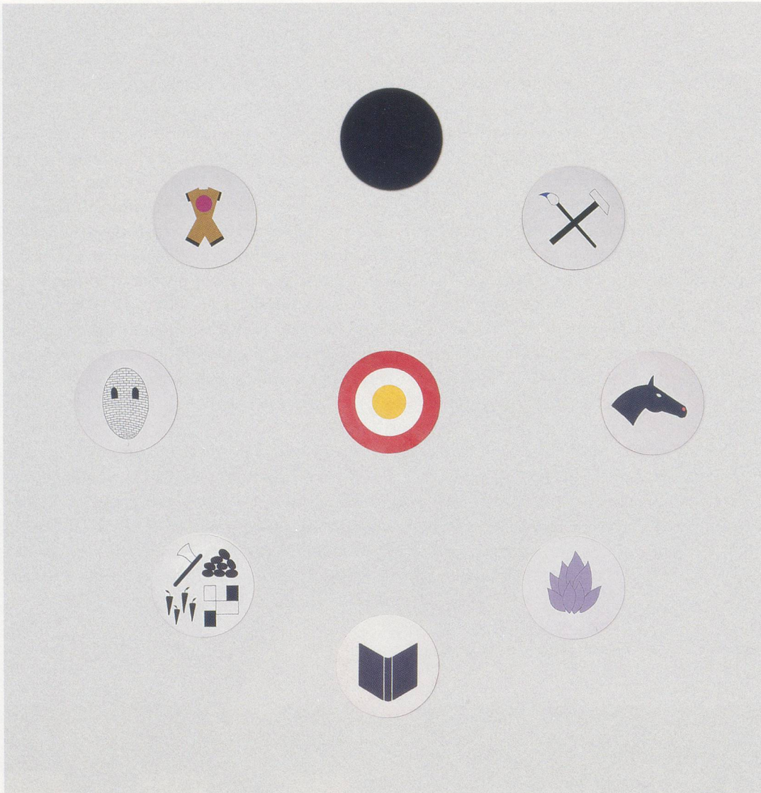
MAI-THU PERRET, PERPETUAL TIME CLOCK, 2004, acrylic on wood, 94 1/2 x 94 1/2" / EWIGE UHR, Acryl auf Holz, 240 x 240 cm.

commune, irrespective of whether the object in question is produced by her own hand or by collaborators or by fabricators according to her instructions. 25 SCULPTURES OF PURE SELF EXPRESSION (2003) is a case in point.