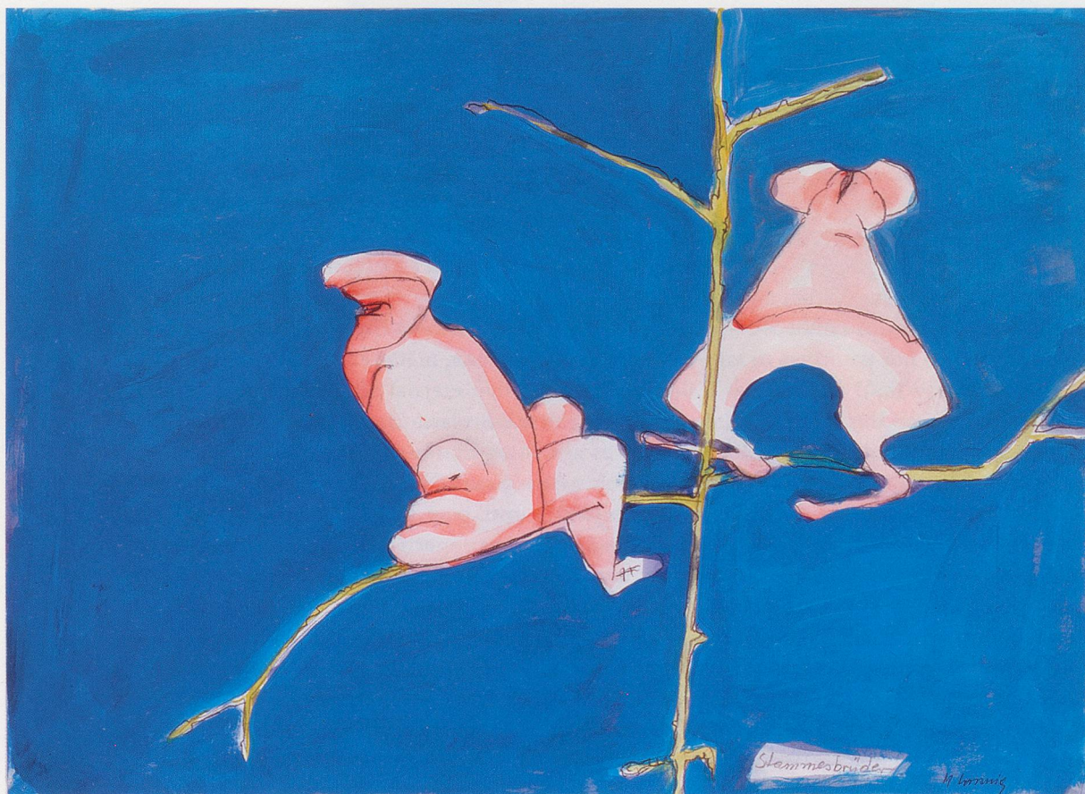
MARIA LASSNIG, BROTHERS FROM THE SAME TRIBE , 2007, pencil, watercolor, acrylic on paper, 20 x 27 1/2" / STAMMESBRÜDER, Bleistift, Aquarell, Acryl auf Papier, 50,8 x 69,9 cm.

sense of humor. Lassnig became a paradox: she was considered important but not loved—a weird lonely artist and woman. The Neue Wilde painters aged in the shadows she cast. Neo Rauch and the color addicts of the New Leipzig School could be her accomplices just as easily as wise old Vito Acconci with his eroticized experience of space. Birthdates are irrelevant in the life of Maria Lassnig. She has never been much use as the spiritual supermom of feminist aesthetics. She eschews gender-specific exhibitions because they discriminate. Whatever she thinks, whatever she does, the world was and is grammatically feminine. In the international encyclopedia of women artists, 1) she is allotted a grand total of seven lines and no illustration—in punishment perhaps? Speedy Maria Lassnig, her fame conditional, is mired in surroundings that envy makes lethargic. Against whom can she measure herself? She has no worthy opponents. Sojourns in Paris, New York, and Berlin do nothing to ease the unease. Not until 1980 does the newly appointed university professor in Vienna begin raking in the honors as a genuinely classical artist. And when art finally puts to rest the silly arguments about figuration and abstraction, there's nothing left to stop the global applause in the new millennium: Maria Lassnig, the quintessential paragon of painting. The institutionalization of the artist does not dampen her delight in painting. There is not the slightest trace of fatigue.