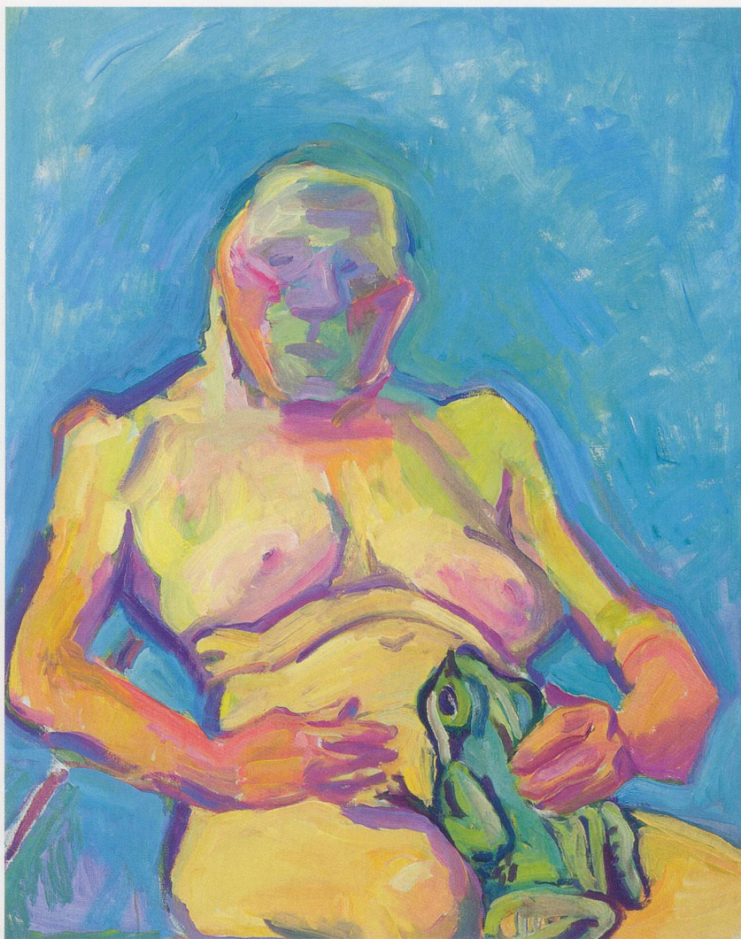
MARIA LASSNIG, FROG QUEEN , 2000, oil on canvas, 49 1/4 x 39 1/4" / FROCHKÖNIGIN , Öl auf Leinwand, 125 x 100 cm.

and, with sufficient study, can be traced in the works themselves. It can be sensed as empathetic introspection although it is not “objectively” legible since each body and its reactions are exclusive and individual. Lassnig works at finding an adequate form for experiences that are hardly quantifiable, like pressing, stretching, or tearing, and she distinguishes colors according to smell, bruising, and burning. The selection is ultimately hers alone—body awareness is purely a matter of faith. Lassnig wants to do only what art can and always has done by definition: to turn the inside out and make it visible. The physiogenic paintings are unassuming, like colored bags of skin with content unknown or temporarily armored shrines experimentally placed in a neutral context. Then the surface bursts. The picture itself becomes body with its idiosyncratic anatomy defined by Lassnig. She is lying down or squatting next to the edge of the picture and sometimes, with her eyes closed, paints everything she senses and knows. She knows every single hair on the body that she lives with and she likes the malleable shell with its various floors, openings, hallways, and ante-chambers. Unlike what the Viennese