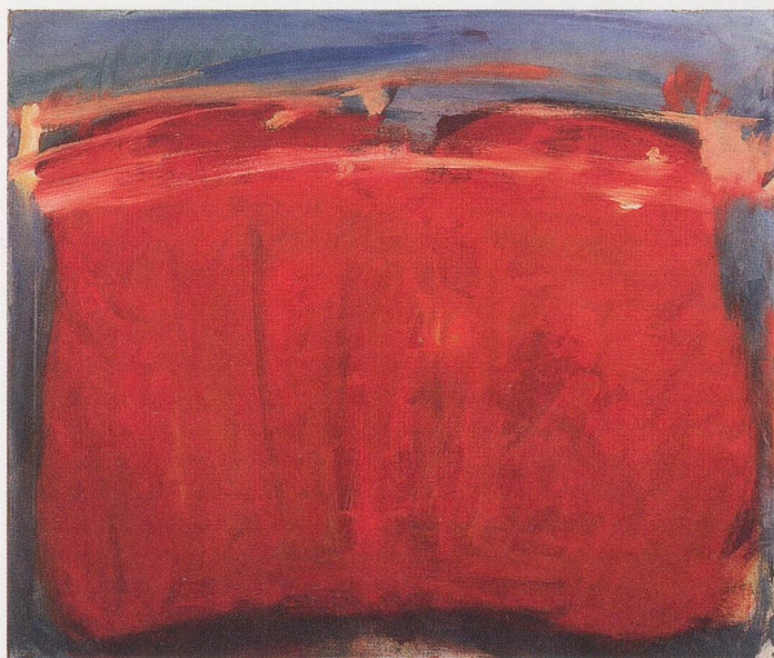
MARIA LASSNIG, SQUARE BODY SENSATION, 1960, oil on canvas, 39 1/4 x 47 1/4" / QUADRATISCHES KÖRPERGEFÜHL, Öl auf Leinwand, 100 x 120 cm. (PRIVATE COLLECTION, KLAGENFURT)

birnst die Fläche. Das Bild wird selbst Körper mit eigenwilliger Anatomie, die Maria Lassnig bestimmt. Sie liegt oder hockt bei der Bildkante und malt manchmal mit geschlossenen Augen alles, was sie spürt und weiss. Bis zum feinsten Härchen kennt sie den Körper, mit dem sie lebt und mag das formbare Gehäuse mit verschiedenen Stockwerken, Öffnungen, Korridoren und Vorzimmern. Im Gegensatz zu den um eine Generation jüngeren Wiener