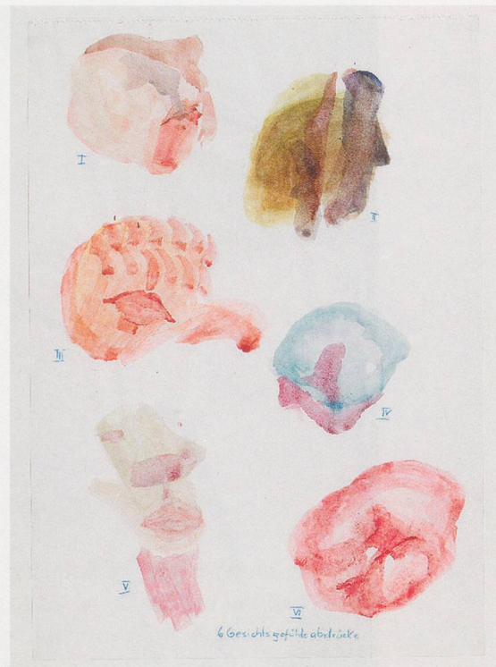
MARIA LASSNIG, 6 FACIAL FEELING IMPRINTS, 1979, watercolor, gouache, crayon on paper, 23 1/4 x 16 1/2" / 6 GESICHTSGEFÜHLSABDRÜCKE, Aquarell, Gouache, Farbstift auf Papier, 59 x 42 cm.

Mit neunundzwanzig stellt Maria Lassnig das erste Mal aus. Die Kritik vermutet lobend eine Verwandtschaft mit Oskar Kokoschka und dem kärntnerischen Kolorismus, die Künstlerin wählt aber eine andere Herausforderung. «Der gerade Weg ist der schnellere als der krumme», notiert sie im Tagebuch und spurt schnurgerade über Nadelkurven. 2) Auf der Suche nach den Surrealisten und deren Quellen in Paris erlebt sie einen explosiven Aufbruch der Ungegenständlichkeit – ein fatales Intermezzo mit Folgen. Sie taucht in den Strom, speit pastose Farbinseln über die Bildfläche, peitscht sie mit diagonal geschossenen Balken oder deckt sie in Farbschichten fast voll(ständig) zu. Im Galopp scheint sich alles zu verändern, auch der Bildinhalt und dessen Begründung. Mit schwerer Last fährt Lassnig über das dünne Kunsteis. In Österreich als Vorkämpferin des Informel bekannt, nabelt sie sich wieder ab und malt schwerfällig farbige, kantige Felsbrocken, unbewegbare Monolithe oder warm fließende, fast unbegrenzte Farbfelder. Mit der Ungegenständlichkeit geht sie recht unzimerlich um. Wie eine Bäuerin beim Kochen mischt sie heterogene Zutaten, lässt den Farbteiquellen und bezeichnet das Ergebnis ziemlich ernüchternd und der optischen Wahrheit entsprechend als «Knödel», «Kipfel» oder auch «Schorf». Nach diesem weichen Zwischenspiel