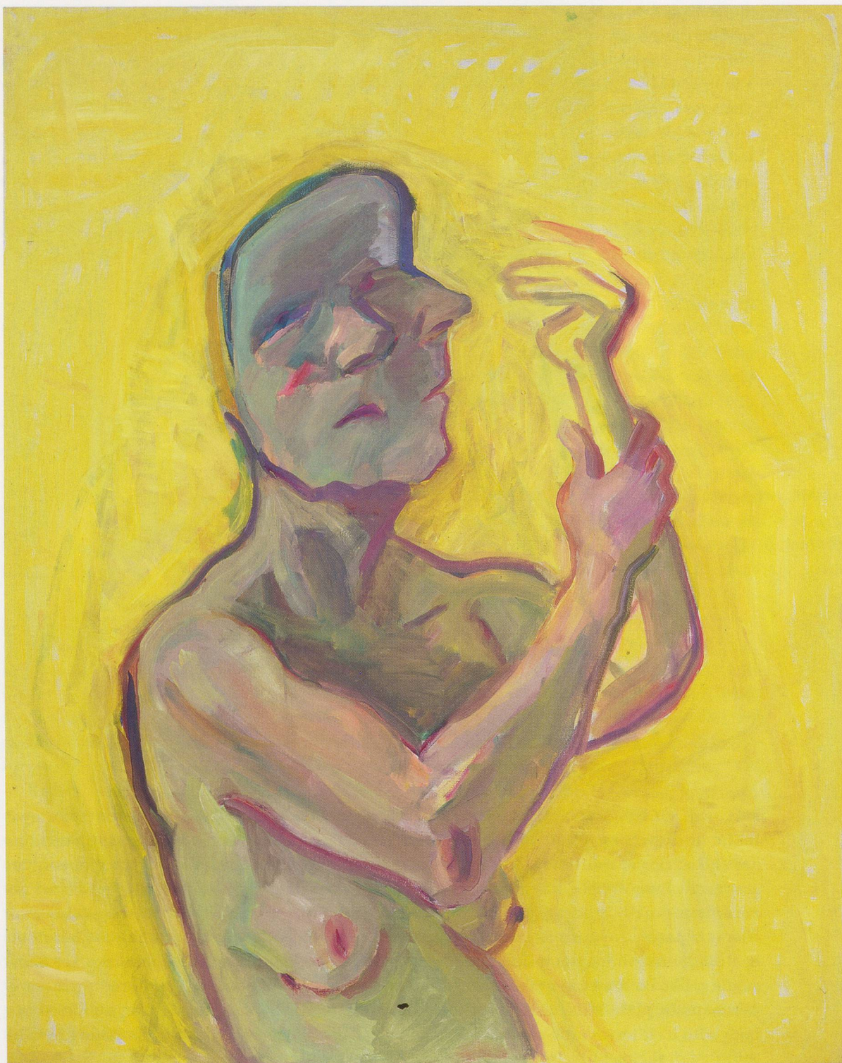
MARIA LASSNIG, THE YELLOW HAND , 2000, oil on canvas, 49 1/4 x 39 1/4" / DIE GELBE HAND , Öl auf Leinwand, 125 x 100 cm.