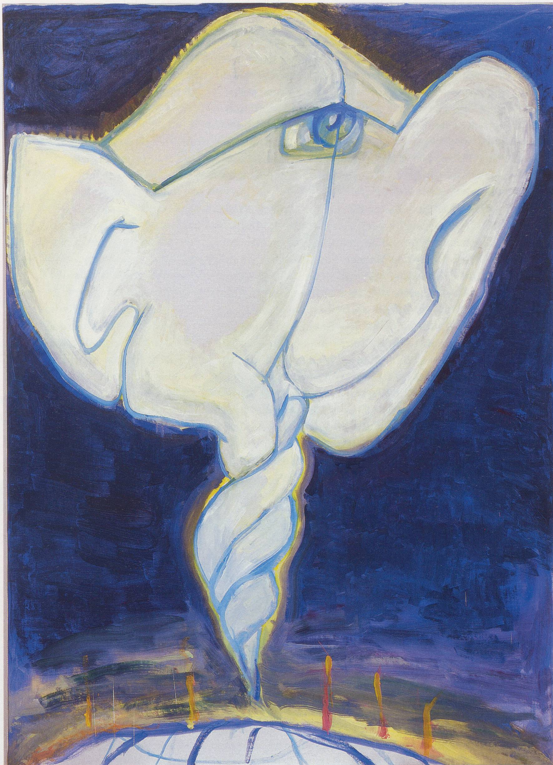
MARIA LASSNIG, THE INNOCENT LOOK, 2008, oil on canvas, 81 1/4 x 59" / DER UNSCHULDIGE BLICK, Öl auf Leinwand, 208 x 150 cm.