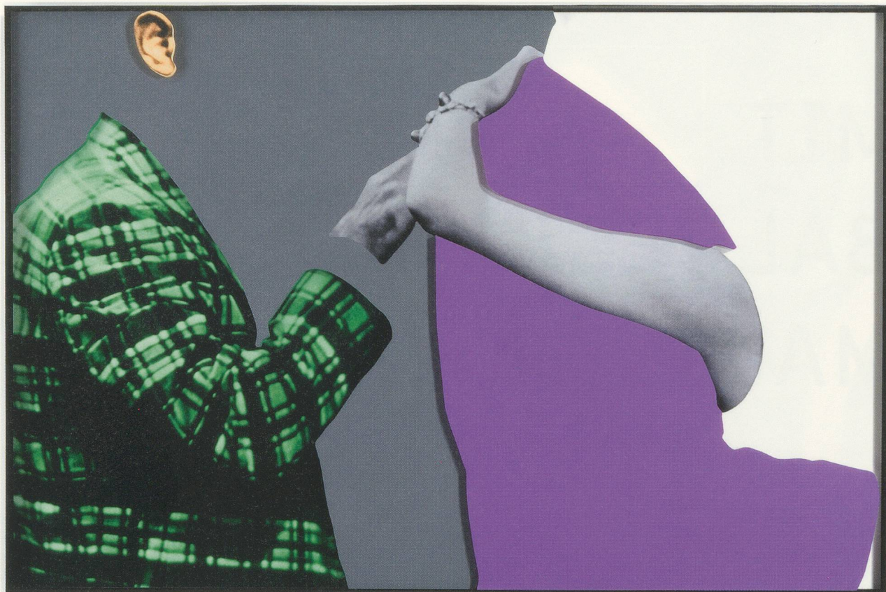
JOHN BALDESSARI, ARMS & LEGS (SPECIF. ELBOWS & KNEES), ETC.: ARM AND PLAID JACKET (GREEN), 2007, three-dimensional archival print, laminated with Lexan, mounted on Sintra, acrylic paint, 59 x 89 1/4" / ARME & BEINE (BES. ELLBOGEN & KNIE), ETC.: ARME UND KARIERTE PLAID-JACKE (GRÜN), dreidimensionaler alterungsbeständiger Print, laminiert mit Lexan, aufgezogen auf Sintra, Acrylfarbe, 149,9 x 226,7 cm.

opening French windows. Here, in the territory of the absurd, we are at home once more. But Baldessari's working method turns out to be more universal than we thought. His work recalls a philosophy that wished art well—although a different sort of art.