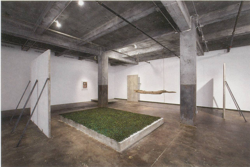
CAROL BOVE, "The Middle Pillar," 2007, exhibition view, Maccarone Gallery, New York, mixed media, including a collage by Bruce Conner, dimensions variable / Der mittlere Pfeiler, Ausstellungsansicht, verschiedene Materialien, mit einer Collage von Bruce Conner, Masse variabel.

geln, Parameter, welche die künstlerische Arbeit leiten, sind die Architektur, die dem Impuls ermöglicht Gestalt anzunehmen. Der Impuls ist das Ursprüngliche, aber ohne die Begrenzung durch Regeln bleibt er ein ungestaltetes Durcheinander. Ich muss dabei an die universalen Prinzipien von Ausdehnung und Verdichtung denken.