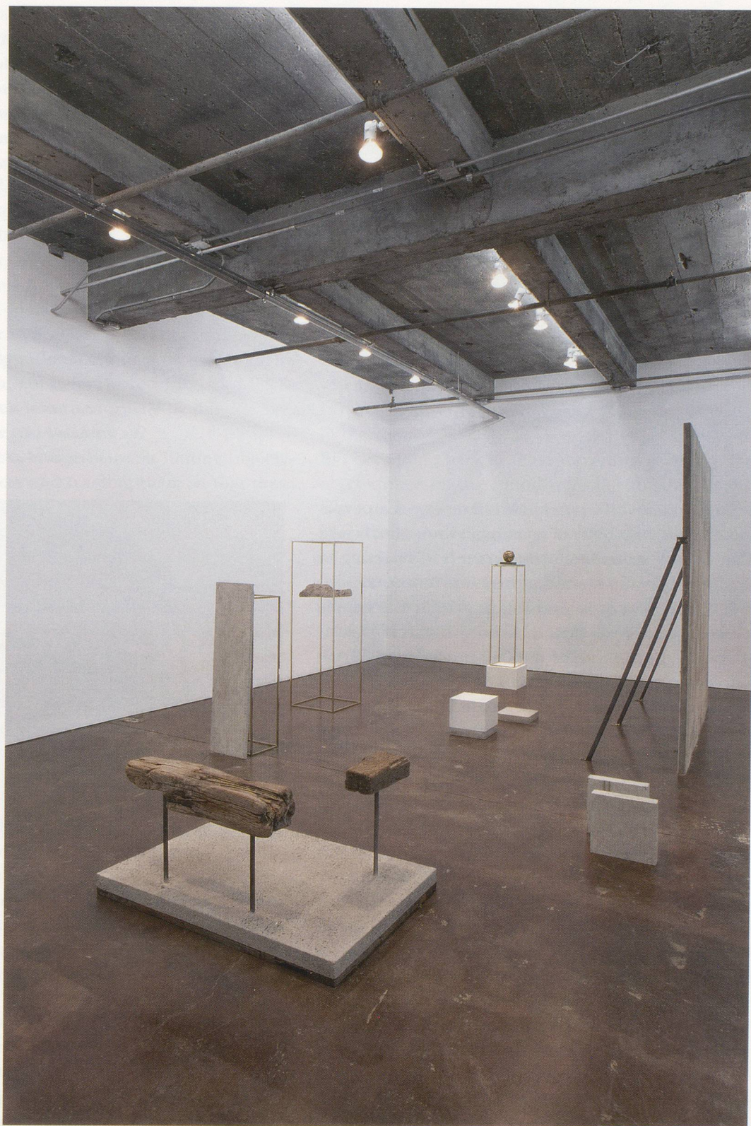
CAROL BOVE, "SETTING" FOR A. POMODORO, 2006-2007, Arnaldo Pomodoro sculpture, concrete, driftwood, wood, steel, bronze, gold, glass, dimensions variable / Skulptur von Arnaldo Pomodoro, Beton, Treibholz, Holz, Stahl, Bronze, Gold, Glas, Masse variabel.