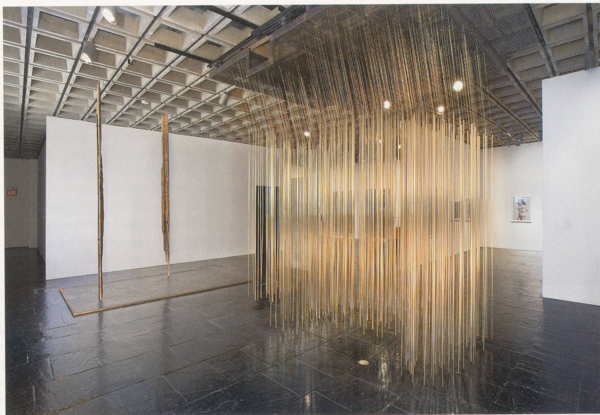
CAROL BOVE, from left to right, FIELD FIGURES , 2008, steel, driftwood, 156 x 132 x 84", THE NIGHT SKY OVER NEW YORK, OCTOBER 21 , 2007, steel, bronze, 168 x 144 x 96", exhibition view Whitney Biennial, 2008 / FELDFIGUREN , Stahl, Treibholz, 396 x 335 x 213 cm / DER NACHTHIMMEL ÜBER NEW YORK, 21. OKTOBER , Stahl, Bronze, 1006 x 851 x 541 cm, Ausstellungsansicht.

und Nägeln und steigt wieder, falls ein Kurator beschliesst, ihn in die Sammlung eines Museums aufzunehmen, das heisst ihm einen Rahmen gibt. Und als Objekt schafft der Nagelfetisch unter seinen Betrachtern und Anwendern eine Differenz, die von deren Wissen oder Unwissen abhängt, beziehungsweise er befriedigt unterschiedliche Arten von Wissen oder Erfahrung. Die Unbeständigkeit der Bedeutung ist, wie du gesagt hast, unermesslich. Können wir noch etwas darüber reden, wie du die Objekte, Materialien und Dinge für deine Arbeit auswählst und findest?