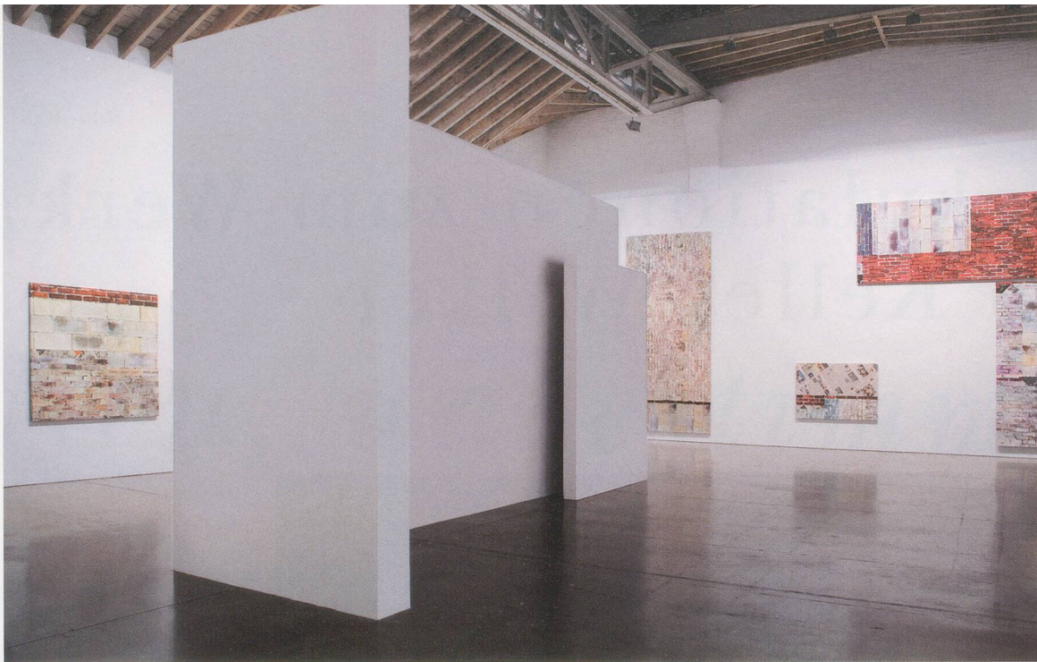
KELLEY WALKER, installation view , Paula Cooper Gallery, New York, 2008 / Installationsansicht.

zerbrechlich, verderblich, sperrig oder ungeeignet für den Transport gewesen wären». 3) Das Recycling-Symbol, das noch populärer wurde als ein anderes Kreissymbol – das CND-Symbol –, sollte auf einen Missstand hinweisen und dessen Korrektur anpreisen: Problem und Lösung in einem einzigen nahtlosen Kreislauf. Der vom Möbiusband inspirierte Entwurf macht effektiv auf die Zerstörung der Umwelt durch bestimmte Produktionsmethoden aufmerksam und stellt zugleich sicher, dass die Produktion unverändert weitergehen kann. Die Bedeutung des Symbols ist zweideutig: Einerseits beruhigt es das Gewissen all jener, die im trauten Heim ihren Müll sortieren; andererseits verbildlicht es das unbeirrbar fortschreitende kapitalistische System, das sogar noch den eigenen Abfall zur Ware macht.