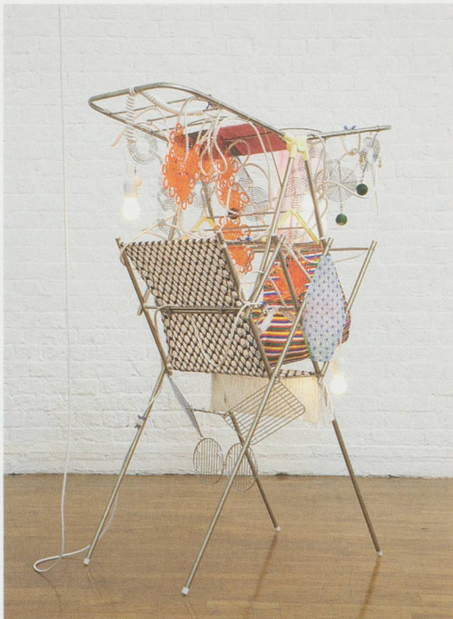
HAEGUE YANG, ANDANTE MODERATO, Semi-Dépliable , 2011, 2 drying racks (white), light bulbs (frosted), cable, fabric (silk, cotton, polyester, Keffiyeh, Kimono fabric, Saekdong fabric), Eundan candy bottle, fan grills, Pickett templates, metal rings, metal chains, ping pong balls, safety pins (gold), 57 1/2 x 39 3/8 x 22 1/2" / 2 Wäscheständer (weiss), Glühbirnen (mattiert), Kabel, Textilien (Seide, Baumwolle, Polyester, Keffiyeh, Kimono-Stoff, Saekdong-Stoff), Eundan Bonbonflasche, Lüftungsgitter, Schablonen, Metallringe, Metallketten, Pingpongbälle, Sicherheitsnadeln (golden), 146 x 100 x 57 cm.

Haegue Yang is good with titles. They can be alternately poetic, comic, melancholy, and even perverse. Take the title of her ambitious solo exhibition at Kunsthau Bregenz earlier this year: "Arrivals." Occupying all three gallery floors of this institution on the edge of Lake Constance, the exhibition could be interpreted as a statement that she has indeed "arrived." Not that this semantic implication would have escaped Yang, which is why she chose to make the word plural. 1) Yang, it would seem, was not only