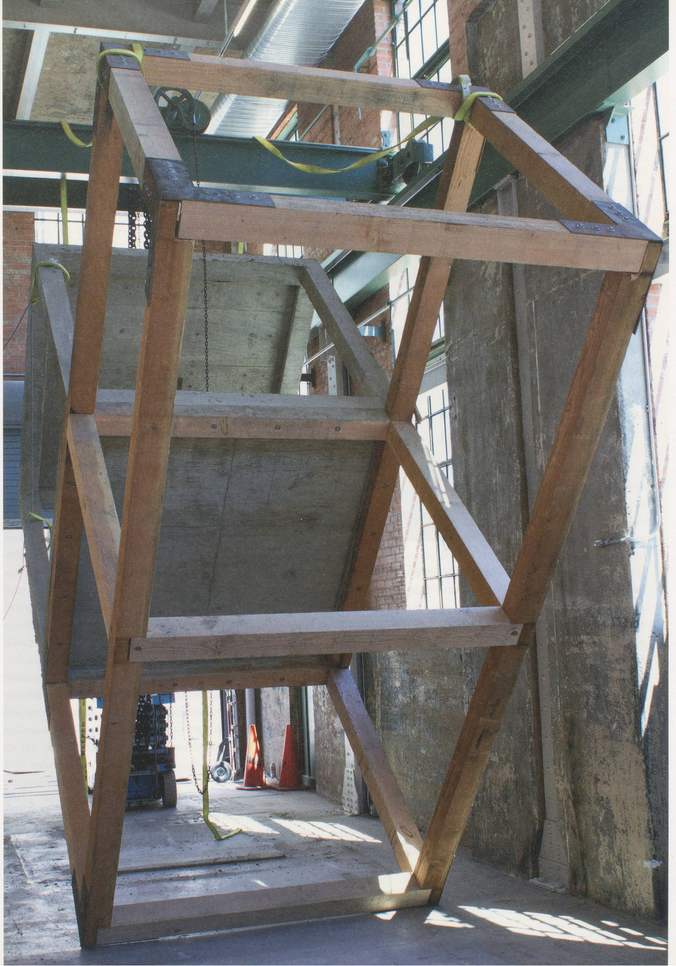
OSCAR TUAZON, DIE, 2011, production still, Power Station, Dallas / STIRB, Produktionsbild.