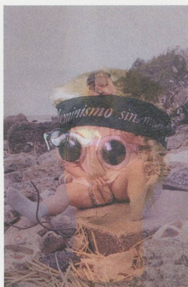
K8 HARDY, PINK DIPTYCH, Position Series, 2011, photographic prints, 20 5/8 x 31 1/8 x 1 1/2" each / ROSA DIPTYCHON, Prints, je 53 x 79 x 4 cm.