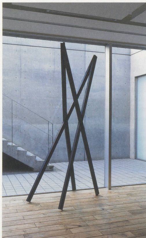
OSCAR TUAZON, A DEAD THING, exhibition view "Sex Booze Weed Speed," Rat Hole Gallery, Tokyo, 2010 / EIN TOTES DING, Ausstellungsansicht.

* Working Artists and the Greater Economy (W.A.G.E.) ist eine 2008 gegründete Aktivistin- und Bewusstseins-Gruppierung in New York.