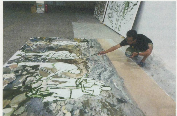
Liu Xiaodong, Hotan Project, 2012, Xinjiang.

HOU HANRU ist Kritiker und Ausstellungsmacher, er lebt und arbeitet in San Francisco und Paris. Er ist der Kurator der 5. Auckland Triennale (Eröffnung im Mai 2013).