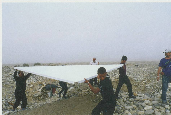
Liu Xiaodong, Hotan Project, 2012, Xinjiang.

community and society in general gained a great deal of freedom of expression. For the first time, an avant-garde movement came to the fore in China's cultural landscape.