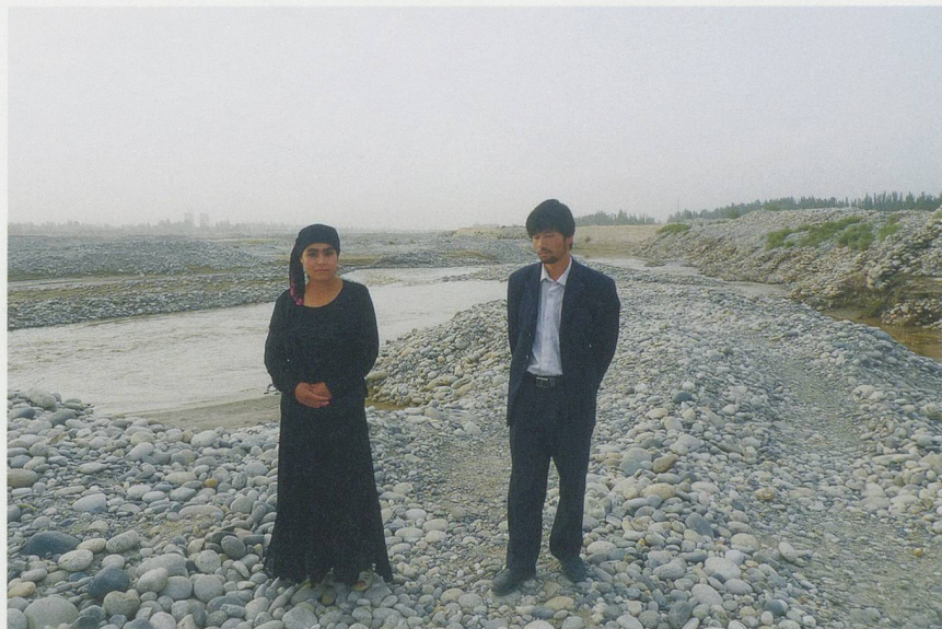
Liu Xiaodong, Hotan Project, 2012, Xinjiang.