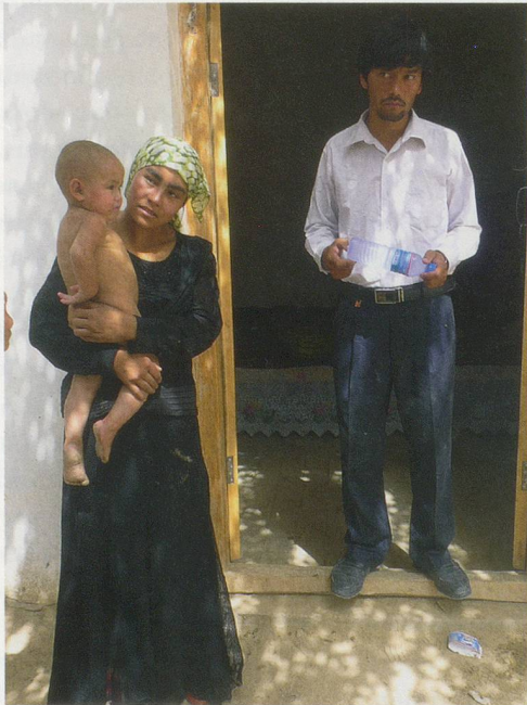
Liu Xiaodong, Hotan Project , 2012, Xinjiang.

Liu’s attitude and process—the strategy of proximity—are an attempt to eliminate the boundary between the self and the other. This results in paintings that are intense, vivid, and powerful—like the exhalation that occurs right before the arrival of a sandstorm.