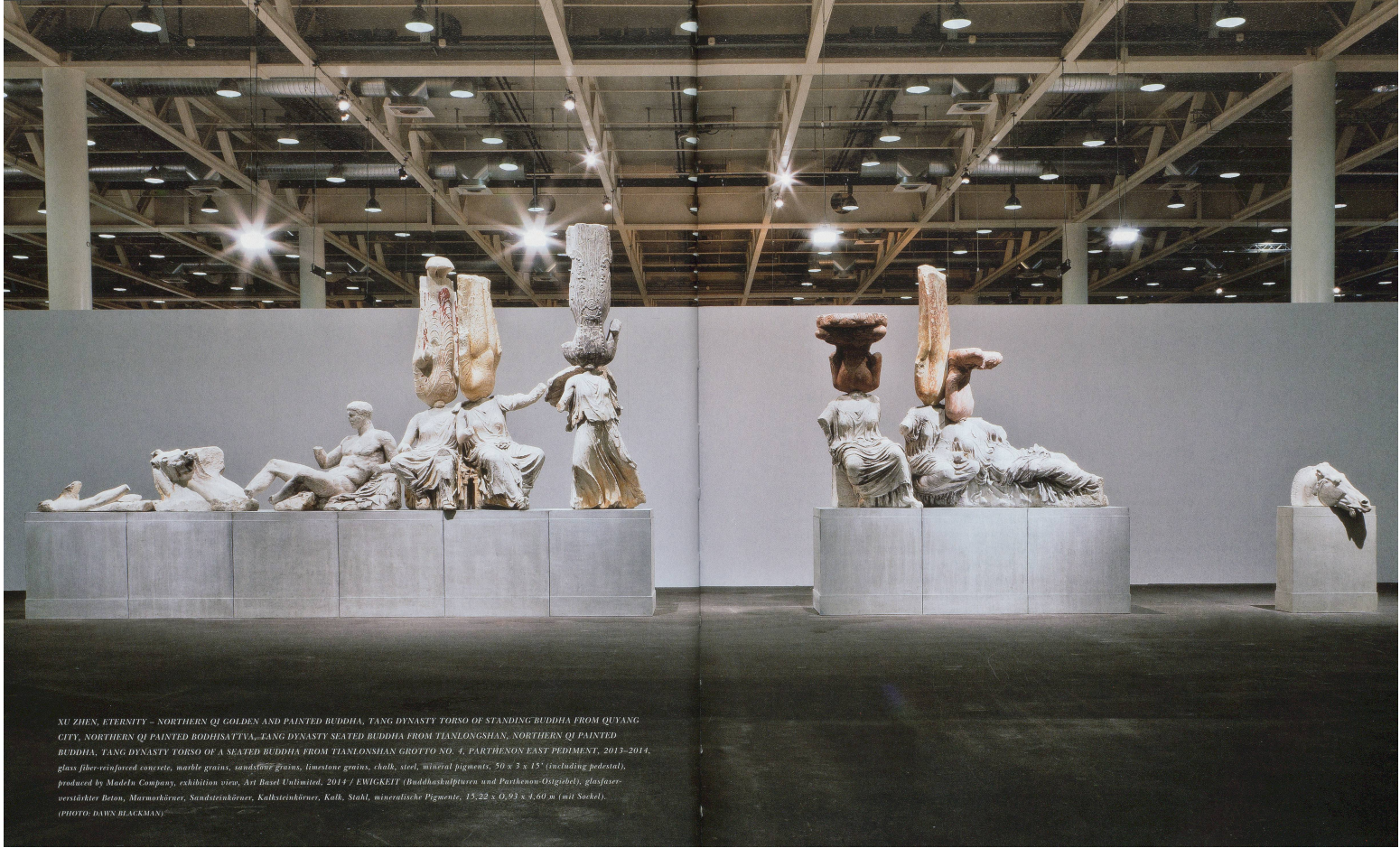
XU ZHEN, ETERNITY – NORTHERN QI GOLDEN AND PAINTED BUDDHA, TANG DYNASTY TORSO OF STANDING BUDDHA FROM QIYANG CITY, NORTHERN QI PAINTED BODHISATTVA, LANG DYNASTY SEATED BUDDHA FROM TIANLONGSHAN, NORTHERN QI PAINTED BUDDHA, YANG DYNASTY TORSO OF A SEATED BUDDHA FROM TIANLONGSHAN GROTTO NO. 4, PARTHENON EAST PEDIMENT, 2013–2014, glass fiber-reinforced concrete, marble grains, sandstone grains, limestone genius, chalk, steel, mineral pigments, 50 x 3 x 15' (including pedestal), produced by MadeIn Company, exhibition view, Ari Basel Unlimited, 2014 / EWIGKEIT (Buddhaskulpturen und Parthenon-Ostgiebel), glasfaser-verstärkter Beton, Marmorkörner, Sandsteinkörner, Kalksteinkörner, Kalk, Stahl, mineralische Pigmente, 15,22 x 0,93 x 4,60 m (mit Sockel).