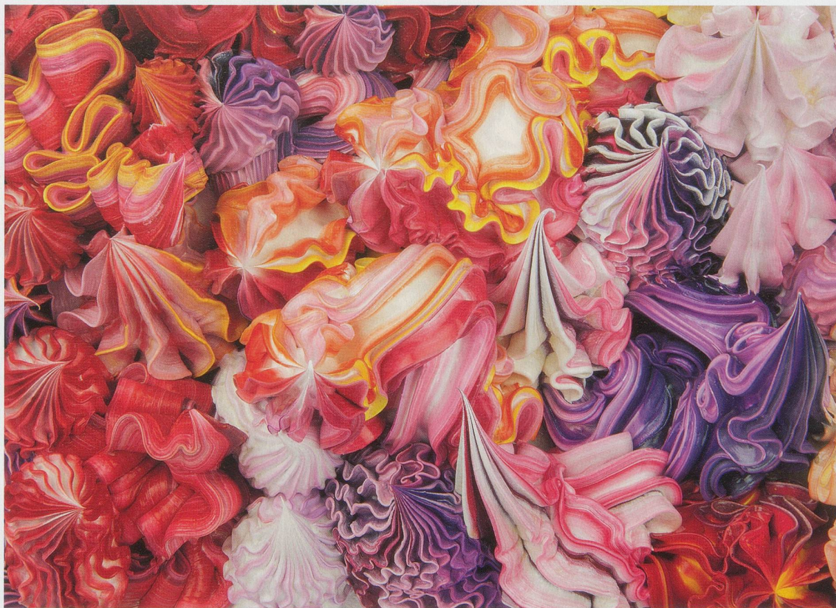
XU ZHEN, UNDER HEAVEN-3208NH1409, 2014, oil on canvas, aluminum, 55 \frac{1}{8} \times 37 \frac{3}{8} \times 5 \frac{3}{8} ," produced by MadeIn Company / UNTER DEM HIMMEL-3208NH1409, Öl auf Leinwand, Aluminium, 140 x 95 x 13,5 cm.

XZ: Ich glaube, dass die Bedeutung von Koons noch immer nicht voll erkannt wird. In unserer pragmatischen Kunstwelt steht er für mich seit Langem an der Spitze. Andere finden ihn kommerziell und ihr Verständnis geht nicht über diese Ebene hinaus. Es lohnt sich, über das, was du eben gesagt hast, nachzudenken, aber nicht alle sind dazu bereit. Ich finde vieles, was Koons macht, philosophisch. Wenn du etwas derart aufpolierst, dass es weit über das erforderliche Mass hinausgeht, ist das nicht mehr eine Frage des Geschäfts, sondern eine Frage der Ontologie. Ich habe vergangenes Jahr seine Retrospektive in New Yorker Whitney Museum gesehen. Eine phantastische Ausstellung! Das Whitney sah ein bisschen traurig aus, innen so grau, aber das hat die Logik der