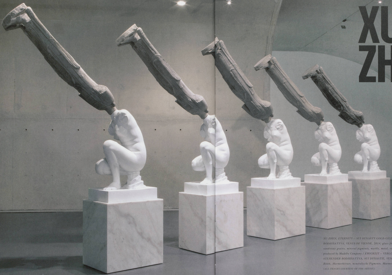
XU ZHEN, ETERNITY – SUI DYNASTY GOLD GILDED AND PAINTED STANDING BODHISATVA, VENUS DE VIENNE, 2014, glass fiber reinforced concrete, marble grains, sandstone grains, mineral pigments, marble, metal, each 43 1/2 x 33 1/2 x 140 1/2", produced by Madeln Company / EWIGKEIT – VERGOLDETER UND BEMALTER STEHENDER BODHISATVA, SUI DYNASTIE, VENUS DE VIENNE, glasfaserverstärkter Beton, Marmorkörner, mineralische Pigmente, Marmor, Metall, je 110 x 85 x 357 cm.