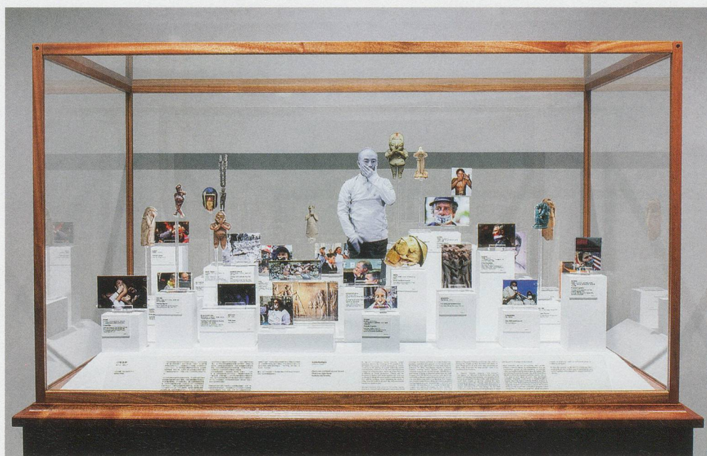
XU ZHEN, PHYSIQUE OF CONSCIOUSNESS MUSEUM – EPISTOMIA , 2014, Sapele wood, C-print, acrylic glass, glass, 67 x 39 1/2 x 67", produced by MadeIn Company / PHYSIK DES BEWUSSTSEINSMUSEUMS – EPISTOMIA , Sapelli-Holz, C-Print, Acrylglas, Glas, 170 x 100 x 170 cm.

XZ: Yes, and this page will definitely be turned. The generation of Huang Yong Ping, which came of age