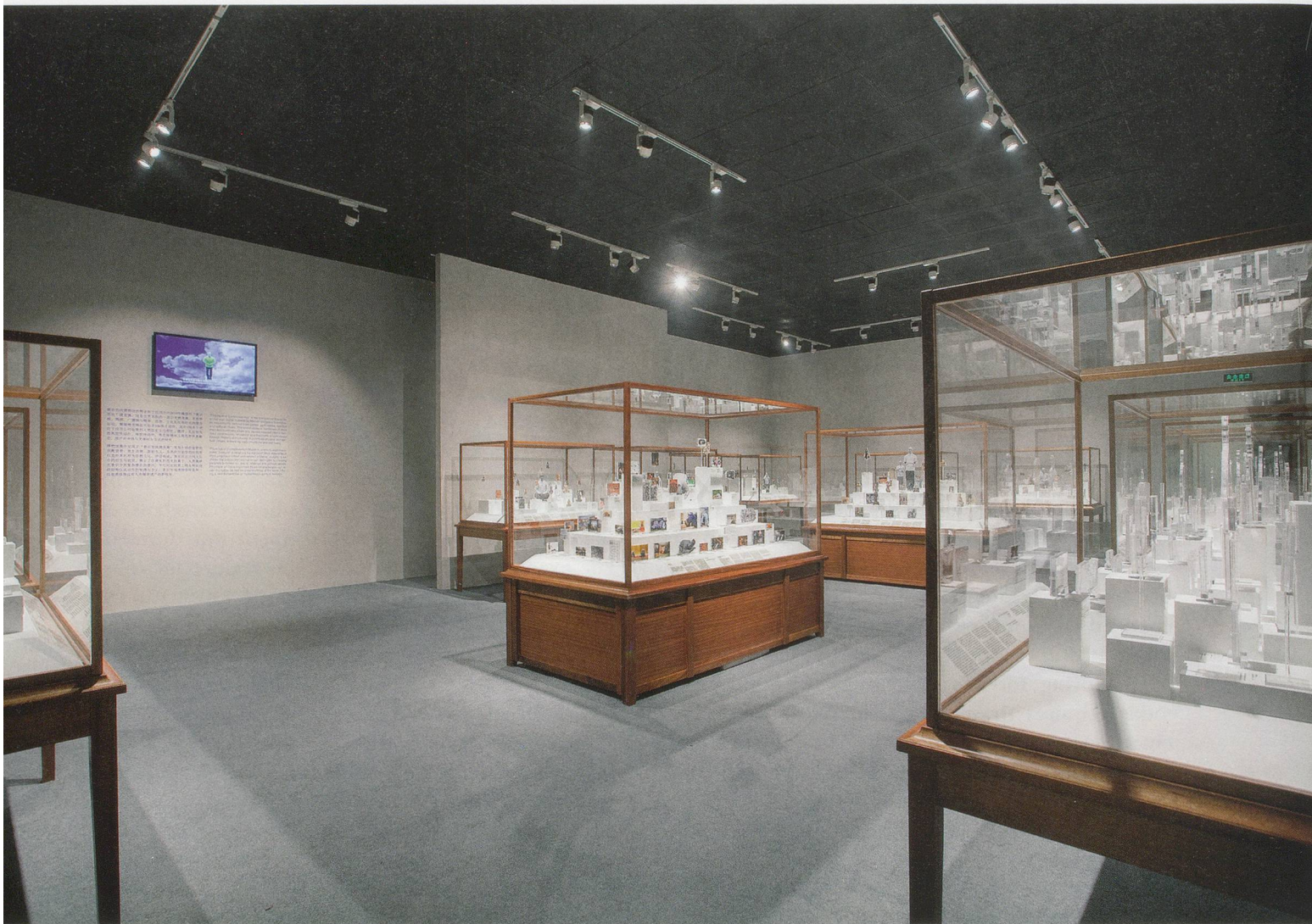
XU ZHEN, PHYSIQUE OF CONSCIOUSNESS MUSEUM , 2014, Sapele wood, C-print, acrylic glass, glass, dimensions variable, produced by MadeIn Company, exhibition view, "Xu Zhen – A MadeIn Company Production," Ullens Center for Contemporary Art, Beijing, 2014 / MUSEUM DER KONSTITUTION DES BEWUSSTSEINS , Sapelli-Holz, C-Print, Acrylglas, Glas, Masse variabel, Ausstellungsansicht.

but it will not go out of fashion. And you will find that many of our works are moving in this same direction—contemporary creation, but hopefully of the sort that will not be filtered out by history, that can remain. Last year, I had a conversation with art historian Lu Mingjun about this shift from making particular works of art to something more akin to articulating a cultural sensibility.