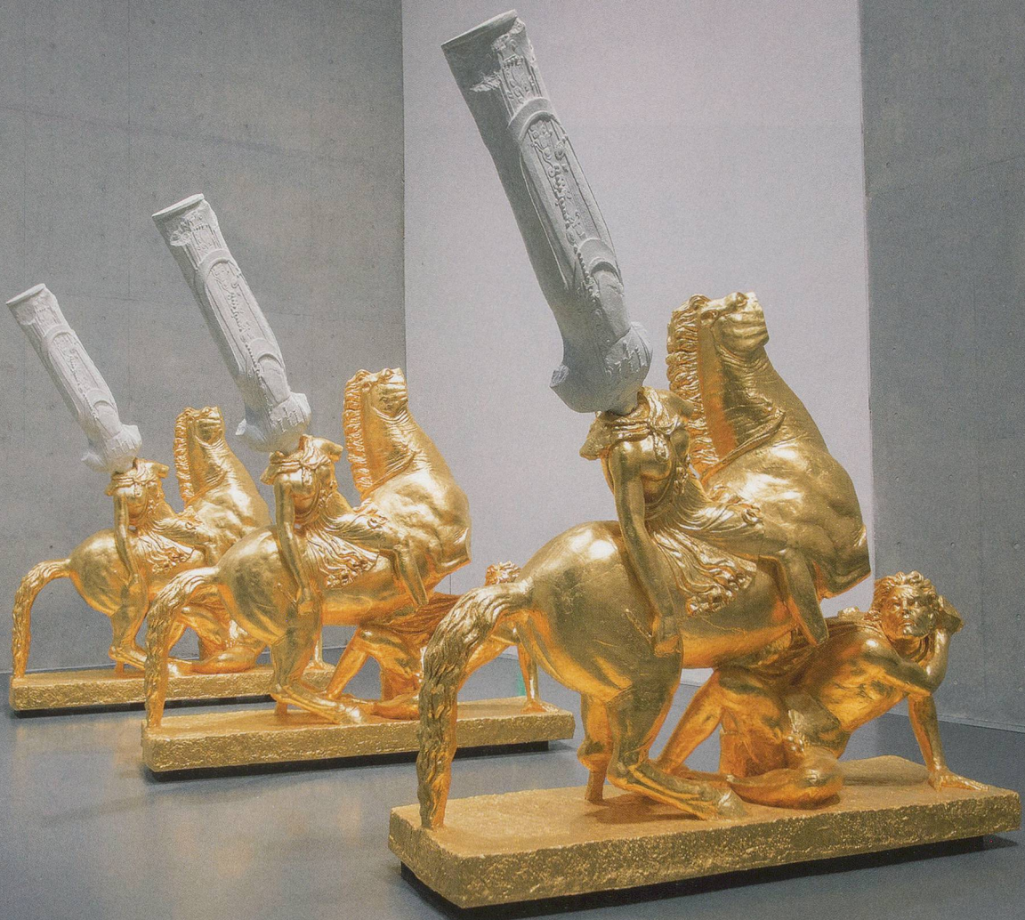
XU ZHEN, ETERNITY – NORTHERN QI STANDING BUDDHA, AMAZON AND BARBARIAN , 2014, glass fiber reinforced concrete, marble grains, metal, gold foil, each 119 \frac{3}{4} \times 39 \frac{3}{8} \times 133 \frac{3}{4} ”, produced by MadeIn Company, exhibition view, Long Museum, Shanghai, 2014 / EWIGKEIT – STEHENDER BUDDHA, NÖRDLICHE QI, AMAZONE UND BARBAR , glasfaserverstärkter Beton, Marmorkörner, Metall, Goldfolie, je 304 \times 100 \times 340 cm, Ausstellungsansicht.

lutely. Whereas with Koons, those who like the work, love it; and those who dislike it, hate it. So I consider him and Polke two different cultural forms.