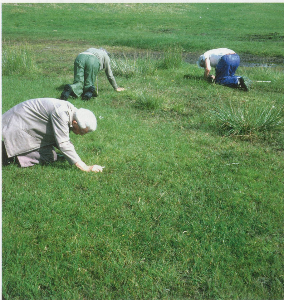
ANDREA BÜTTNER, STEREO-SCOPIC SLIDE SHOW FROM THE WHITEHOUSE COLLECTION (MOSES AND FIELD TRIPS), 2014, detail, stereoscopic slides by Harold and Patricia Whitehouse transferred to digital / STEREOSKOPISCHE DIASHOW AUS DER WHITEHOUSE-SAMMLUNG (MOOSE UND EXKURSIONEN), Detail, digitalisierte stereoskopische Dias.