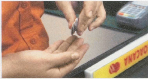
ANDREA BÜTTNER, MINERVA, 2011, video loop, 5 min, 39 sec. / Videoloop.