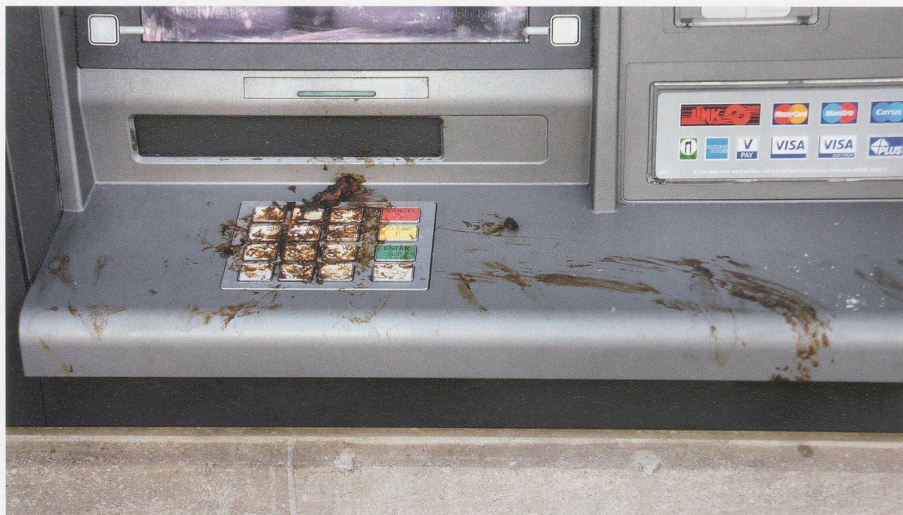
ANDREA BÜTTNER, ATM , 2011, digital pigment print, 15 \frac{3}{4} \times 23 \frac{3}{8} " / Digitaler Pigmentdruck, 40 x 60 cm.

of, the desiring, identifying, paralleling, and warping that is common to both Sedgwick's "beside" and the nun's "littleness." In one of her best-known pieces, LITTLE WORKS (2009), Büttner practiced an alongsideness, beside, or dehierarchization of artist and subject when she handed her video camera to an order of Carmelite nuns living in London and asked them to document their craft projects, such as lavender sachets and sugar-stiffened baskets. The resulting eleven-minute video shows intimate encounters between the nuns, unmediated by the artist's presence, as they display their drawings, crochet, and candles made from recycled bits of wax.