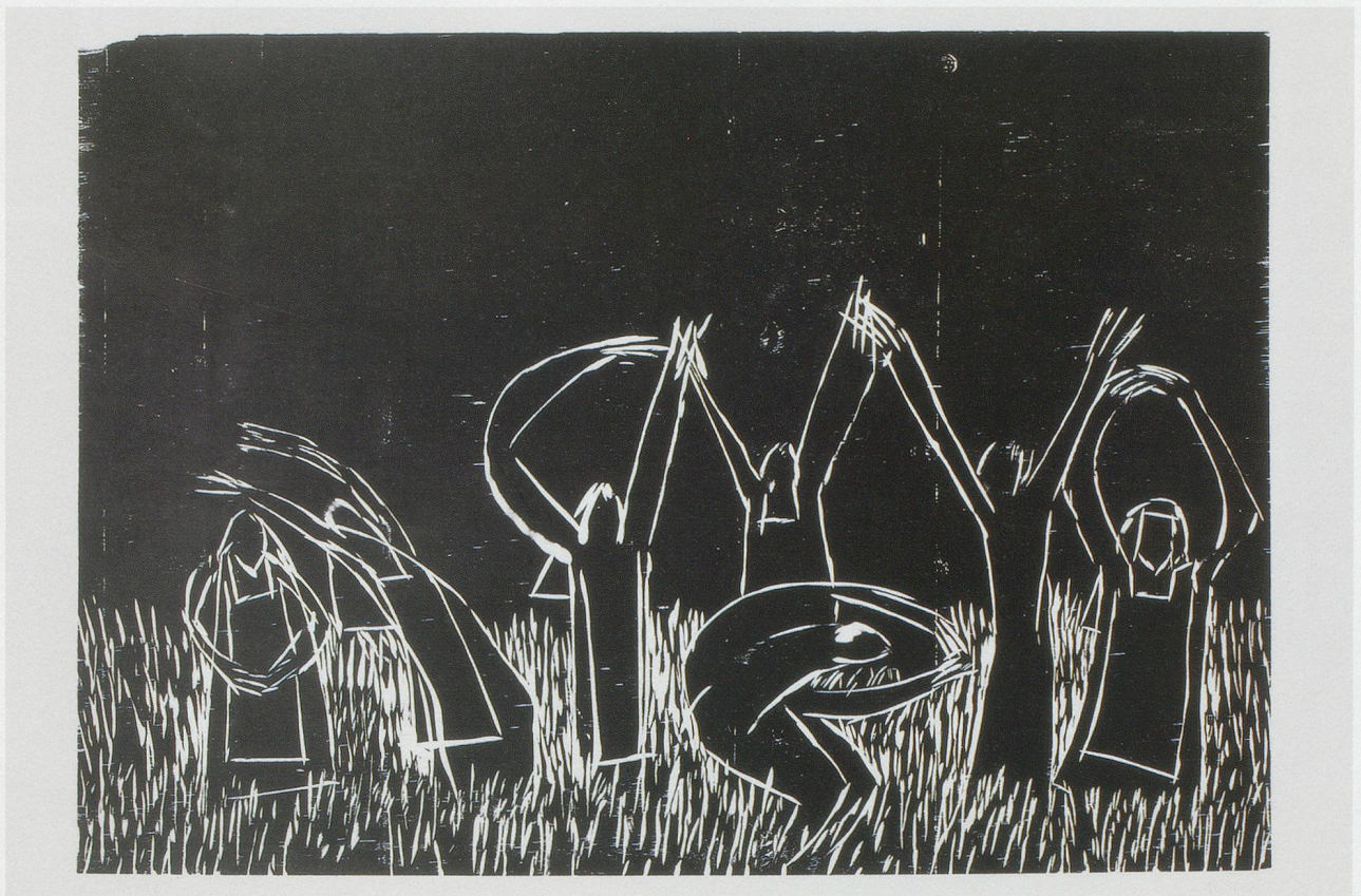
ANDREA BÜTTNER, DANCING NUNS , 2007,