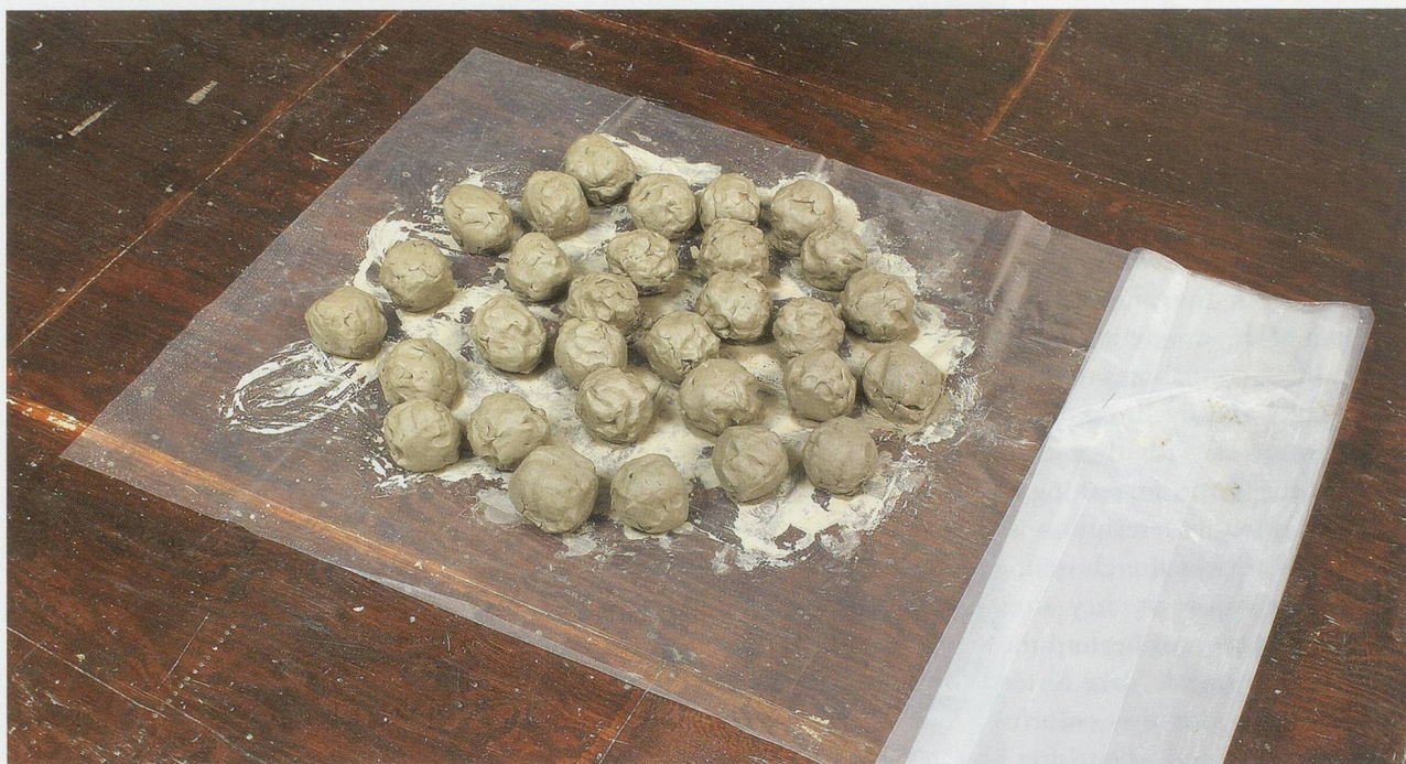
ANDREA BÜTTNER, ANCESTOR DUMPLINGS , 2009, unfired clay, water, plastic, dimensions variable, detail / AHNENKNÖDEL, ungebrannter Ton, Wasser, Kunststoff, Masse variabel, Detail.

Throughout her practice, the artist probes “tricky” thresholds not often explicitly explored in contemporary art—the blurry line between amateur making and fine art production, for instance, or the unexpected relationship between marginal religious experiences and philosophies of modernist contemplation. Her interest in inverting or dissolving boundaries—that is, queering them—is felt most palpably when she drags the abject into the art space, as when she displayed her work against a messy backdrop of brown paint (whose brushstrokes did not quite reach the top of the walls because she painted only as far as she could reach) to create a “shit space” that bismirches the pristine expectations of the white cube. In her photograph ATM (2011), the keypad of a cash machine is smeared with what looks like fecal matter—a reference perhaps, as Lars Bang Larsen has noted, to Freud’s analysis of dreams, where excrement symbolizes money. 5) The analogy also appeared in Büttner’s 2011 exhibition “Our Colours Are the