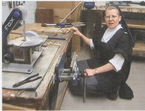
ANDREA BÜTTNER, LITTLE WORKS, 2007, video, 10 min., 42 sec. / KLEINE WERKE, Video.