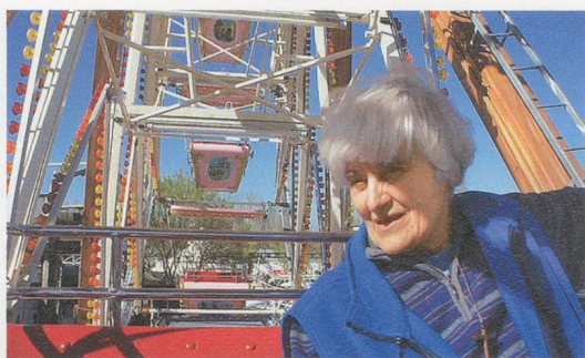
ANDREA BÜTTNER, LITTLE SISTERS: LUNAPARK OSTIA, 2012, HD video, 42 min. / KLEINE SCHWESTERN: LUNAPARK OSTIA, HD-Video.