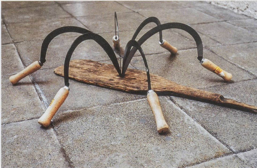
ABRAHAM CRUZVILLEGAS, LA MODERNA (The Modern) , 2003, 6 sickles made of stainless steel, wood, wooden oar, paper, 8 3 / 4 x 35 1 / 2 x 32" / DIE MODERNE , 6 Sicheln aus rostfreiem Stahl, Holz, Holzruder, Papier, 22,2 x 90,2 x 81,3 cm.

bers from around the fifth century BC for about 200 years) to establish civilizations there. How does he substantiate this declaration, you wonder? Much of it is via linguistic comparisons. First of all, there are the similar-sounding names of Maek and Mexica, which is how the rulers of the Aztec empire referred to themselves when they came into contact with the Spanish conquistadors. He has many other examples: The name of Mexica's language, Nahuatl, is derived from Korean Na wa tadl (I and everyone); Aztlan, the mythical homeland of the Aztec people, is in fact Asadal, the capital of Gojoseon; the Nahuatl word for mountain, tepec , comes from Taebaek, the tallest mountain located on the border between China and North Korea, which is often referred to as the spiritual home of the Korean people. He also found numerous cultural similarities, such as traditional cos-