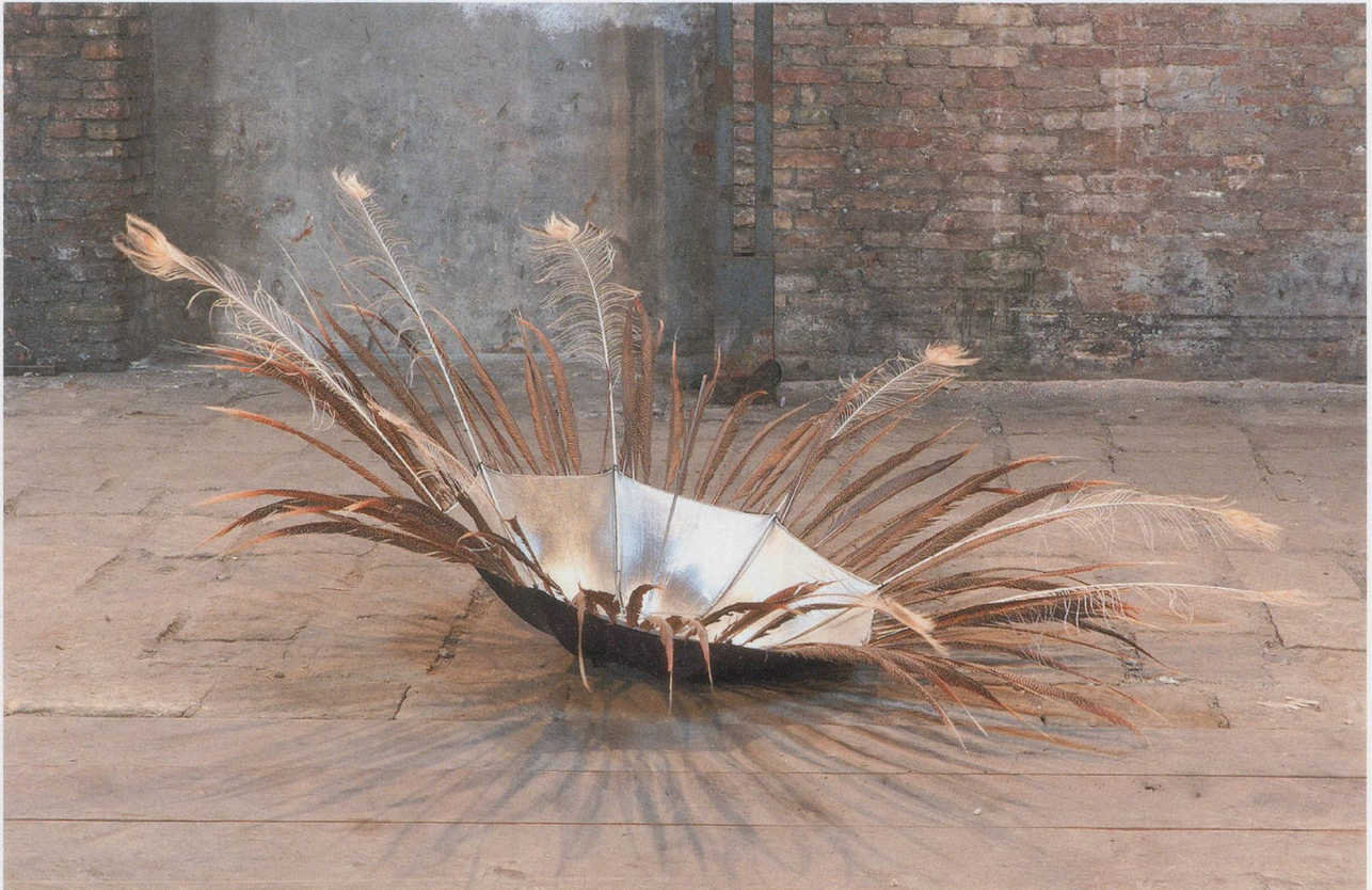
ABRAHAM CRUZVILLEGAS, LA POLAR (North Star) , 2002, photo umbrella, peacock and pheasant feathers, variable dimensions / POLARSTERN, Fotoschirm, Pfauen- und Fasanenfedern, Masse variabel.

Unsicherheit dieser Menschen und Dinge, die es irgendwie immer wieder schaffen, in einem ausgeglichenen Miteinander oder einer lang anhaltenden Schwebelage zu existieren und eben nicht in einer starren Hierarchie. Die modernen Bürger dieser Länder unterwerfen sich, ohnmächtig und doch bereitwillig, autochthonen (autokonstruktiven?) Kräften. Sie verkehren mit den dunklen, aber befreienden Mächten, indem sie Schamanen beschäftigen, die in ihrem Namen in eine «göttliche Krankheit» verfallen, bei der die erwählten Medien in fremden Zungen reden, das Geschlecht wechseln können und sogar zeitliche und kulturelle Abgründe überspringen.