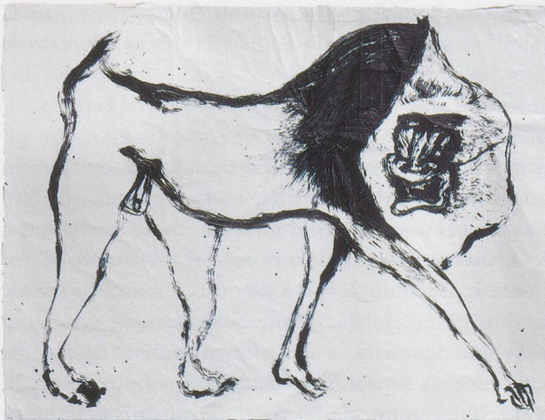
ABRAHAM CRUZVILLEGAS, NUESTRA IMAGEN ACTUAL: ROLLO (Our Real Image: Rollo), 2012, vinyl paint, ink on water based acrylic, enamel on kraft paper, 18 1/8 x 15 7/8" / UNSER WIRKLICHES BILD: ROLLO, Vinylfarbe, Tinte auf wasserbasierter Acrylfarbe, Email auf Packpapier, 300 x 400 cm.

I thought of this again recently, when you wrote to me that—as you have said previously in other contexts—you feel that every object of yours is “alive, has opinions, will, and attitude, with which it participates in a dialogue with other objects, things, events, persons, animals, and so on.” 2) This immediately made me recall some of my favorite objects by you, which date from 2002 and 2003: LA POLAR (North Star), an upturned photo umbrella sprouting peacock and pheasant feathers from its rim; LA MODERNA (The Modern), six sickles whose sharp ends converge on