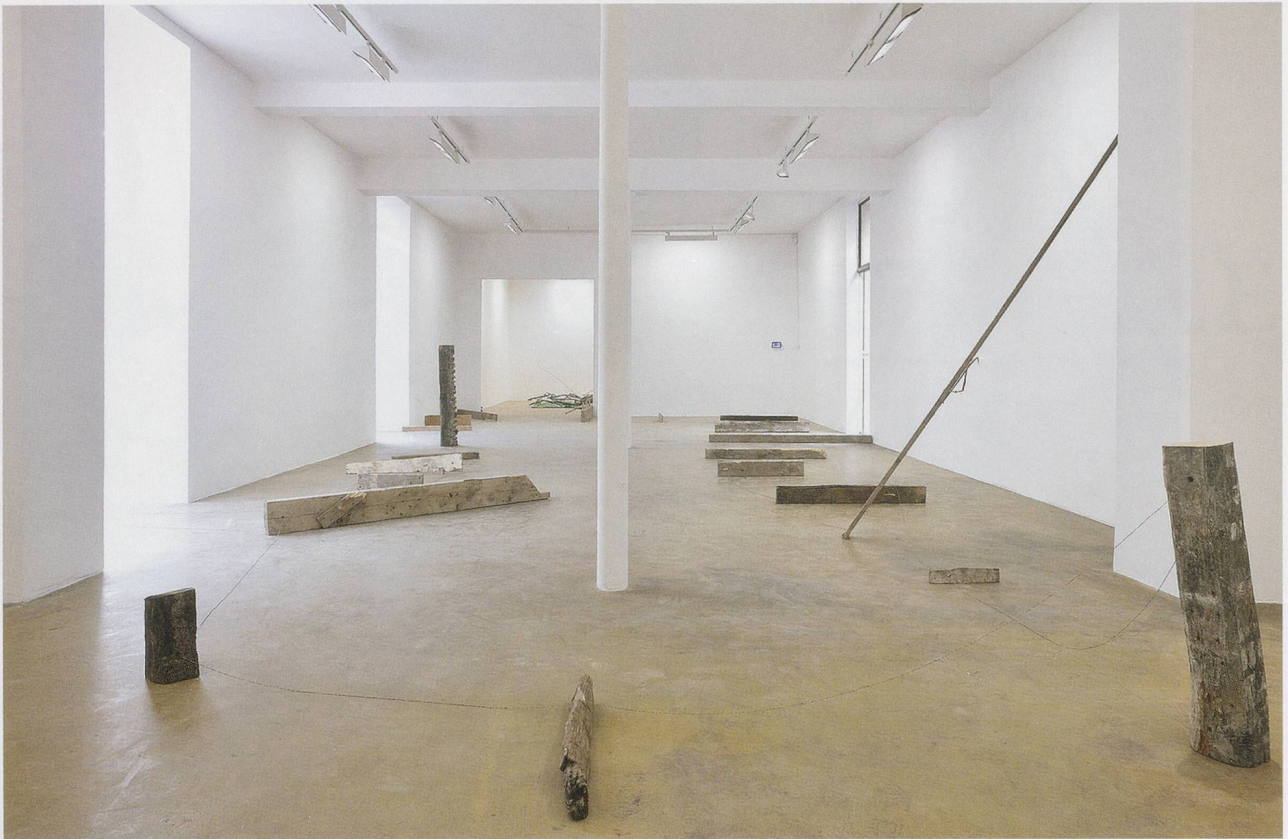
ABRAHAM CRUZVILLEGAS, AUTODESTRUCCIÓN 3: UNE CARTE POUR AVANT ET APRÈS LE VOYAGE D'ANTONIN ARTAUD À LA TERRE ROUGE (Self-Destruction 3: A Map for Before and After Antonin Artaud's Voyage to the Red Earth), 2013, wood, jewelry thread, glass beads, stainless steel, peyote, variable dimensions / SELBSTZERSTÖRUNG 3: EINE KARTE FÜR VOR UND NACH DER REISE ANTONIN ARTAUDS ZUR ROTEN ERDE , Holz, Schmuckgarn, Glasperlen, rostfreier Stahl, Peyote, Masse variabel.

jiang, dem Gebiet also, das früher als Mandchurei bekannt war. Zusammen mit einigen anderen protokoreanischen Volksgruppen sollen die Maek den halbmythischen Staat Gojoseon (2333–108 v. Chr.) und auch die grossen und mächtigen Königreiche Buyeo (2. Jh. v. Chr.–494 n. Chr.) und Goguryeo (37 v. Chr.–668 n. Chr.) gegründet haben. Das Hoheitsgebiet Goguryeos reichte bis weit hinauf in die Mandchurei und tief hinab auf die koreanische Halbinsel, wo es andere Königreiche in den äussersten Süden verdrängte. Doch in den unerwarteten Wirren der Geschichte wurde Goguryeo von seinem