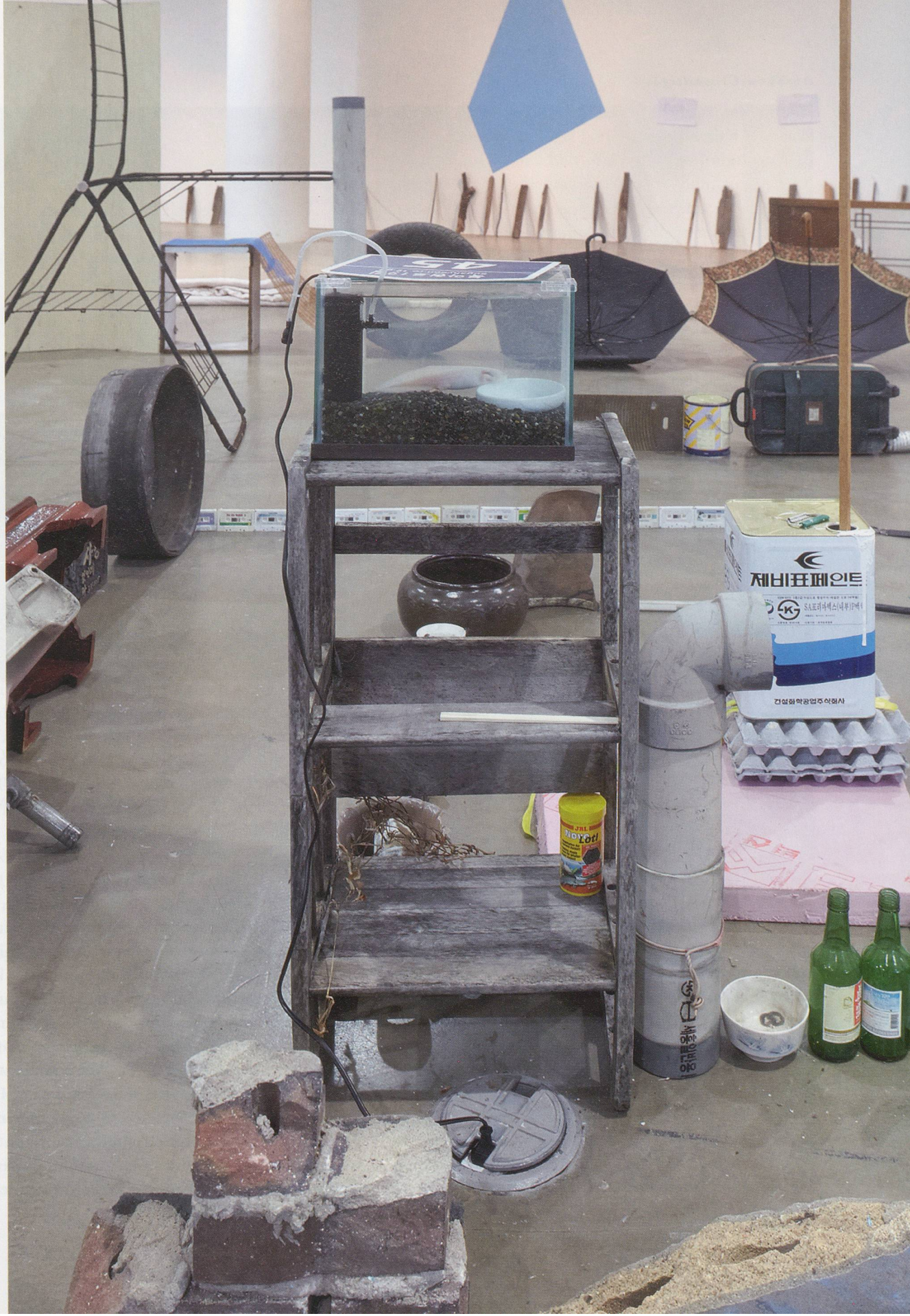
ABRAHAM CRUZVILLEGAS, AUTODESTRUCCIÓN 8: SINBYEONG (Self-Destruction 8: Sinbyeong), 2015, found objects from redevelopment areas in Seoul, variable dimensions, installation view Art Sonje Center / SELBSTZERSTÖRUNG 8: SINBYEONG, gefundene Gegenstände aus Sanierungsgebieten in Seoul, Masse variabel, Installationsansicht.