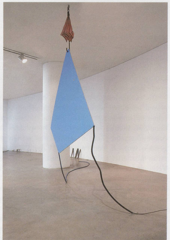
ABRAHAM CRUZVILLEGAS, AUTODESTRUCCIÓN 8: SINBYEONG (Self-Destruction 8: Sinbyeong), 2015, found objects from redevelopment areas in Seoul, variable dimensions, installation view Art Sonje Center / SELBSTZERSTÖRUNG 8: SINBYEONG, gefundene Gegenstände aus Sanierungsgebieten in Seoul, Masse variabel, Installationsansicht.

der öffentlich sogar als Linguist firmiert, scheint der Mann offenbar nie zu bedenken, wie sich Aussprachen in allen Sprachen verändern, weiterentwickeln und mit der Zeit korrumpiert werden, noch rechnet er offenbar mit Abweichungen, die sich bei der Transliteration zwischen zwei Sprachen zwangsläufig ergeben. Dass seine archäologischen oder kunsthistorischen Belege aus Quellen stammen, zwischen denen Hunderte von Jahren liegen, ficht ihn nicht an. So vergleicht er zum Beispiel bedenkenlos eine Wandmalerei aus Teotihuacan (um 1. Jh. v. Chr. – 8. Jh. n. Chr.) mit einem koreanischen Genrebild aus dem 18. Jahrhundert. Bei der Begegnung mit einer anderen Kultur freuen wir uns oft, wenn wir darin vertraute Züge entdecken, die wir von uns selbst kennen. Wir verfälschen womöglich sogar unsere eigene Muttersprache und modellieren die fremde, damit sie ähnlich klingen. Selbst ein vermeintlich seriöser Wissenschaftler könnte dem Verlangen nach derartigen Berührungspunkten und Identifizierungen an-