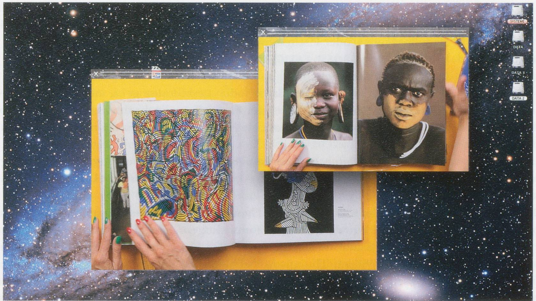
CAMILLE HENROT, GROSSE FATIGUE , 2013, video, color, sound, 13 min. / STARKE MÜDIGKEIT, Video, Farbe, Ton.

Quastenflosser die Vögel, und die Weichtiere bringen Bienen hervor, mit dem Erfolg, dass das Ganze ebenso archaisch wie karnelesk wirkt – als veranstaltete Zarathustra im Bauch der Arche Noah eine wollüstige artenübergreifende Orgie. Es folgt eine Aufzählung der Fachgebiete, eine Liste sämtlicher Zweige des formalen Wissens: Theologie und Hydraulik und Botanik und Politik und Orthographie und Pathologie und so fort, in zunehmend hysterischer Ausuferung. Unterdessen beginnen die Zauberlehrlinge – die viralen Pop-up-Fenster – eine kohärente Gestalt anzunehmen, sie stapeln sich in zentrierter Vielfalt zu einem funkelnden Op-Art-Werk aus verschachtelten Bildschirmen. Als diese geordnete Konzentrität schliesslich zur Ruhe kommt, wechselt die Stimme nahtlos von der Kategorie des Wissens zur Kategorie gesellschaftlicher Sexualordnungen – Monogamie, Polygamie, Polygynandrie und so weiter. Voilà , die grandiose Stufenpyramide mosaikartiger Bildschirme endet plötzlich in der kleinen kompakten Aufnahme einer Frau, die ihre Hand tief in ihren Slip gleiten lässt und sich ausgiebig selbst befriedigt. Stimme: «Und Gott ruhte.» Der Höhepunkt? Nein. Meeresschildkrötenbabys. Warum?