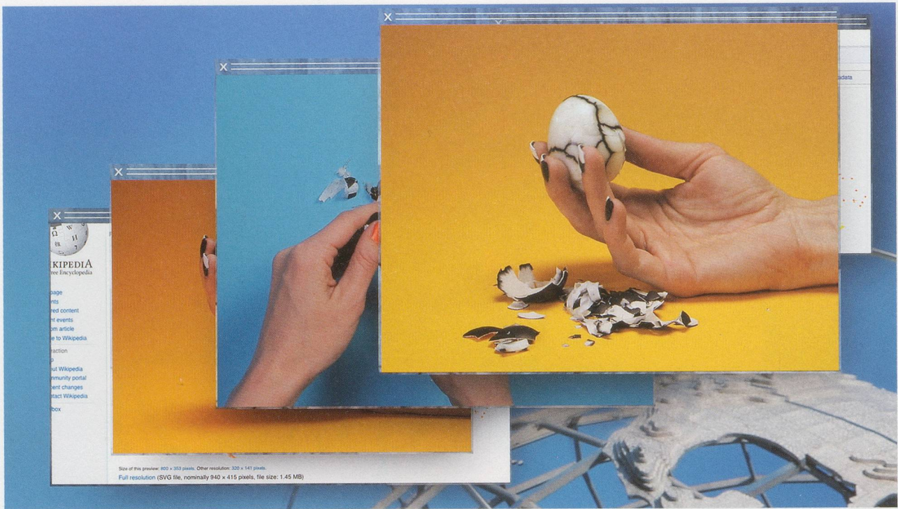
CAMILLE HENROT, GROSSE FATIGUE , 2013, video, color, sound, 13 min. / STARKE MÜDIGKEIT, Video, Farbe, Ton.

DGB: OK. Could I try to get there with you? Get to a perspective, I mean? With you? Me and you. Together. By chatting?