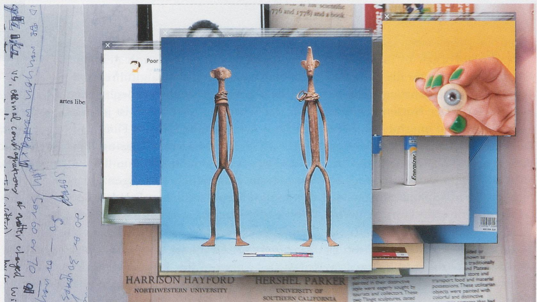
CAMILLE HENROT, GROSSE FATIGUE, 2013, video, color, sound, 13 min. / STARKE MÜDIGKEIT, Video, Farbe, Ton.