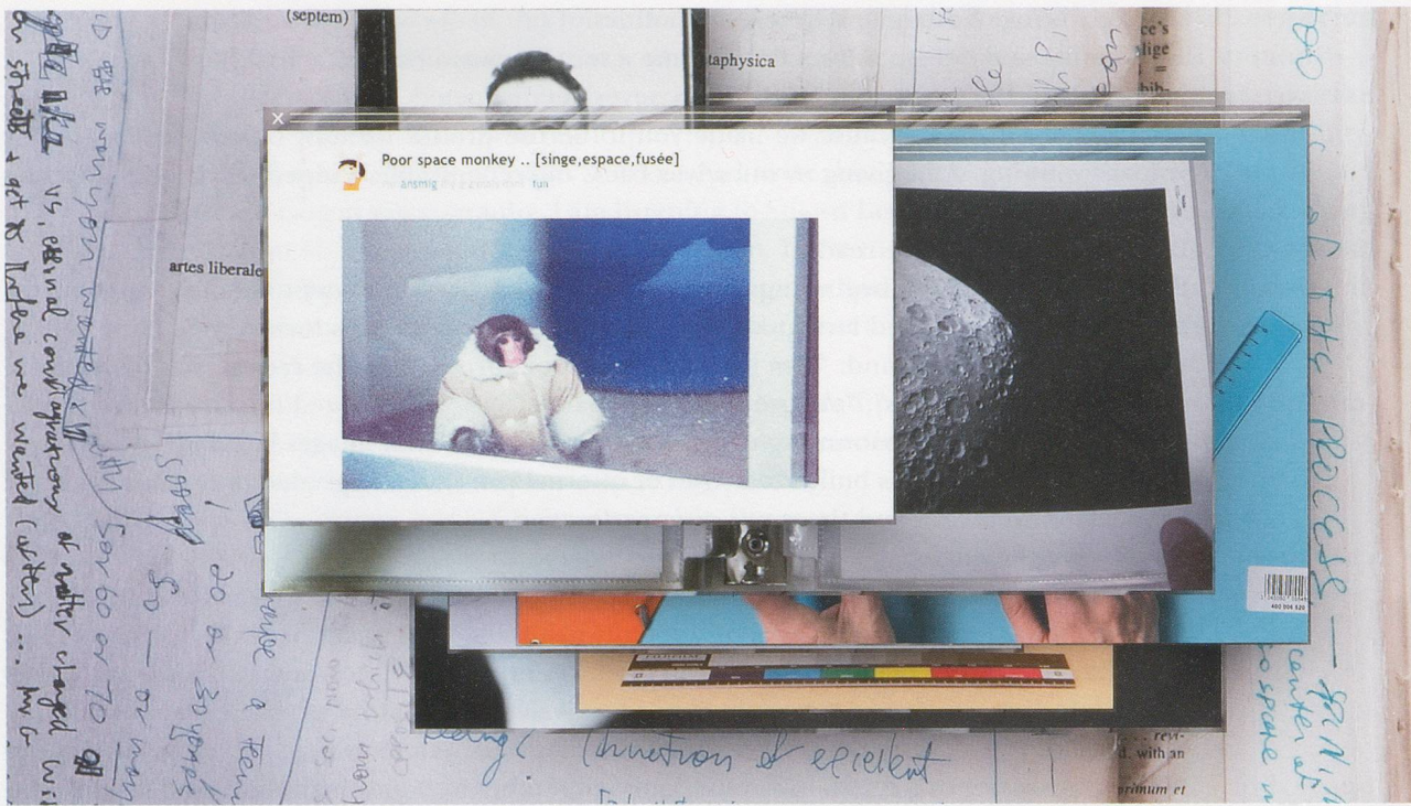
CAMILLE HENROT, GROSSE FATIGUE , 2013, video, color, sound, 13 min. /