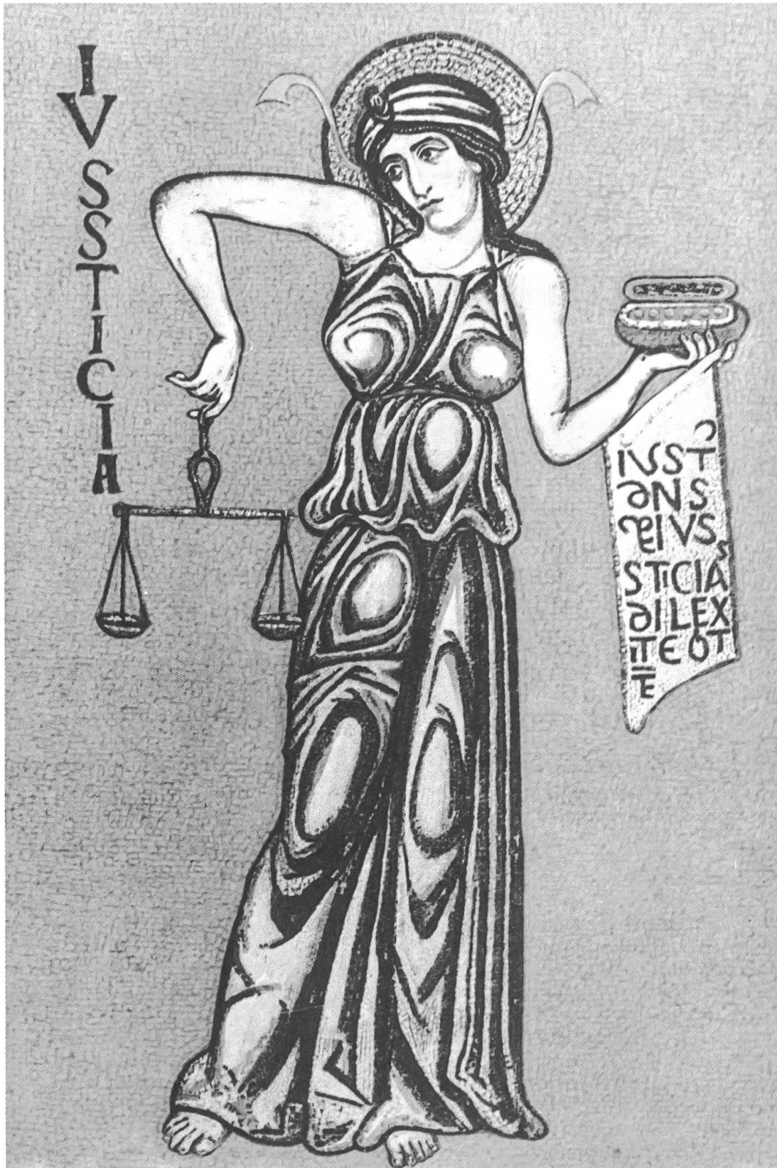
Abb. 1: La Giustizia. Mosaik aus dem 13. Jahrhundert in der Zentralkuppel der San Marco-Kirche in Venedig.