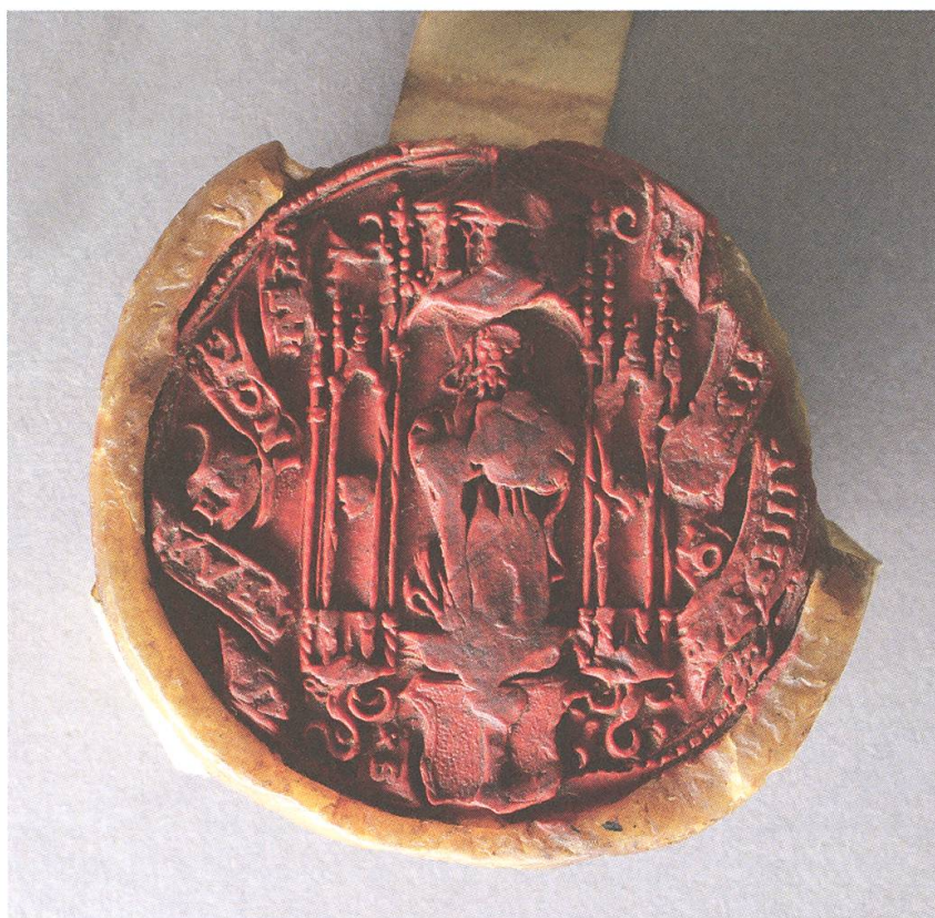
Abb. 8. Siegel der Äbtissin Catharina Rink von Baldenstein (1533–1548). KAM, VIII/79.

1 CLAVADETSCHER/MEYER, Burgenbuch, S. 132–134; MÜLLER, Geschichte, S. 114. – 2 KAM, VIII/46. – 3 KAM, VIII/48 (25.1.1519); KAM, VIII/49 (12.3.1521); GA Sta. Maria V. M., Urk. Nr. 24 (2.5.1522); KAM, VIII/51 (29.3.1527). – 4 KAM, VIII/60. – 5 KAM, III/2. Bischöfl. Bestätigung, 4.8.1535. – 6 BAC, 512.01.02-004. Äbtissin an König Ferdinand I., 23.4.1535; Oberösterreich. Regierung an Bischof von Chur, 26.4.1535 (Kopie: KAM, III/1). – 7 KAM, VIII/62–68, 70–82. – 8 THALER, Geschichte, S. 184–185. – 9 GA Müstair, Urk. Nr. 6; KAM, II/10 (6.10.1541; Abschrift); BAC, 512.01.02-006 = FOFFA, Münsterthal, Nr. 52. Dazu: MÜLLER, Geschichte, S. 115–116. – 10 ACB, B 28, Nr. 3 (415). Erklärung der Stiftsprivilegien durch Propst Luzius Rink, 18.6.1540; KAM, XII/7. König Ferdinand I. gewährt der Äbtissin Schutz, 22.3.1540. Dazu: MÜLLER, Geschichte, S. 116. – 11 ACB, B 28, Nr. 4. Oberösterreich. Regierung an Jakob Trapp, 15./16.12.1542; ACB, B 28. Erklärungen der Äbtissin, 1.10.1543. Dazu: MÜLLER, Geschichte, S. 116–117. – 12 KAM, I/77, Necr. (irrt. 1542). – Literatur: THALER, Geschichte, S. 183–193; MÜLLER, Geschichte, S. 114–118; MEYER-MARTHALER, Müstair, S. 1901. – Siegel: Abb. 8.