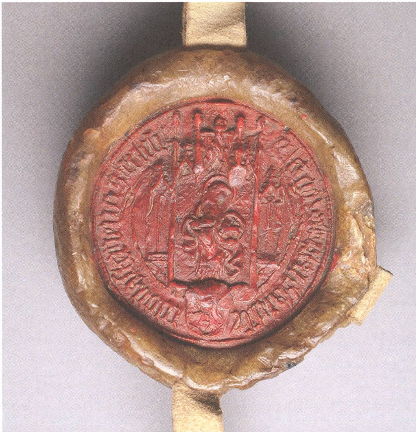
Abb. 3. Siegel der Äbtissin Agnes Kytz (1418–1436). KAM, VIII/24.

hat, wählt die Äbtissin bzw. der Konvent am 11.5.1421 die Herzöge von Österreich zu Schirmvögten. 4 Am 26.5.1421 stellt Herzog Friedrich IV. das Kloster formell unter seinen Schutz. 5 Für 1422, 1424, 1428 und 1433 sind Güterverleihungen in Tisens, Nals, Kortsch und Burgeis sowie für 1429 der Erwerb eines Hauses mit Hofstatt und Garten in Müstair durch die Äbtissin nachweisbar. 6 Wie sehr sie sich bemüht hat, den Besitzstand des Klosters zu wahren, verdeutlichen zwei Urbare, die während ihrer Amtszeit angelegt werden. 7 Sie ist am 3.11.1436 im Zusammenhang mit der Lehensvergabe des Zinses eines beim Kloster gelegenen Gebäudes letztmals urkundlich bezeugt. 8