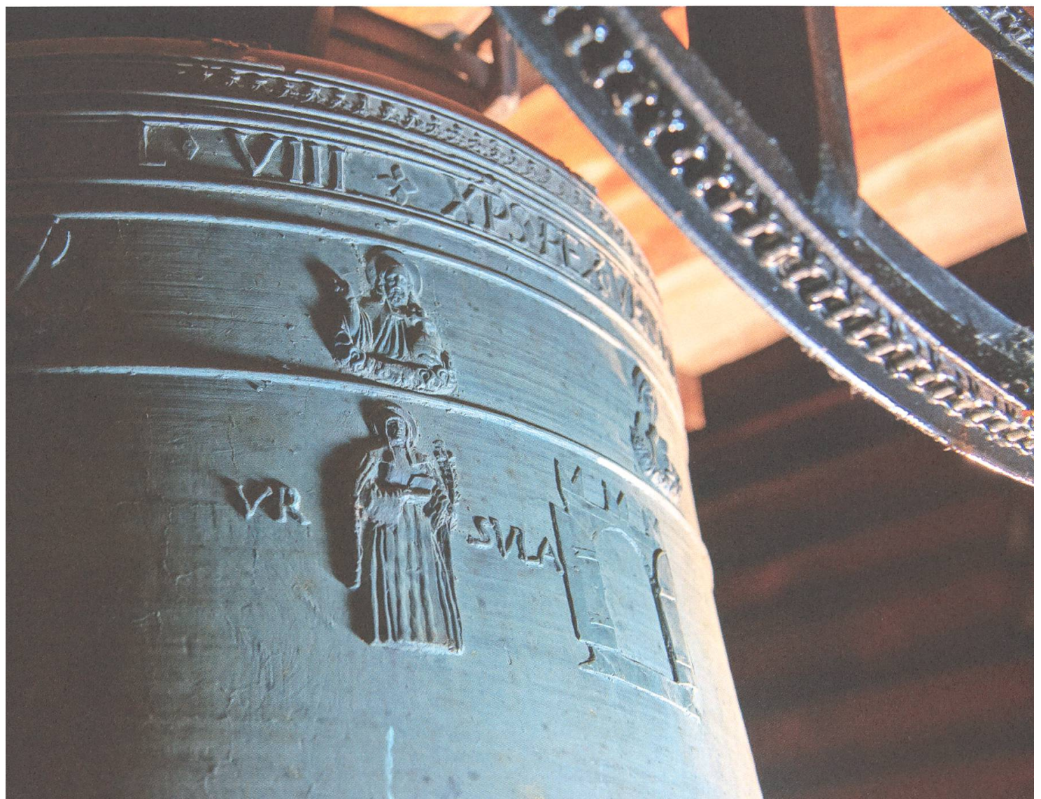
Abb. 9. Grosse Glocke von 1558 mit dem Wappen der Äbtissin Ursula à Porta (1548–1562) im Turm der Klosterkirche Müstair.

durch Bischof Lucius Iter von Chur (1541–1549) als Äbtissin bestätigt. 4 Für die Jahre 1549 bis 1562 lassen sich zahlreiche Lehensverleihungen und Lehensbestätigungen durch das Kloster nachweisen. 5 In ihre Amtszeit fallen der Konflikt um die Jurisdiktionsbereiche von Kloster- und Gotteshausgericht, mit dem bereits ihre Vorgängerin Catharina Rink konfrontiert worden ist, 6 und der Streit um den Besitz des Lai da Rims 7 sowie die Alpenteilung vom 12.8.1556. 8 Ursula à Porta lässt zudem die bauliche Ausstattung ergänzen sowie mehrere Bauvorhaben ausführen. So wird 1549 der Kirchturm mit einer Uhr ausgerüstet und 1558 eine grosse, mit dem Wappen der Äbtissin verzierte Glocke (Abb. 9) gegossen. 9 Die Verteilung der Kosten für die Turmuhr wird im Vertrag zwischen dem Kloster und der Gemeinde Müstair vom 8.1.1549 geregelt. 10 Um 1559 wird vermutlich der Norpert-Trakt um ein Geschoss erhöht. 11 1560 lässt das Kloster im ersten Stock des damaligen Südtraktes einen Saal mit drei Kreuzgewölben einrichten. 12 Eine letzte bekannte von Ursula à Porta ausgestellte Urkunde datiert vom 20.6.1562. 13 Als Todestag werden