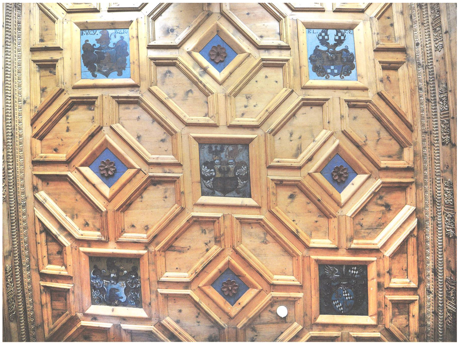
Abb. 13. Kassettendecke des Zimmers von Äbtissin Dorothea de Albertis (1666–1686) im Süd- turm u. a. mit Wappen von Lucia Francisca Quadri, Äbtissin 1686–1710 (rechts).