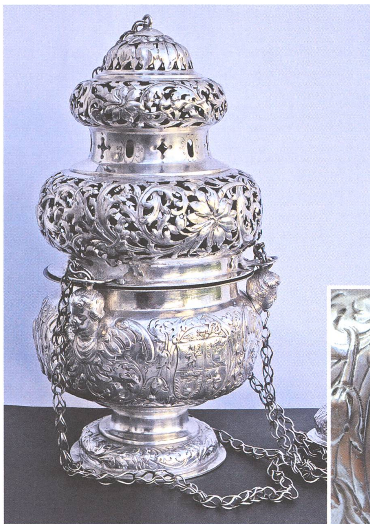
Abb. 14. Rauchfass mit dem Wappen der Äbtissin M. Regina Catharina von Planta-Wildenberg (1711–1733). Kloster Müstair. Bewegliches Kulturgut, Inv.-Nr. 638.

Geboren am 25.10.1671 in Rhäzüns, Kt. Graubünden. Taufname: Regina Veronika. Sie ist die Tochter des Freiherrn Johann Heinrich von Planta-Wildenberg, Herr von Rhäzüns, und der Dorothea Travers von Ortenstein. 1 Sie entrichtet eine Aussteuer von 1'100 Gulden. 2 Die Profess legt sie am 9.2.1688 als Chorfrau ab. 3 Im Jahre 1700 erneuert sie die Ordensgelübde. 4 Bei der Befragung um 1702 votiert sie für die Klosterseelsorge durch Spirituale des Benediktinerordens. 5 Am 21.7.1711 wird sie zur Äbtissin gewählt und am 23.8.1711 durch Bischof Ulrich VII. von Federspiel (1692–1728) in Chur benediziert. 6 Da die Wahl nicht in Anwesenheit des Kastvogt-Kommissars vorgenommen worden ist, anerkennt die Kastvogtei diese zunächst nicht und verweigert die Übertragung der Temporalien. 7 Auch in der darauffolgenden Zeit sucht die Kastvogtei ihre Forderungen und Rechte durch den Anspruch