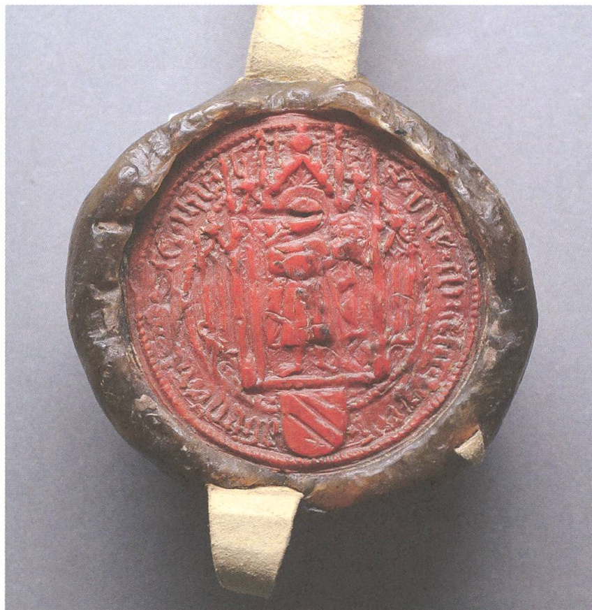
Abb. 4. Siegel der Äbtissin Elisabeth de Pretz (1439–1464). KAM, VIII/25.