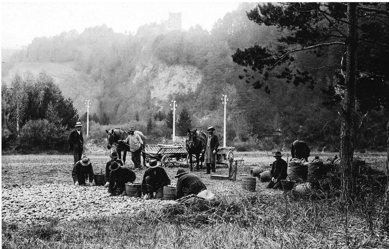
Abb. 6: Insassen der Arbeiterkolonie und der Arbeitsanstalt Realta bei der Kartoffellese, Foto um 1950.