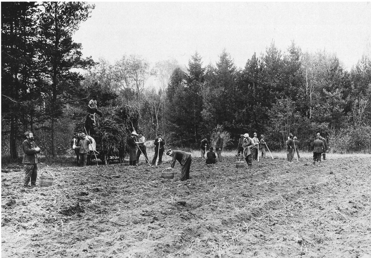
Abb. 5: Insassen der Arbeiterkolonie und der Arbeitsanstalt Realta bei Feldarbeiten, Foto um 1950.