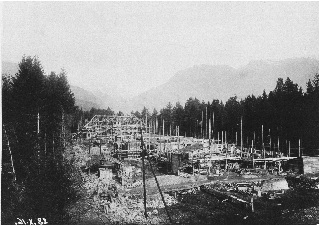
28.X.16. BauteV. Blick auf die Südfassade von K. aus.

Kantonale Versorgungsanstalt Realta (Bau)