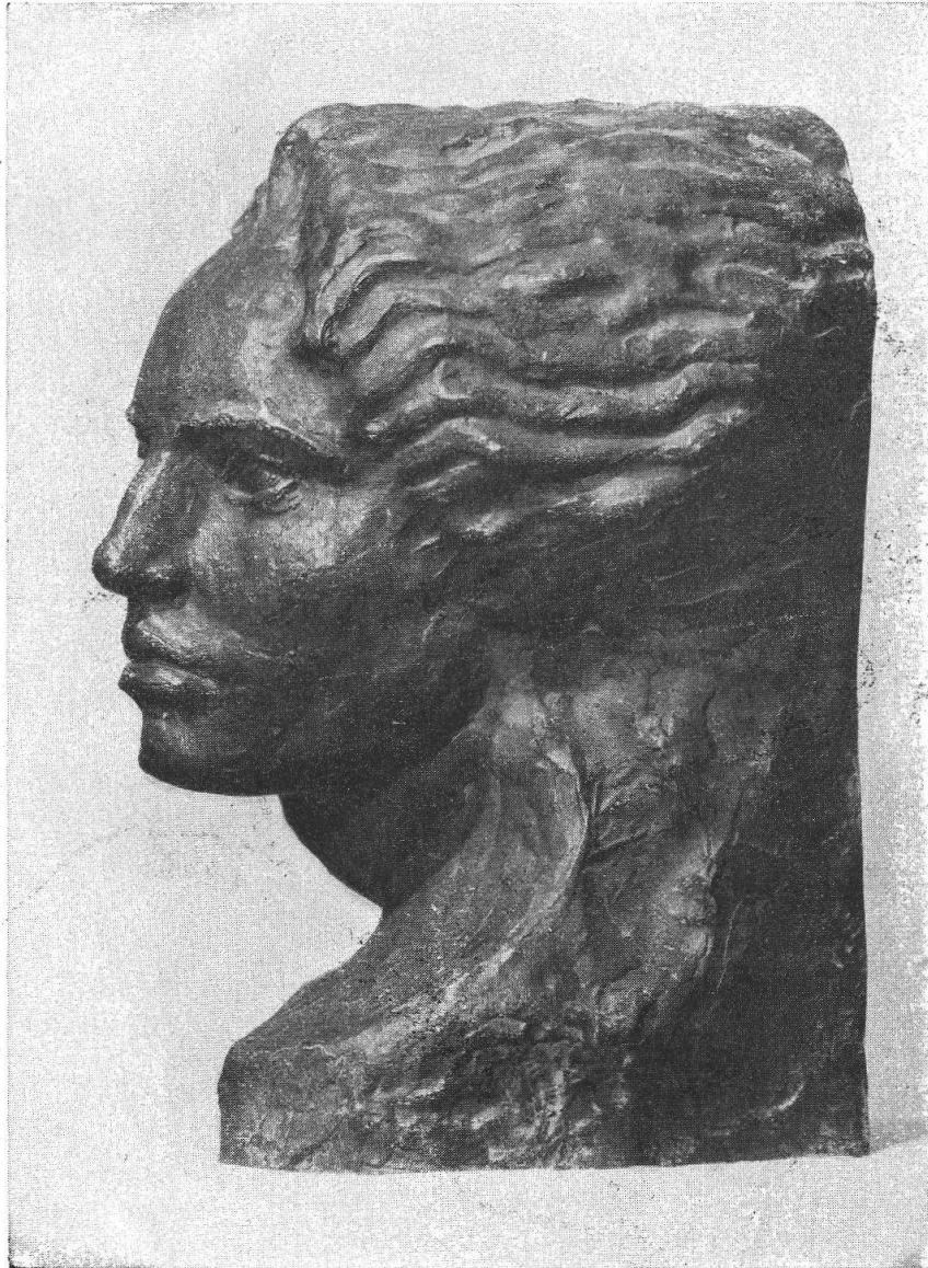
GIUSEPPE FOGLIA — Vittoria - Particolare Monumento Aarau.

Si che ora, dopo alcuni periodi di sosta o di pigra impotenza — durante i quali è campato in margine all'antica fama di scapestrataggine novecentista — egli è tornato a vivere la sua vita dolorosa. A scavarsi una strada che gli desse non già la morbida illusione dell'elogio, ma l'aspra gioia del lavoro, la tenace volontà di continuare, la soddisfazione più intima e più egoista, se vuoi, ma l'unica vera in questo campo. Temperamento di tra-