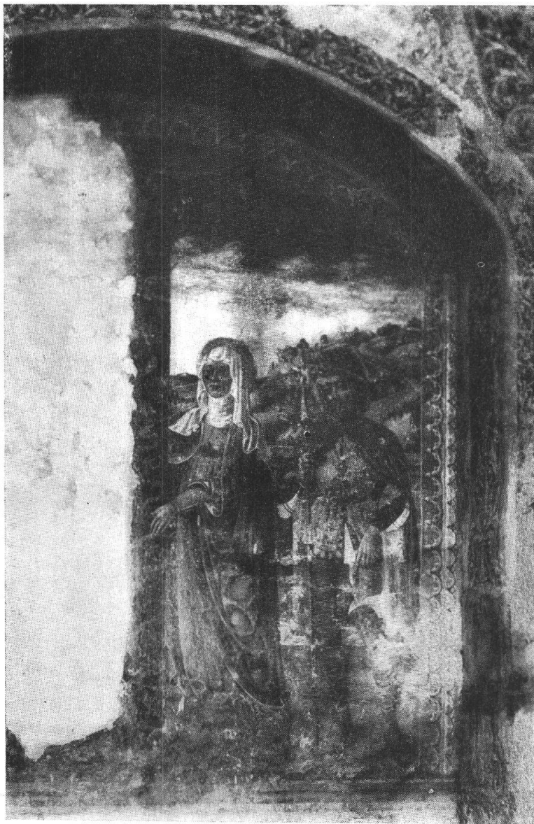
COLLEGIATA DI S. VITTORE.

Per illuminare meglio il coro intendeva praticare una cupoletta, al di sopra dell'abside e poter così murare la finestra laterale, fuori dell'archi-