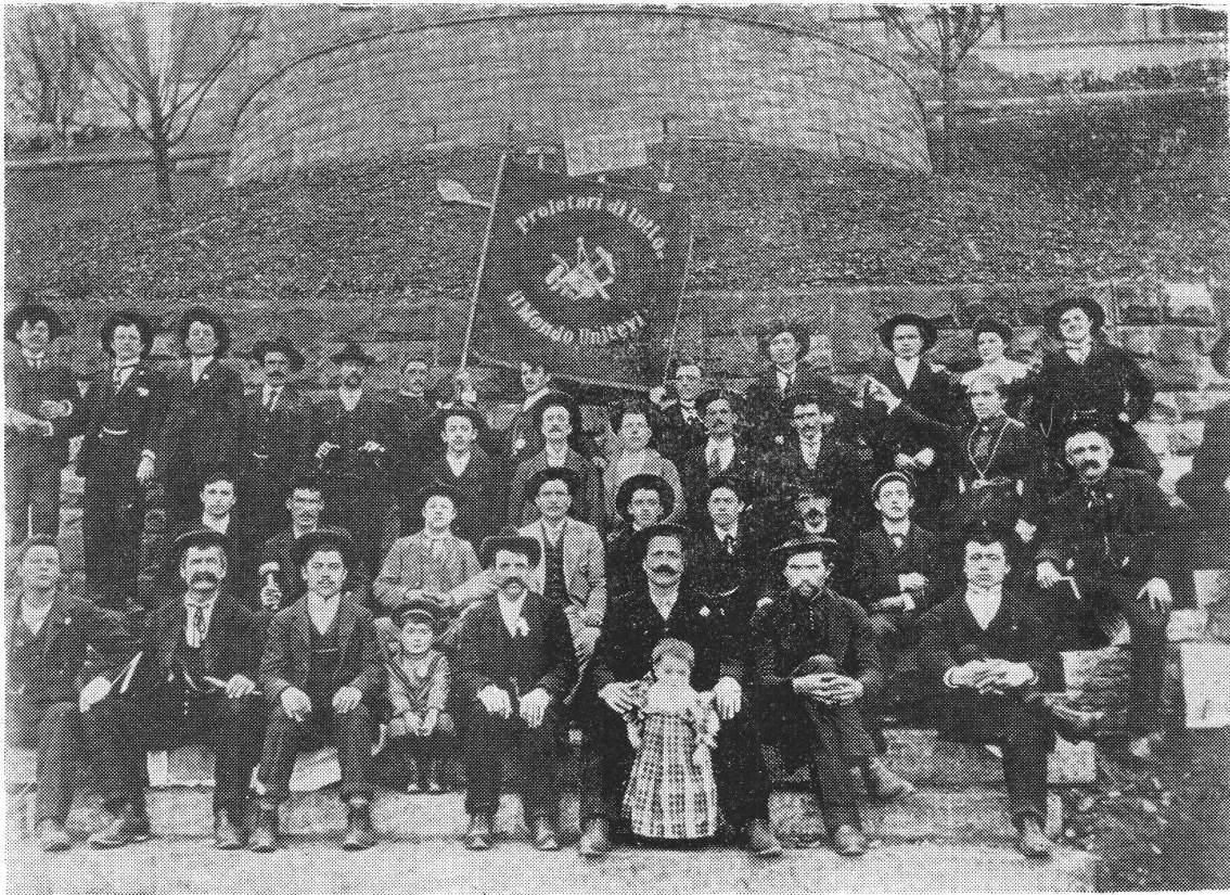
B. Mussolini - nel mezzo della seconda fila - e la Sezione Socialista Italiana di Rapperswyl, 1905.