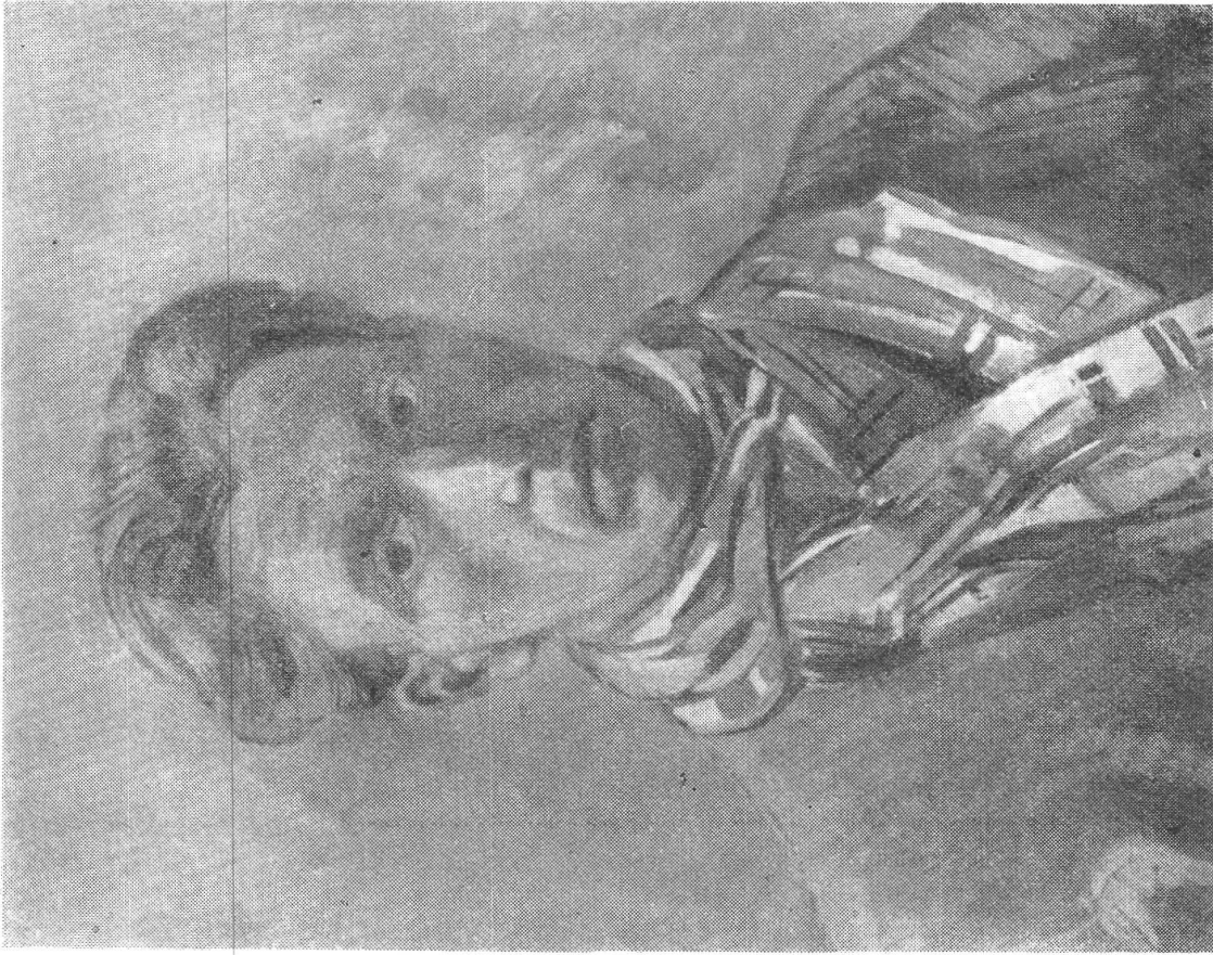
TURO PEDRETTI, Autoritratto (1931). In proprietà privata.