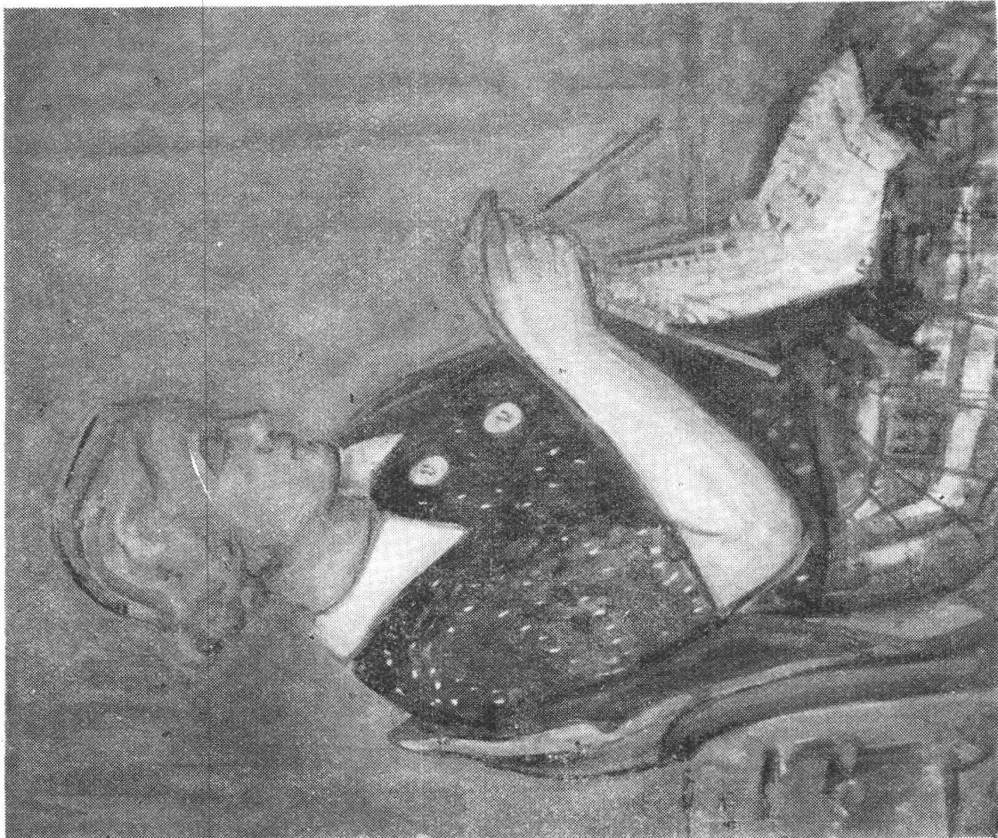
TURO PEDRETTI, « Le tricot bleu » (1936). In proprietà privata. Esposto alla 19.ma Nazionale d'arte a Berna 1936.