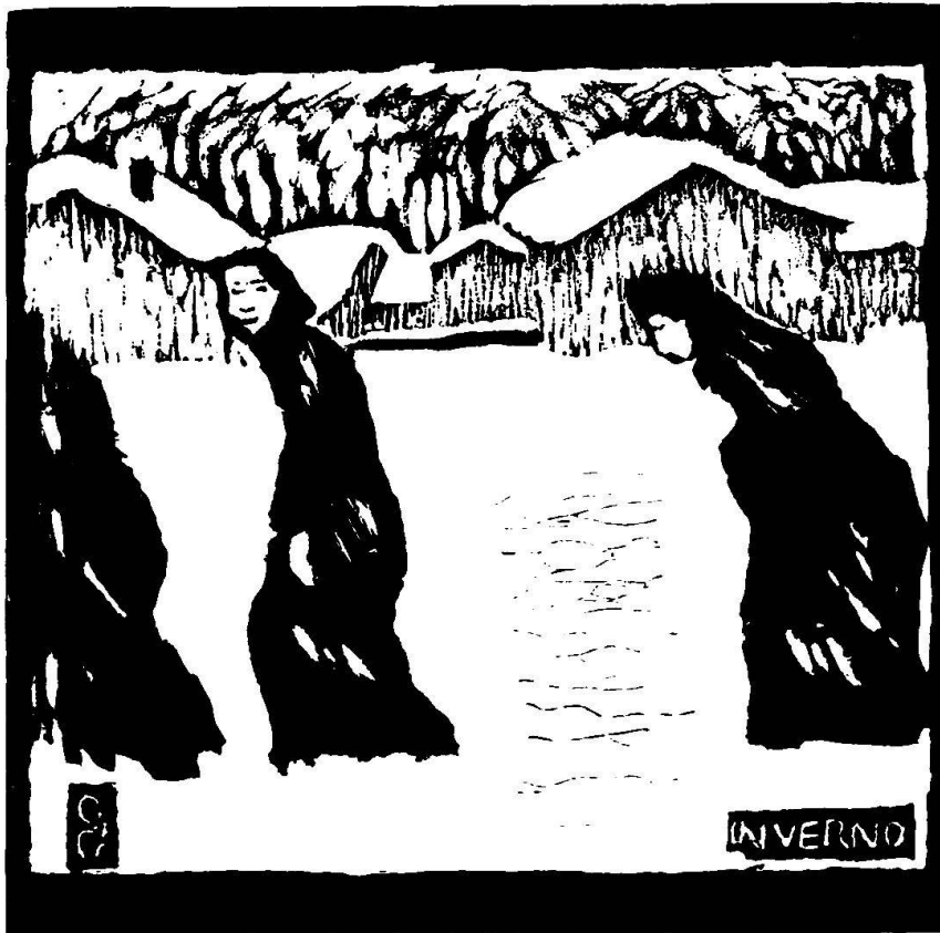
DONNE NELLA NEVE.

stici ancora sconosciuti che essa offriva: Giovanni Segantini, il quale proprio nel 1894 aveva abbandonato Savognino e s'era trasferito a Maloggia, che politicamente fa parte del comune di Stampa. Il Segantini aveva sì dieci anni più del Giacometti; ma anche lui era nato fra le montagne e per tempo s'era dichiarato contrario alle tradizioni accademiche. Tutti e due avevano imparato a conoscere il mondo. Il Segantini però, dopo una dura lotta, s'era affermato. Egli era oramai un giovane artista riconosciuto, rappresentante del nuovo movimento artistico, e poteva guardare addietro su un lungo cammino disseminato di numerose opere di valore. Anche lui nella pittura aspirava alla conquista della luce. Invece di impastare i colori, egli li metteva l'uno accanto all'altro. Questo modo