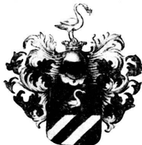
Arma de Lossius.