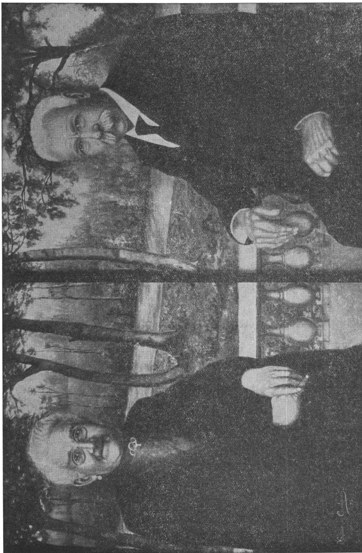
XENIA DE CANTIENI — I miei genitori — Olio.