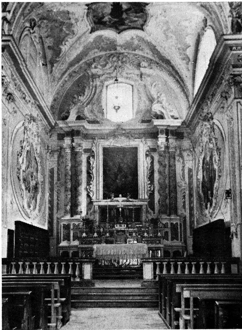
Sant'Anna — Coro

Al primo passato ricordano la sacristia, ma particolarmente l'ALTARE DELLA VERGINE a destra dell'entrata del coro. — « Adest in ibi (nella chiesa) Capella vetustissima miraculo aedificata in honorem Dei' para' Maria Virginis Lauretana, unde etiam nomen accepit », scrive il vescovo Zoller nelle sue « Ordinazioni » 21 V 16126. —