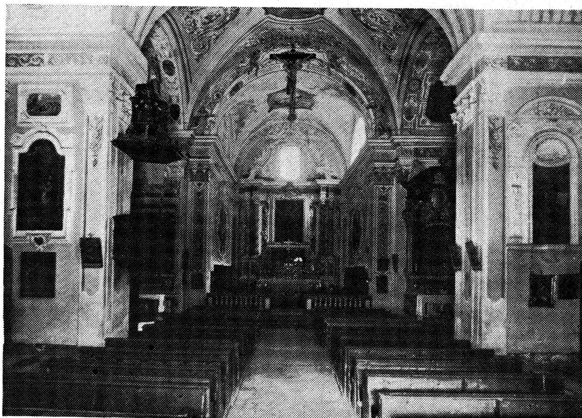
Sant'Anna — Interno