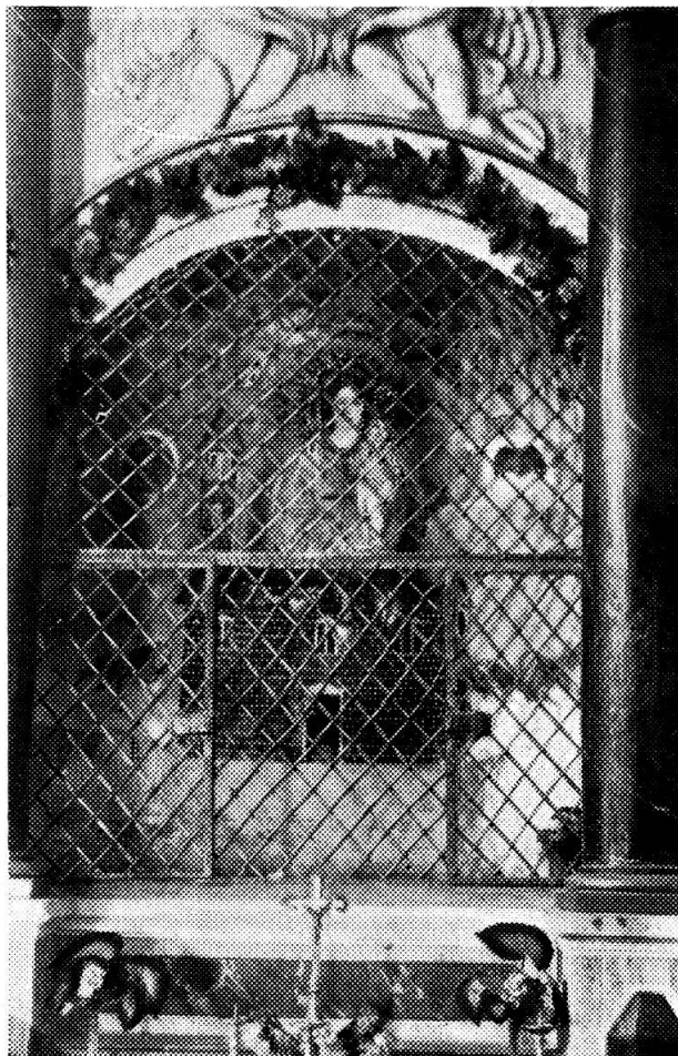
Sant'Anna — Affresco cappella della Madonna

Sei le cappelle, di cui quattro con l'altare sulla parete laterale e due con l'altare nella parete dell'entrata nel coro. A sinistra della porta maggiore: San Tommaso, Santa Lucia e San Giuseppe; a destra: Sant'Antonio da Padova, San Francesco d'Assisi e la Madonna.