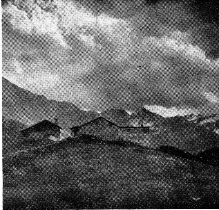
Montagna alpina « La Motta », in Val Agonè