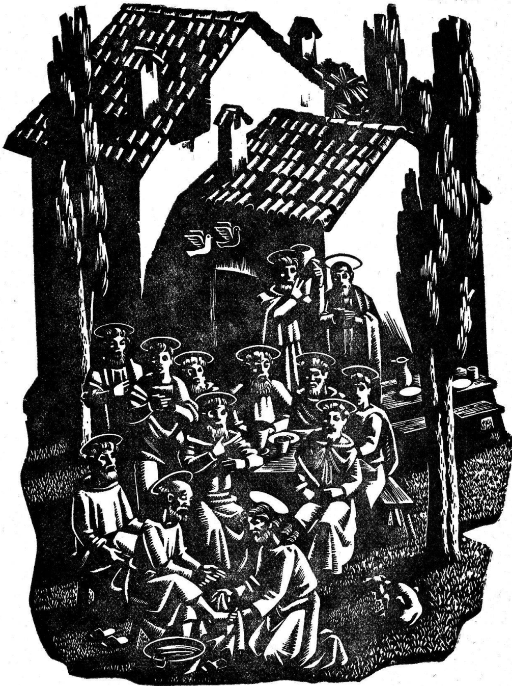
LA LAVANDA DEI PIEDI