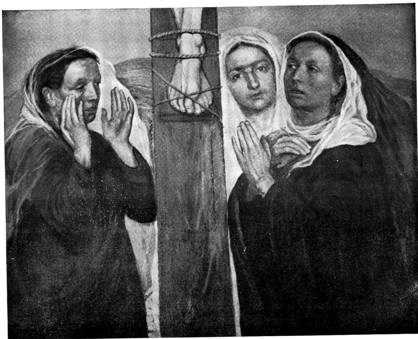
Augusto Sartori - La Crocifissione. Dettaglio 1932