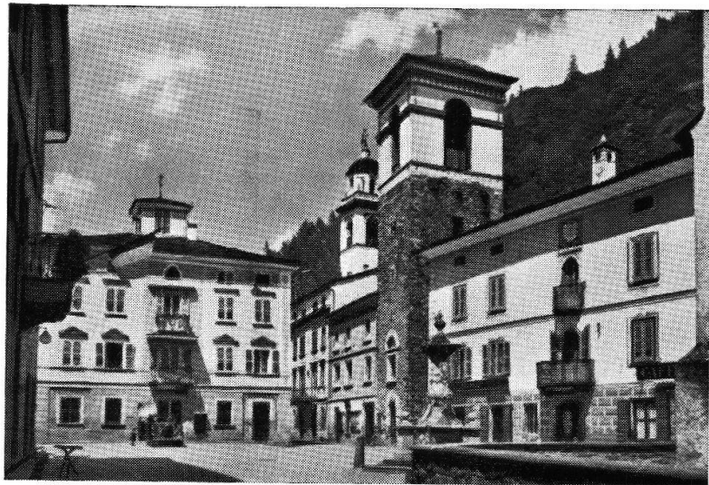
Il Municipio di Poschiavo (parzialmente) sede attuale del Museo di Poschiavo