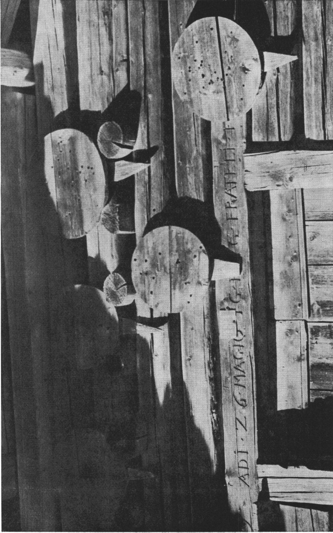
I « tavolaz » che in Bregaglia servivano per il tiro al bersaglio