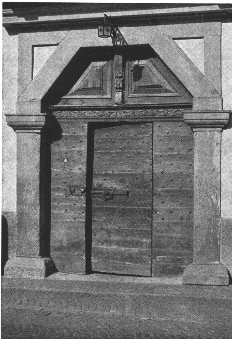
Portone della casa Albrici a Poschiavo