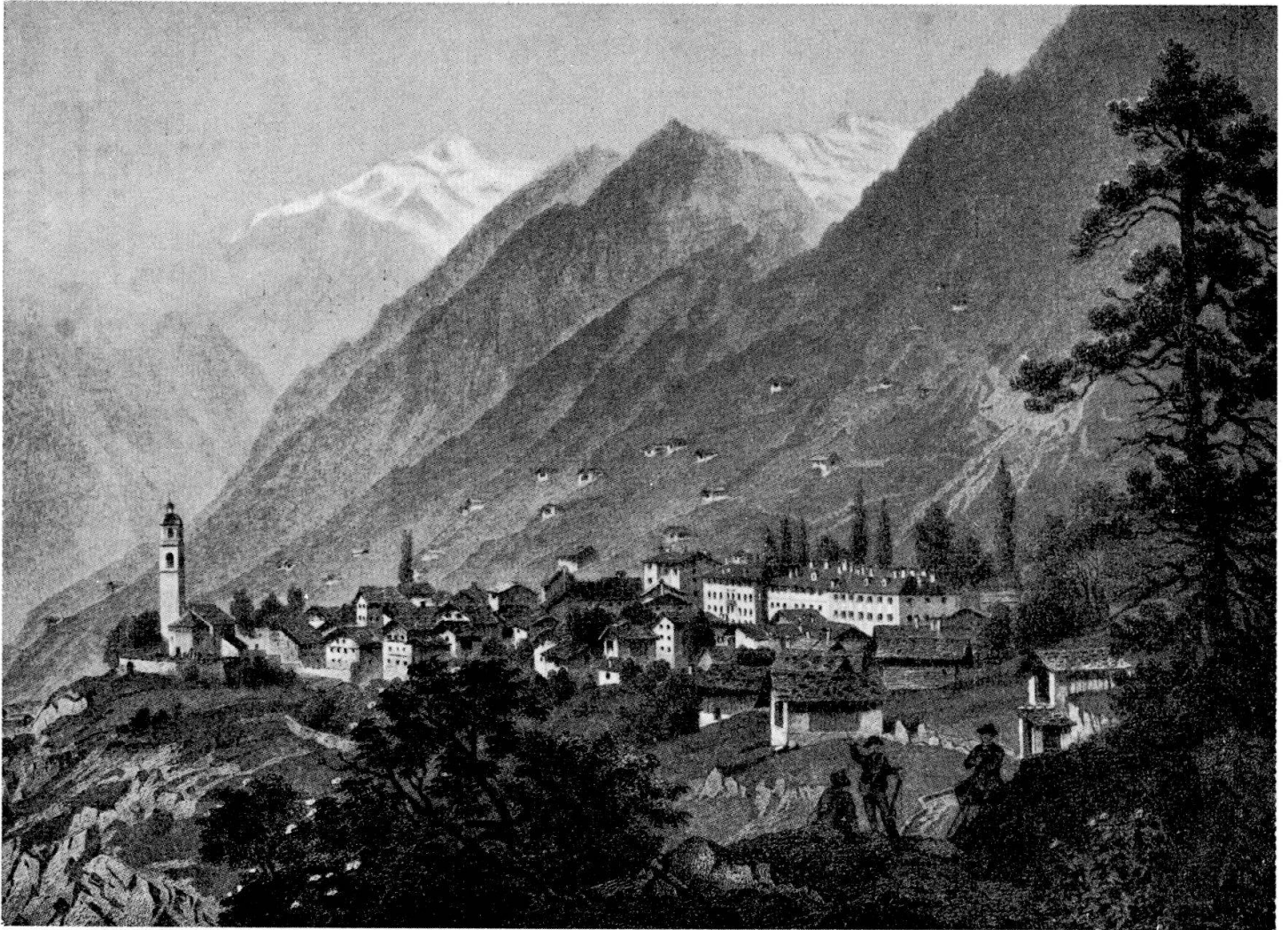
Veduta di Soglio da una stampa dell'ottocento. Si distinguono chiaramente, a nord del villaggio, i tre maggiori palazzi von Salis.

1847), e mette la facciata principale sulla piazzetta. È di forme solenni ed esemplarmente semplici, sa ancora di gusto classico; l'asse principale è segnato dal portone centinato, a bugnatura rustica, e da due balconi in ferro battuto, a corbeille; le finestre (cinque su due piani) sono lisce e agiatamente spaziate; i piani sono segnati da nude fasce, alle quali rispondono poderosi banchi di pietra davanti alle finestrelle di cantina, e in alto l'ampia gola della gronda. Nessuna decorazione, tutto è affidato alla giustezza armonica delle proporzioni.