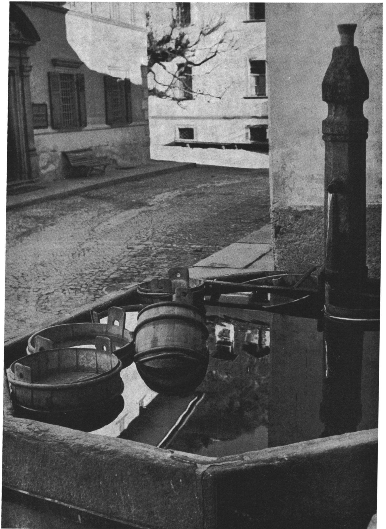
La fontana pubblica davanti alle case von Salis, con i secchi di legno di fabbricazione locale, che rammentano la pastorizia