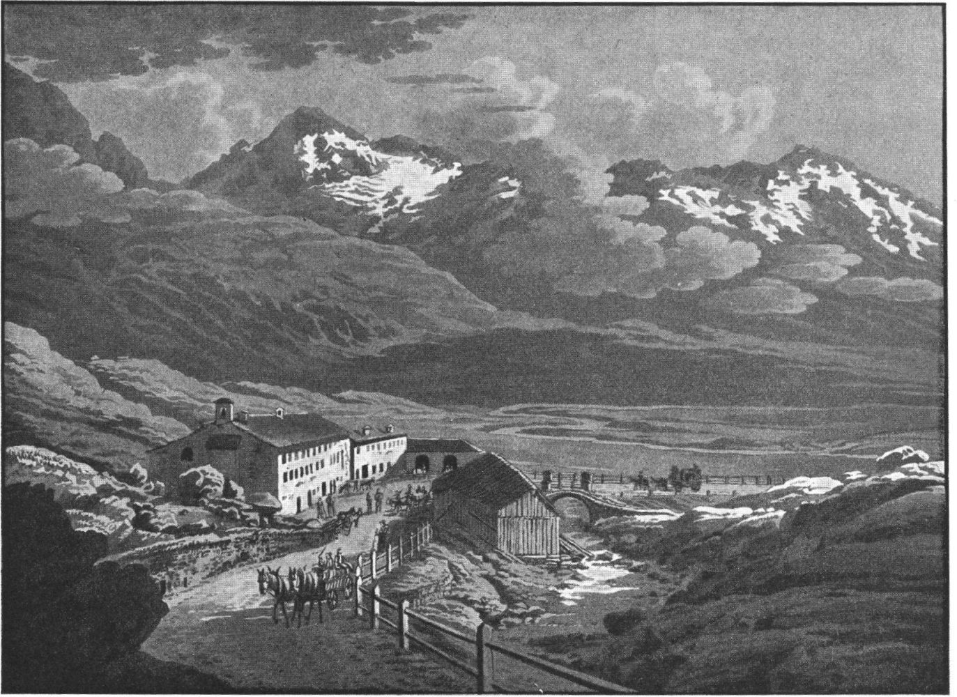
J. J. Meyer, 1825: Osteria dello Spluga (Montespluga)