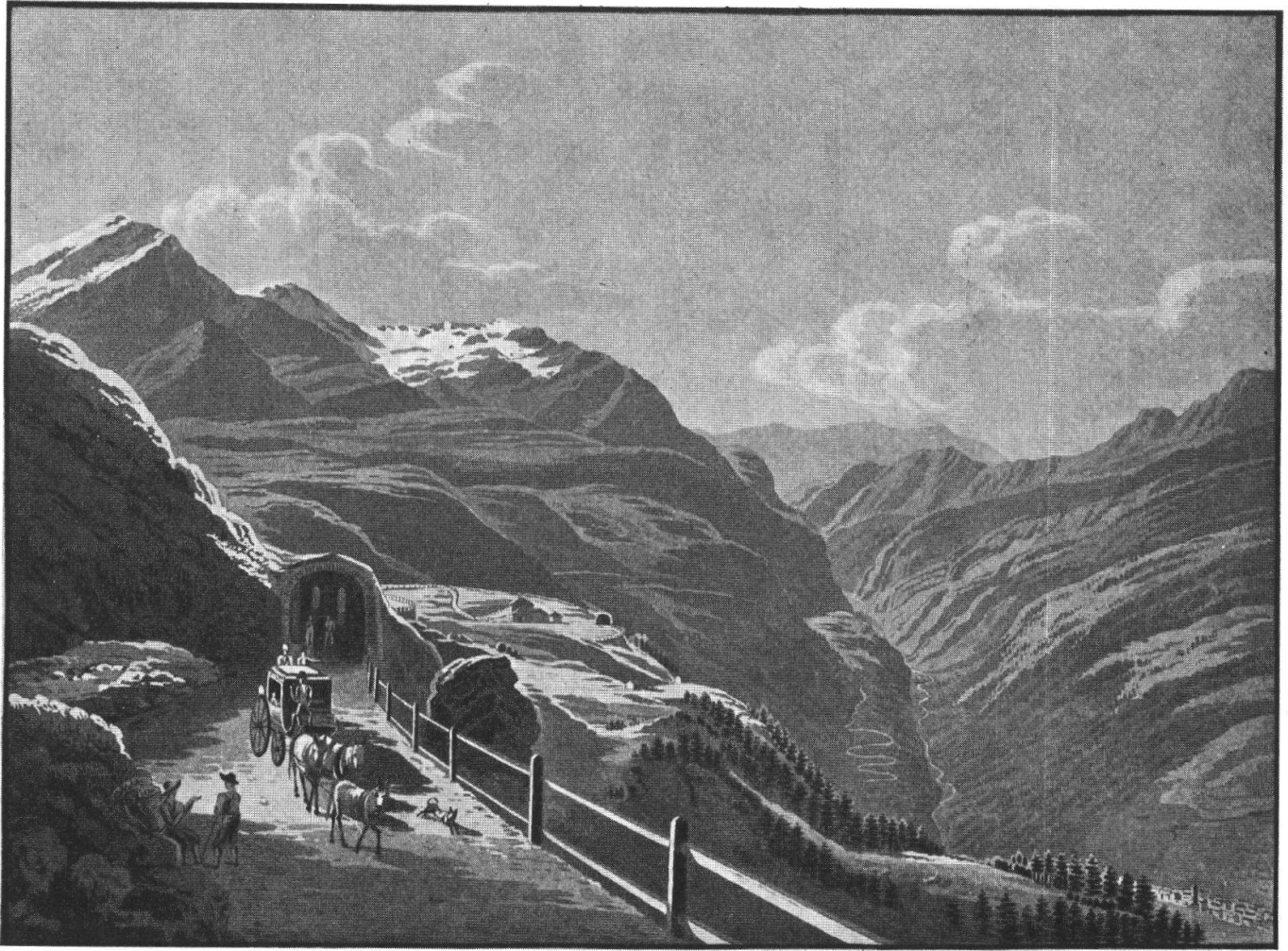
J. J. Meyer, 1825: Gallerie contro le valanghe nella Valle di San Giacomo