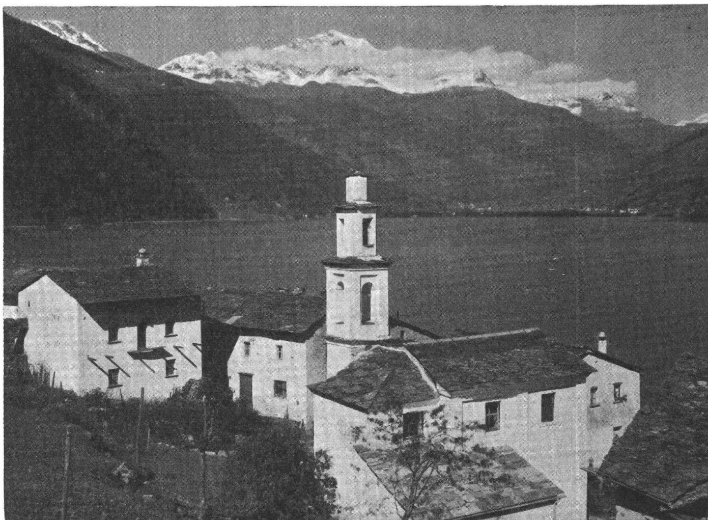
Chiesa di S. Gottardo a Miralago