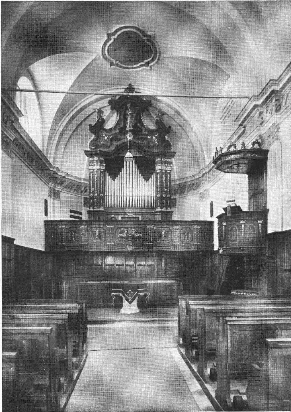
Interno della chiesa evangelica di Brusio