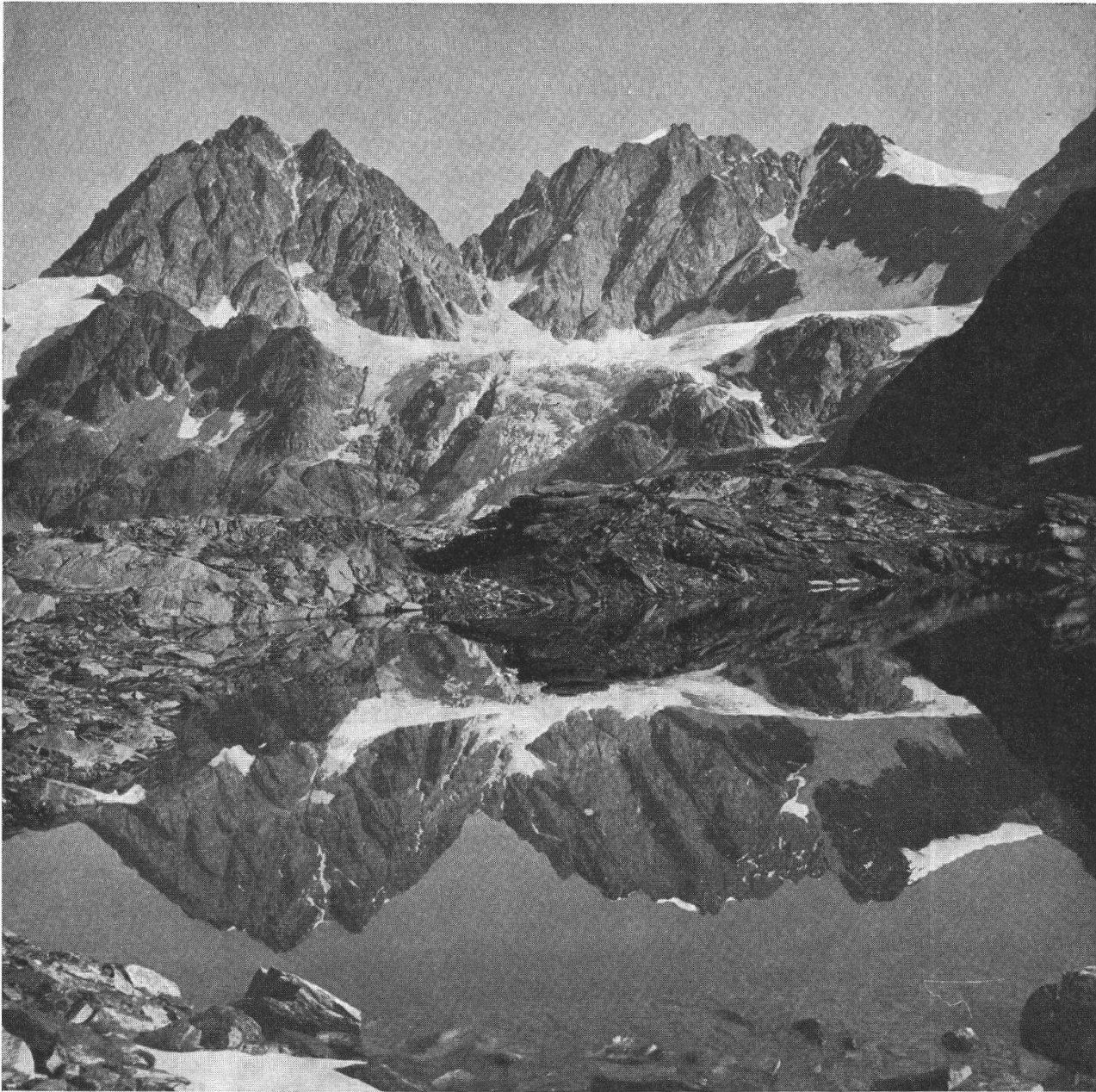
Roseg - Scerscen - Bernina - m. 4050