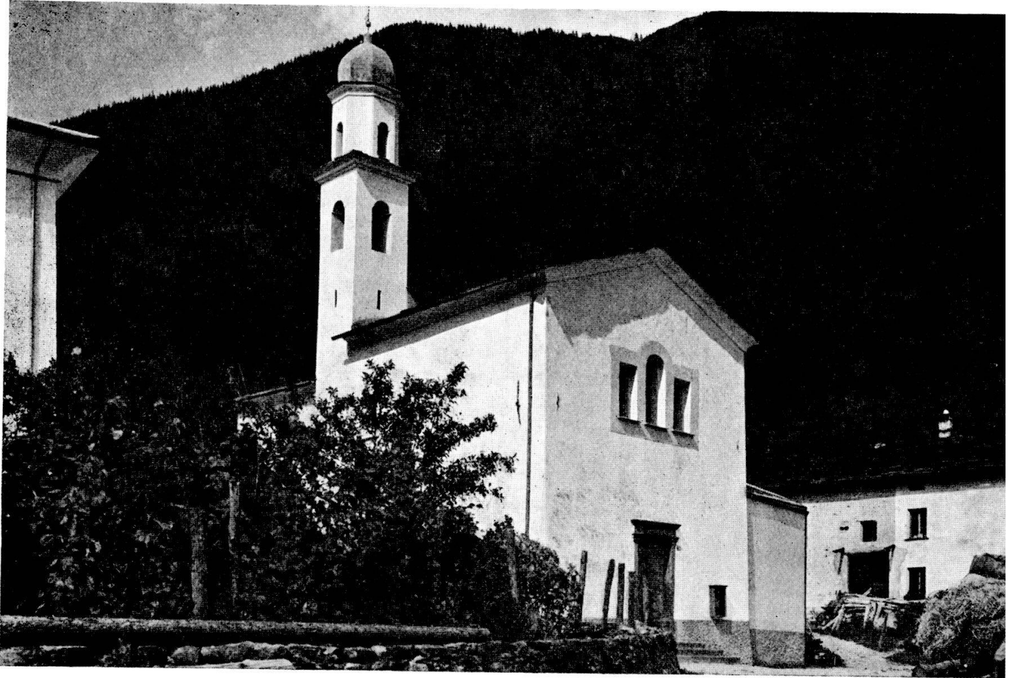
Chiesa di Pagnoncini