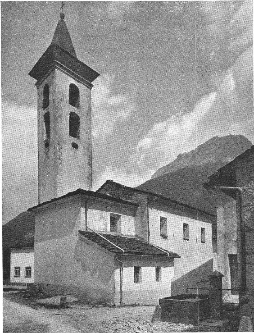
Chiesa di Sant'Antonio in Campiglioni