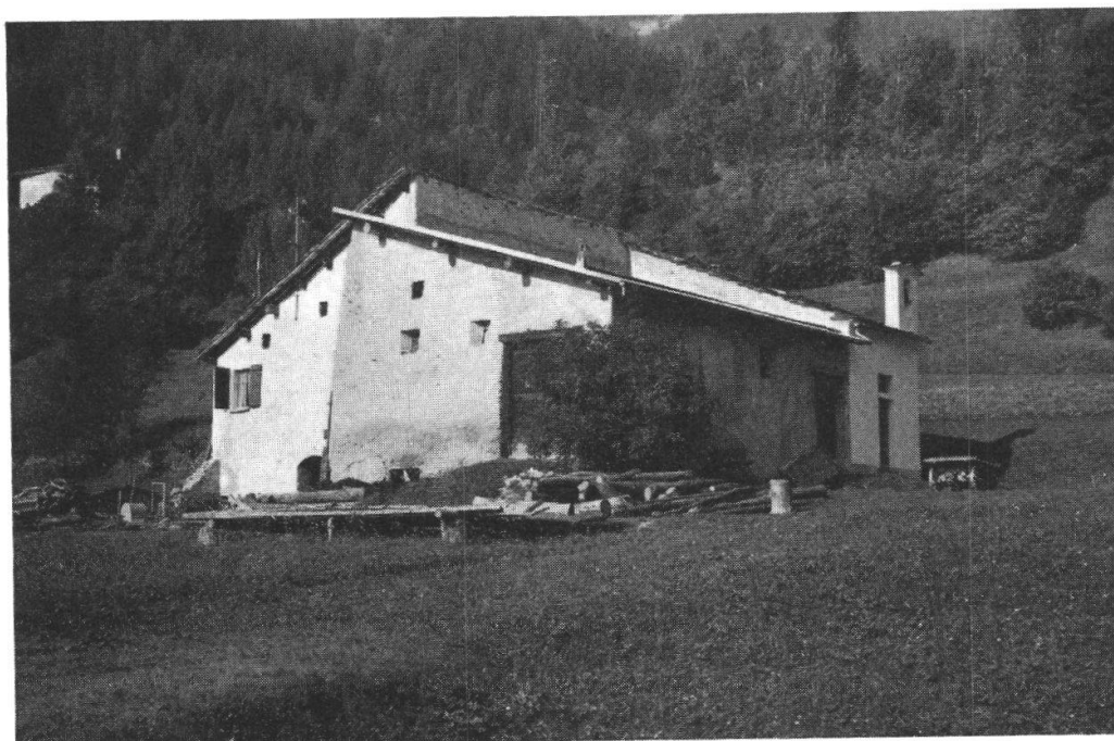
Chiesetta di Sottomotte