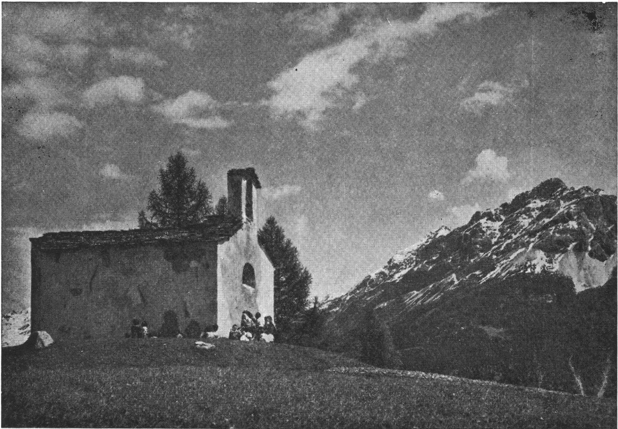
Chiesetta evangelica a Selva