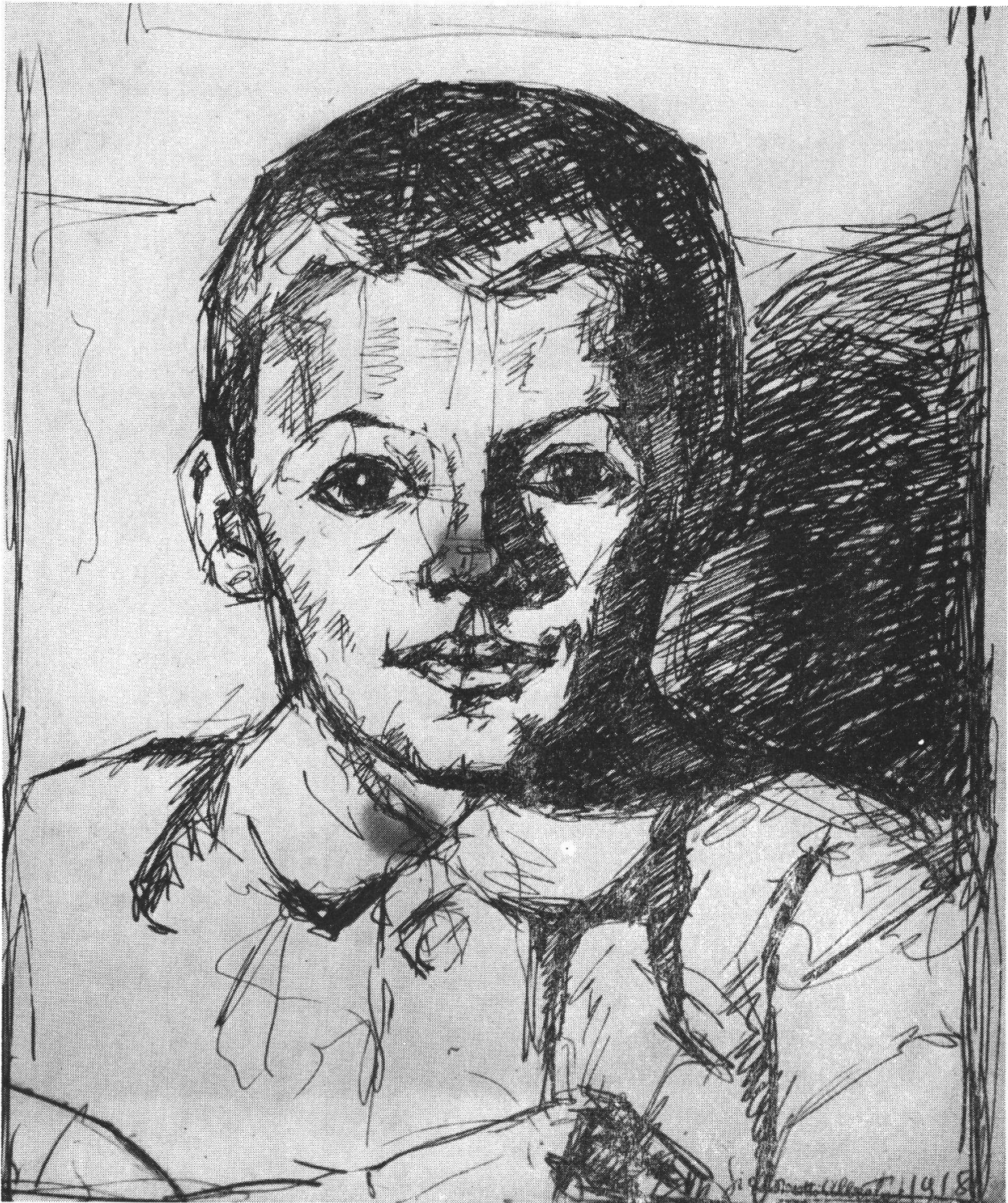
ALBERTO GIACOMETTI: Ritratto (disegno) 1918.