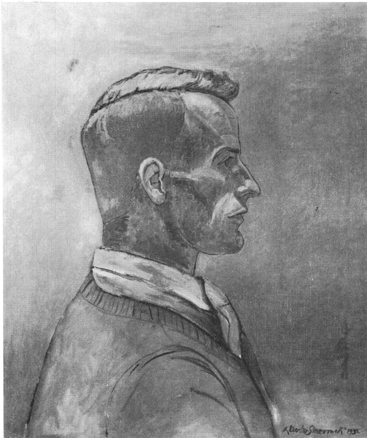
ALBERTO GIACOMETTI: Ritratto (olio) 1932.