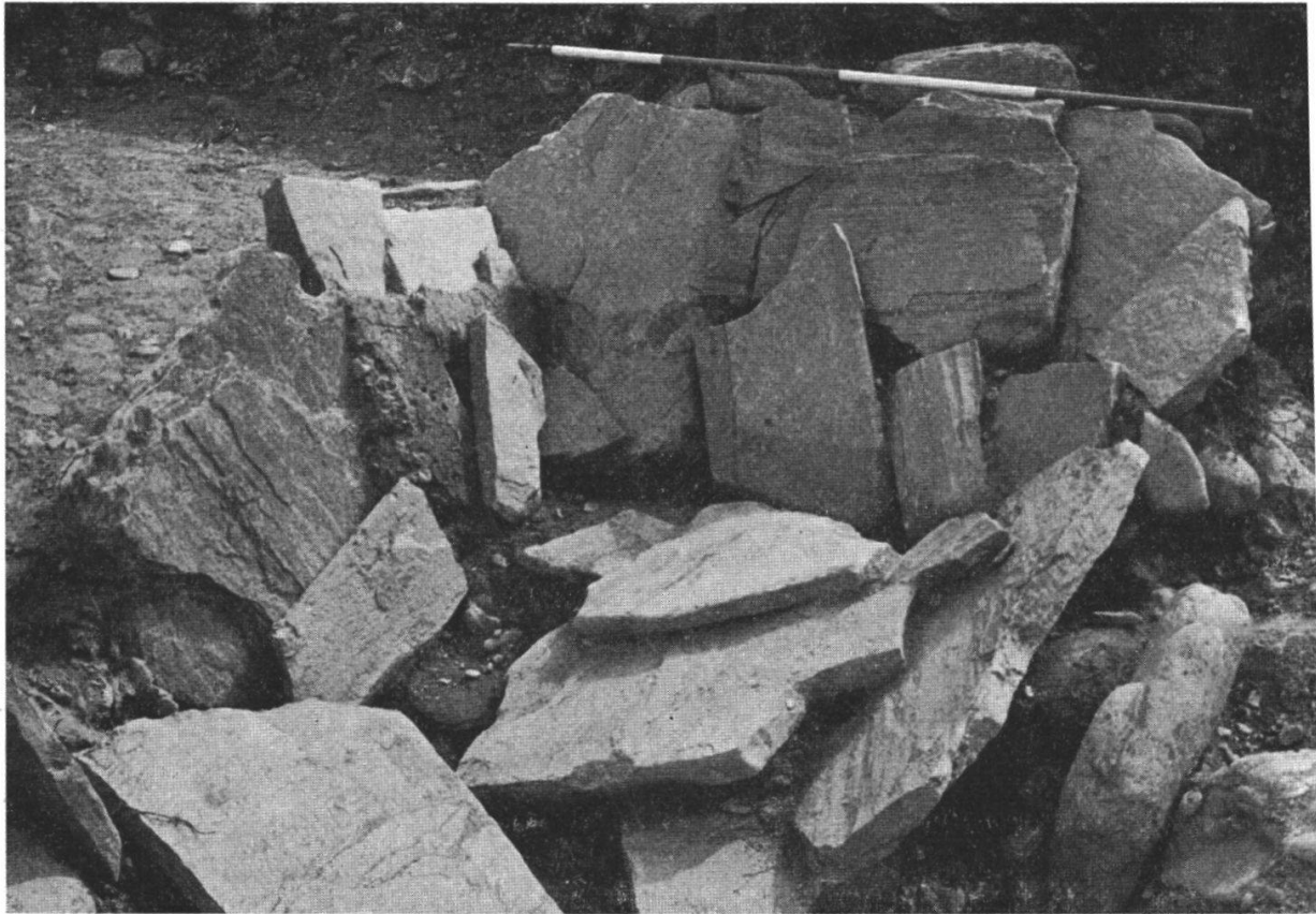
Fig. 8: Tomba n. 12. Altro esempio di saccheggio. Si osservino le dimensioni: l'asta in alto è lunga 2 metri