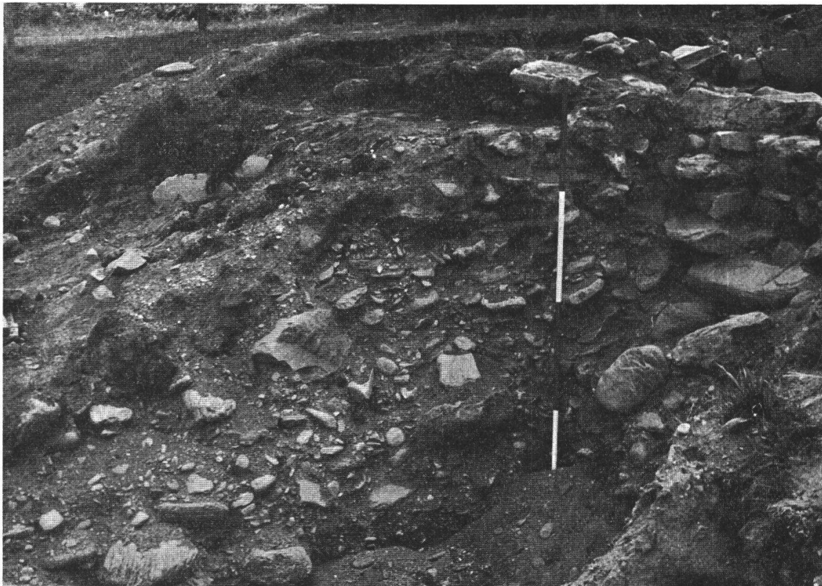
Fig. 2: Muri della CANTINA (a destra, in alto)