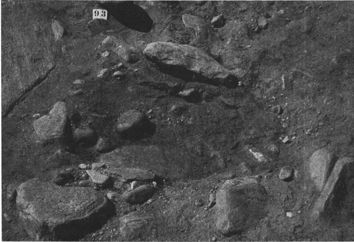
Fig. 9: Piccola tomba a cremazione, cavità minima, piena di cenere e di resti ossei, con tre anelli di ferro e la fibbia qui sotto riprodotta (tomba n. 9)