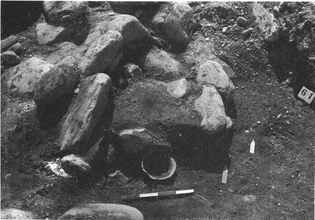
Fig. 4: Tomba n. 6: Grossi ciottoli giacciono sopra i vasi. Le frecce indicano la posizione delle monete e della fibbia. (Da nord-ovest)

una bellissima fibbia di ferro, la quale giaceva al sommo della tomba, direttamente sotto la lastra di copertura (fig. 10). Delle 30 sepolture esplorate 9 erano certamente a cremazione, frammiste a quelle a inumazione. Tutt'e due i tipi di sepolcro contenevano reperti chiaramente romani, e devono essere collocati fra il 30 e il 120 d. Cr. Contammo 9 tombe indubbiamente a inumazione. Solo l'esame approfondito del contenuto dei vasi e del materiale che le riempiva potrà dimostrare se nelle altre tombe si trovano tracce di salme cremate. Alcune tombe formate da muretti di ciottoli e coperte con lastre non contenevano tracce di corredo funebre: è difficile dire se vi siano stati tolti degli oggetti d'ornamento o se si tratti invece di tombe di gente tanto povera da non avere nemmeno il minimo corredo funebre. In altri casi neppure l'indagine accurata permise di stabilire se una pietra di copertura era posta sopra un piccolo incavo per lo scheletro di un bambino (tombe infantili) o se copriva una depressione nella quale erano penetrati dei ciottoli da ambo i lati. In simili casi non restava che ricorrere all'indagine geochimica.