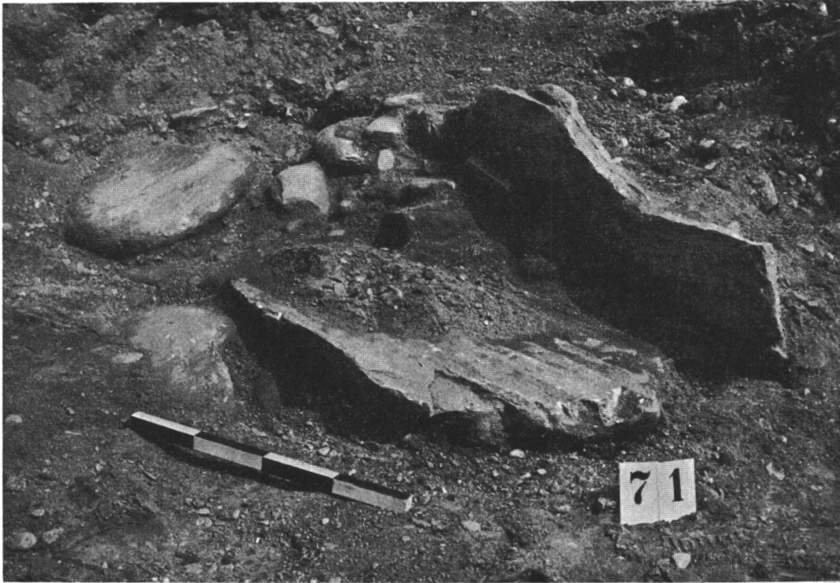
Fig. 7: Tomba a cassa di pietra n. 7. Saccheggiata. Cenere, resti di ossa e frammenti di una brocca d'argilla ammassati in un angolo

di terriccio. Una boccetta di plastica con contagocce, per le reazioni, e il liquido reattivo completano l'equipaggiamento. Se a una prima prova con colorazione giallognola segue colorazione intensamente blu, si è di fronte a alta concentrazione di fosfati. Con sondaggi elettrici si poterono identificare le tombe più periferiche della necropoli, la quale, purtroppo, si estende al di fuori della zona alluvionale della Moesa come un'isola allungata.