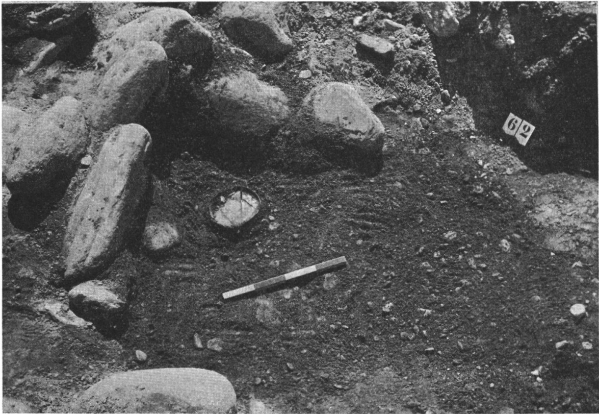
Fig. 5: Tomba n. 6, dopo lo scoprimento. Piatto di sigillata di A. Gellius nell'estremità orientale della tomba a inumazione