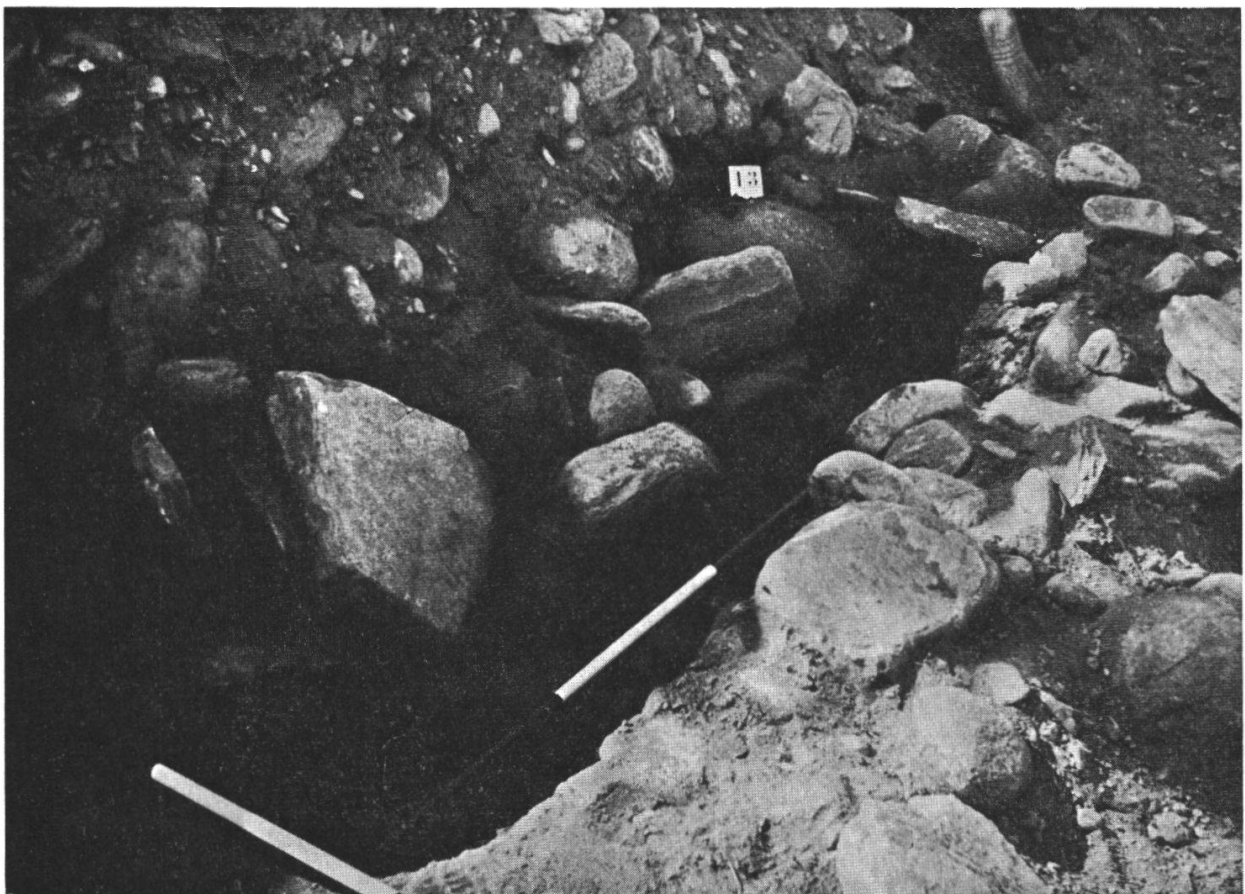
Fig. 6: Tomba n. 13, da nord-est. Una parete è rovinata