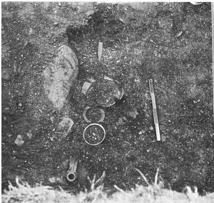
Fig. 3: Tomba n. 1, da nord. Dove giace il metro si sono trovate le sei monete