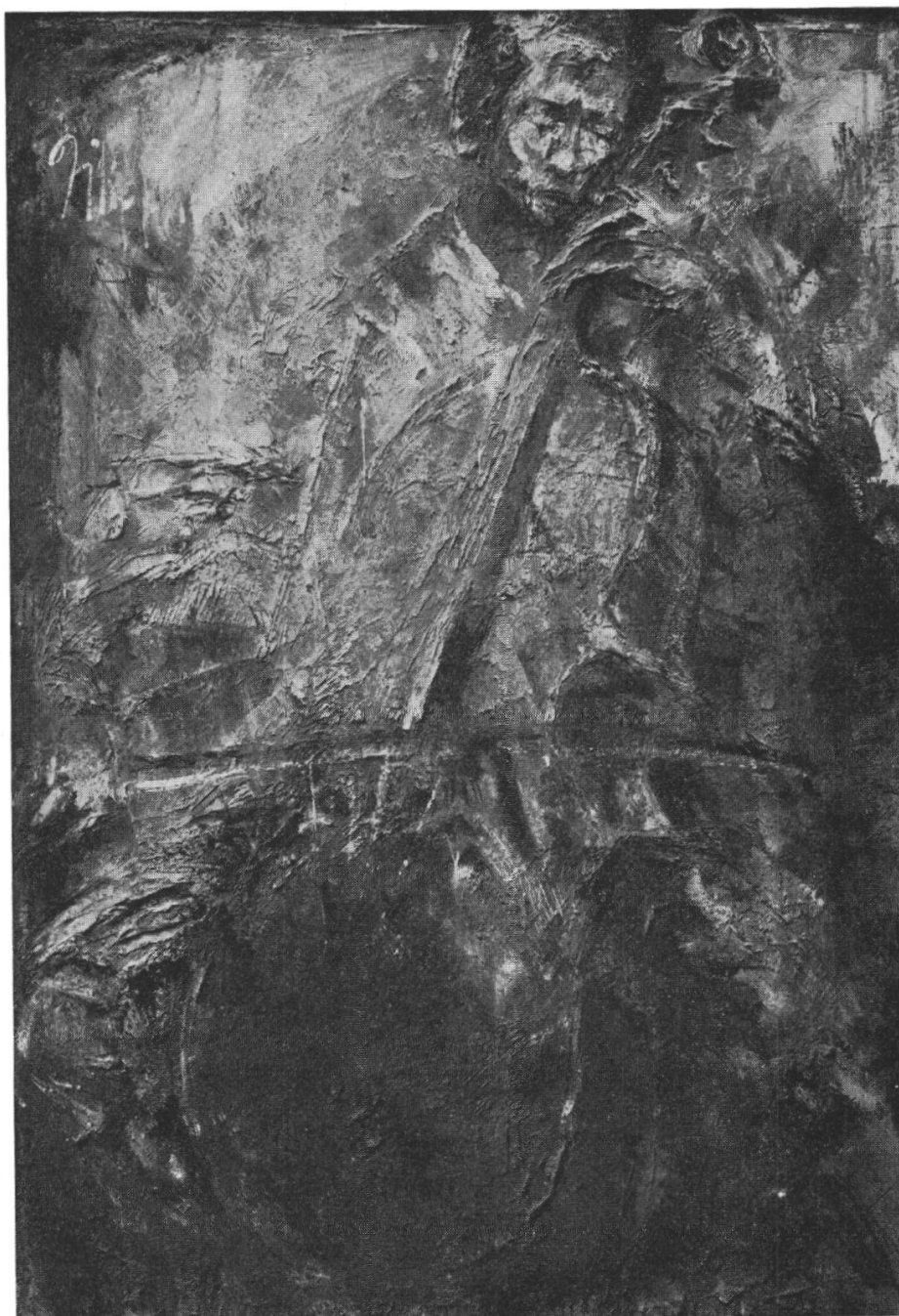
FELICE FILIPPINI : « Il grande Rocco al cello » (1965)