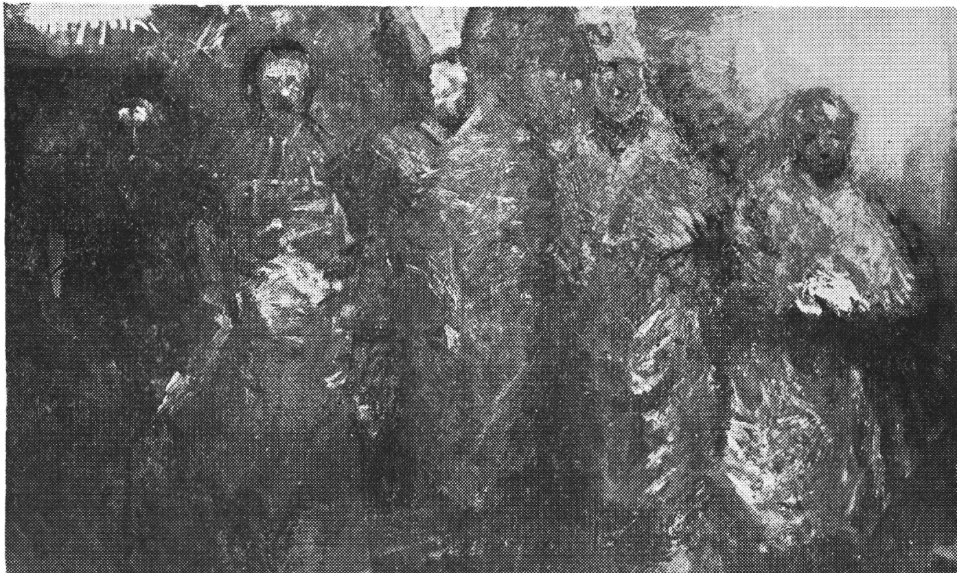
FELICE FILIPPINI: « Gli angeli della festa » (1963)

due volte: quando il pittore lo dipinge, e quando il quadro viene ceduto o trova un posto tra gli uomini. La scelta degli uomini è fattore di indicazione critica e sociale, ed è opera di collaborazione che solleva l'artista dal suo tragico isolamento — oltre, naturalmente, a farne un cittadino come gli altri, che vive del proprio lavoro. Il problema dei costi è cosa drammatica; ma ho esperienza che quando una persona umile o povera sente amore per un artista, trova sempre il modo di procurarsi un'opera sua — specie se si tratta di contemporanei che hanno vivo il sentimento della socialità. Certo che i grandissimi contemporanei sono in età avanzata, chiusi da contratti di ferro con i mercanti, dipingono poco e sarebbe assurdo che distribuissero le opere loro a tutti (anche quando possedessero il segreto di distinguere gli innamorati veri dai soliti speculatori). Nella mia piccola, modesta storia, ho fornito frutti del mio lavoro a operai, impiegati, gente modesta, a prezzi accessibili, spesso versati in rate il cui valore viene raddoppiato dalla commozione. Lo ripeto: non si può non avere il senso della socialità, che è poi la vecchia inestinguibile fraternità così viva nel nostro cuore di italiani. Quando un uomo privo di conti in banca mostra un segno d'amore per il mio lavoro (e senza ricorrere obbligatoriamente al sistema del regalo, che umilia lui e me), si trova sempre un terreno d'intesa.