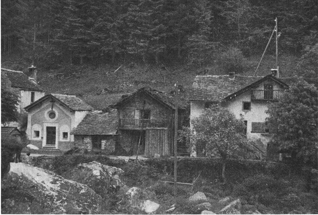
Arvigo - Al Ponte: la Fondazione Museo Moesano ha fatto restaurare la facciata della cappella e l'affresco sulla stalla al centro