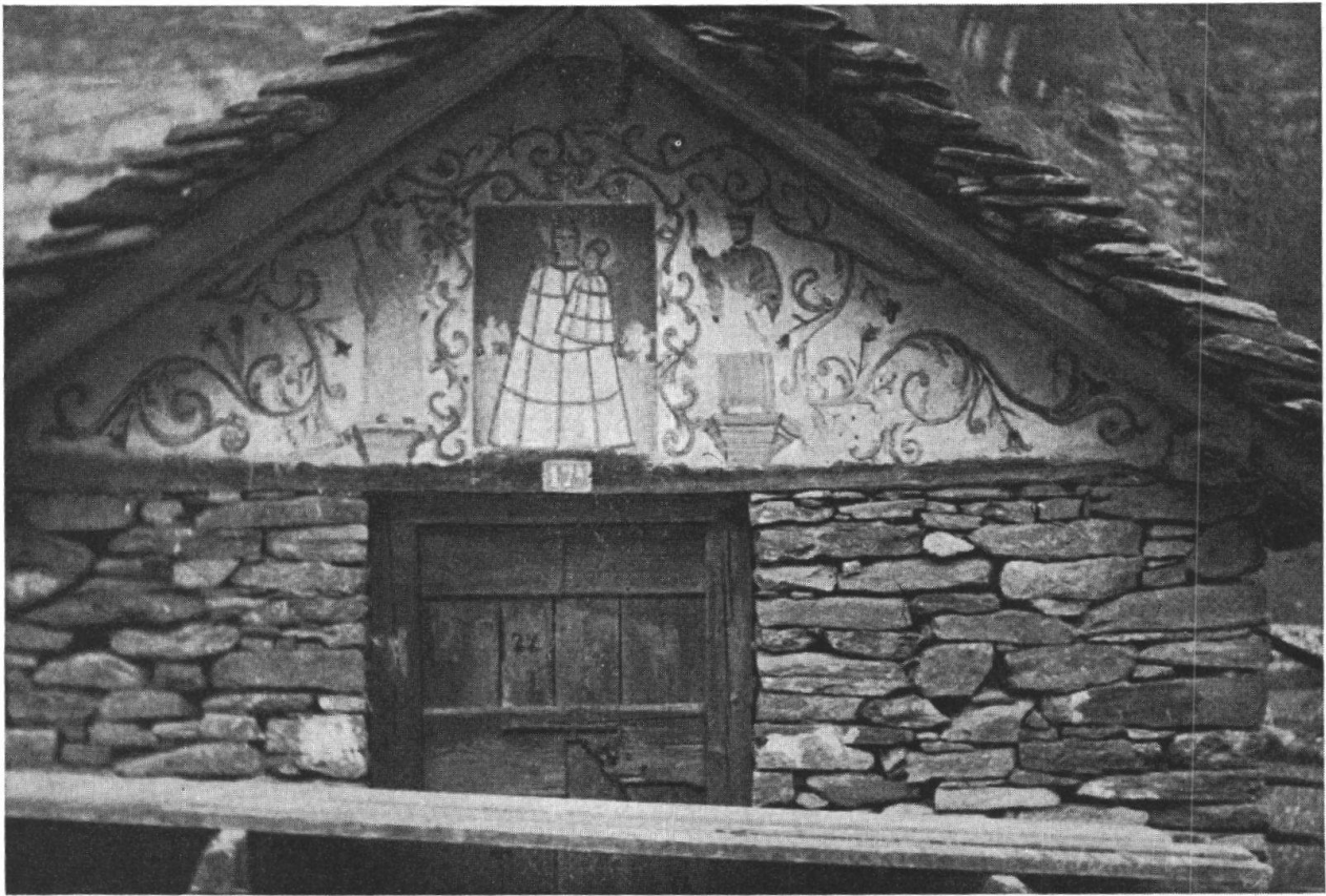
Bodio — Cauco: affresco su stalla, restaurato