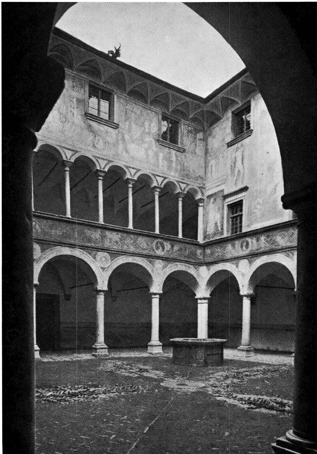
Teglio: Palazzo Besta — Particolare del cortile interno e pozzo ottagonale.